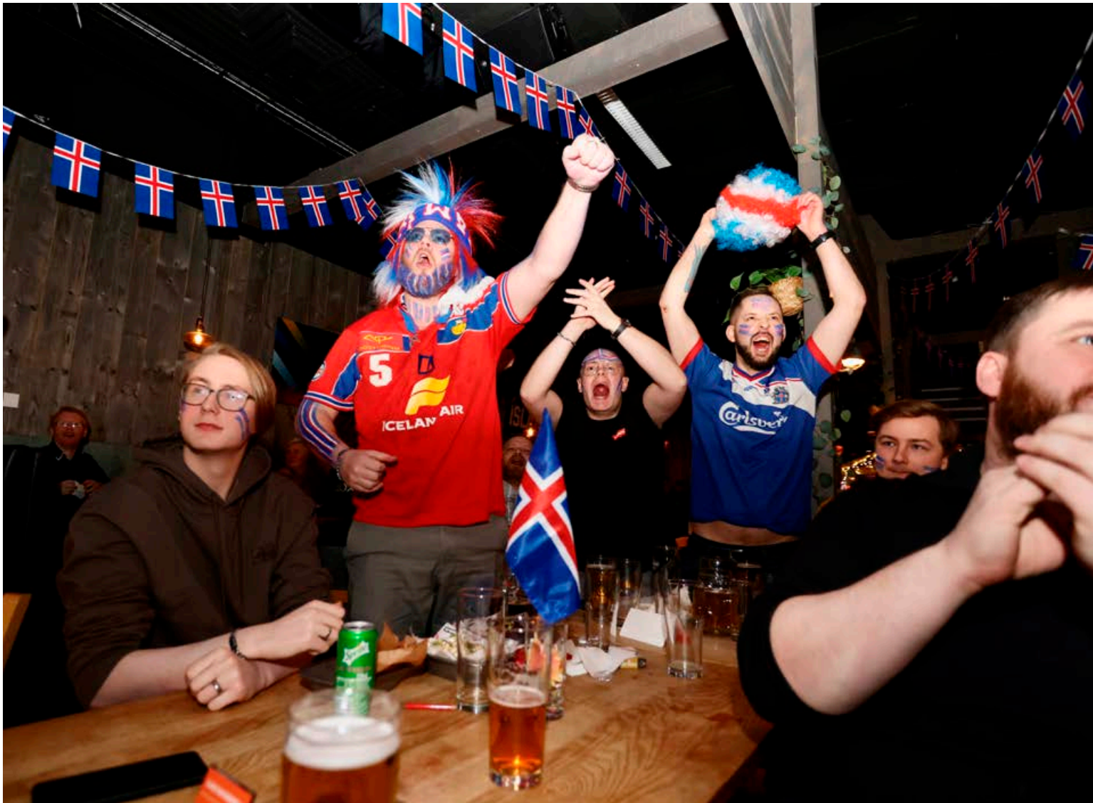
Það var rifandi stemning í Minigarðinum í gær þegar stuðningsfólk handboltalandsliðsins mætti til að horfa á fyrsta leik Íslands á HM.