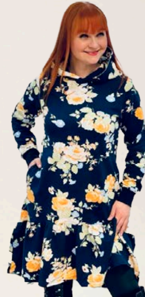
ZE ZE hettupeysukjóll Fæst líka í bleiku Stærðir 38-48 Verð áður 12.990 kr Útsöluverð 6.495 kr