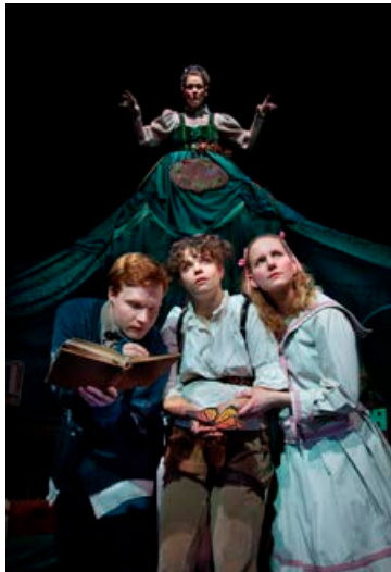
Hvíta tigrisdýrið er öðruvísi barnasýning en áður hefur sést á íslensku leiksviði.

Sagan er meira í ætt við upprunalegu Grimmsævintýrin eða Lemony Snicket með góðri slettu af gufupönki og heimsókn frá vofu Samuels Beckett. Bryndís Ósk skapar veröldina af kostgæfni og sköpunargleði, bæði í gegnum textann og sýnilega heiminn sem birtist á Litla sviðinu en hún hagnar bæði leikmyndina og búningana. Hún hikar ekki við að fjalla um erfið málefni á borð við erfðan fjölskyldusársauka og fyrirgefningu syndanna