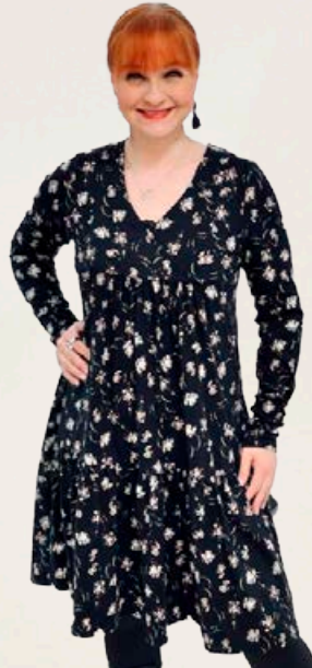
ZE ZE Goodby kjóll Fæst líka í brúnu Stærðir 38-48 Verð áður 9.990 kr Útsöluverð 5.994 kr