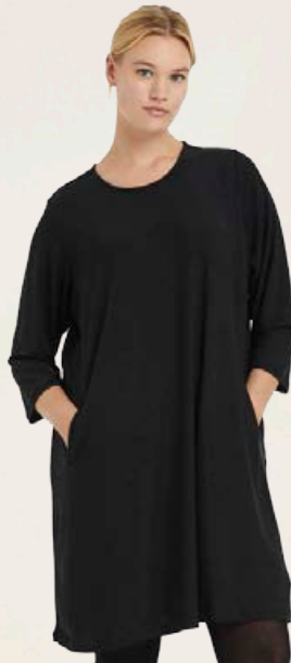
ZHENZI Jaylee glitter kjóll Fleiri litir til Stærðir 40-56 Verð áður 9.990 kr Útsöluverð 6.993 kr