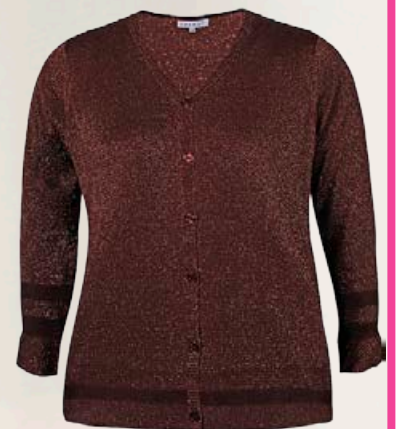
ZHENZI sparileg golla Stærðir 42-56 Verð áður 8.990 kr Útsöluverð 4.495 kr