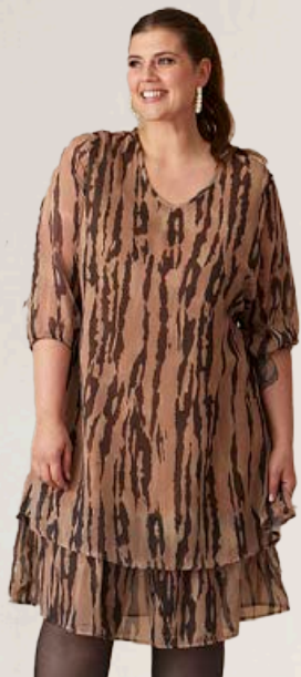
ZHENZI Paloma shifon kjóll Stærðir 42-58 Verð áður 12.990 kr Útsöluverð 9.093 kr