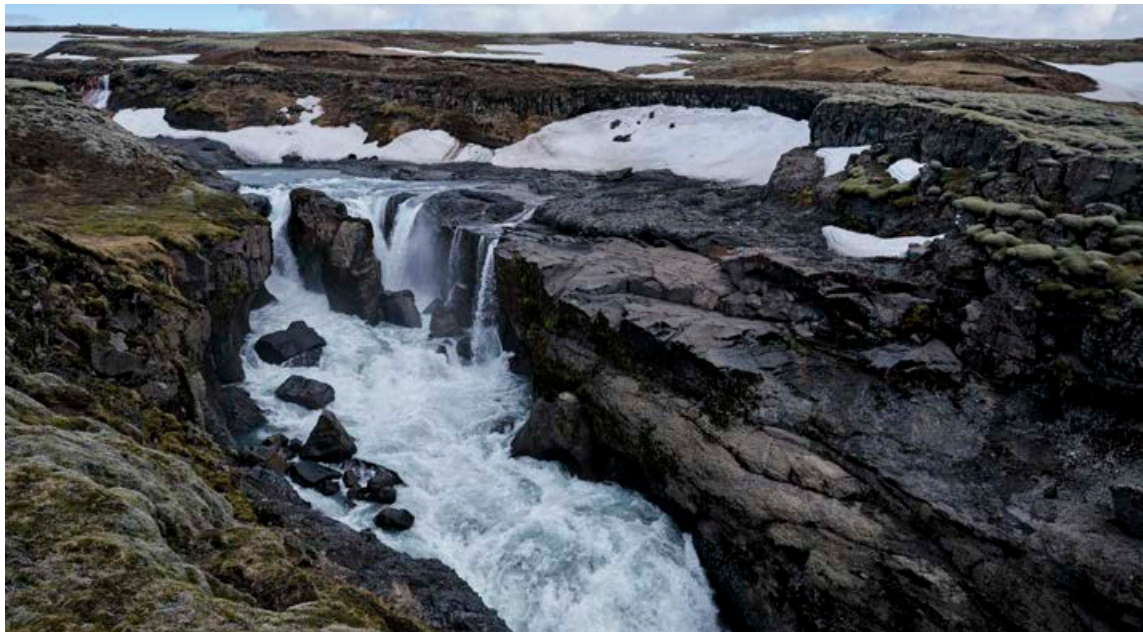
Svæðið sem myndi fara undir virkjun er algjörlega óspillt og Lambhagafossar ein helsta náttúruverlan. Vatnsrennsli þeirra myndi skerðast verulega.