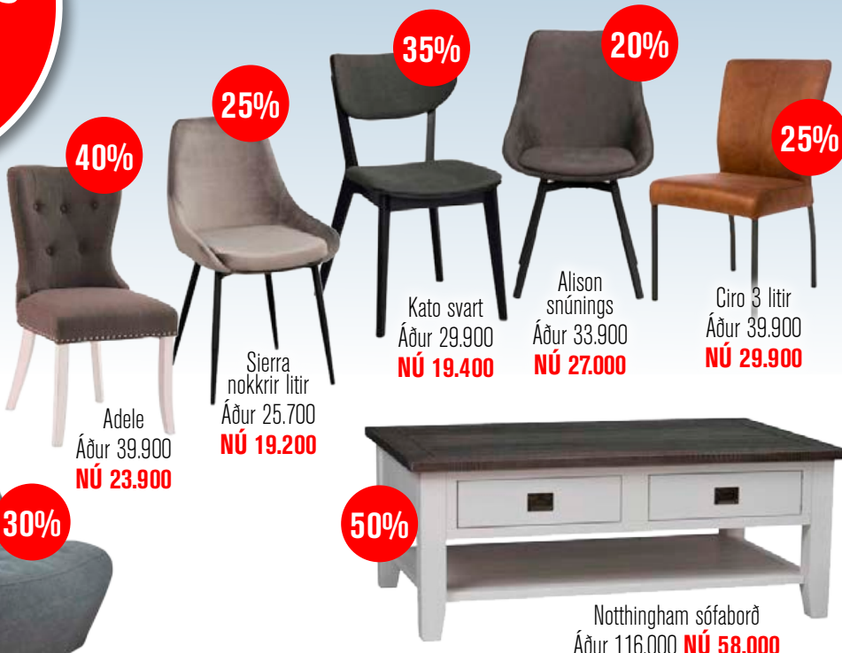
Adele Áður 39.900 NÚ 23.900