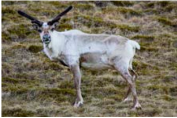
Hreindýr eru ekki vinsæl alls staðar.