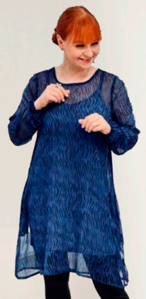
ZE ZE Faud shifon kjóll Fæst líka í brúnu Stærðir 38-46 Verð áður 10.990 kr Útsöluverð 7.693 kr