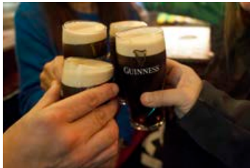
Guinness, Baileys og Jamesson eru írskir drykkir.

Ákvörðunin hefur hins vegar valdið meiri úlfúð utan landsteinanna en innan. Einkum frá