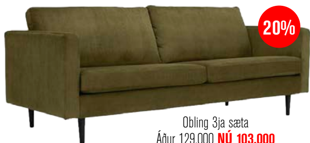
Obling 3ja sæta Áður 129.000 NÚ 103.000