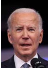
Joe Biden, forseti Bandaríkjanna

Aðspurður sagði Biden skjölín hafa verið í læstum bílskúr. Hann tók trúnaðarskjölum alvarlega. Biden segist sýna fullan samstarfsvilja í rannsókninni og að skjölín hafi verið afhent bandaríska dómsmálaráðuneytinu. Að sögn Bidens leituðu aðstoðarmenn hans á fleiri stöðum þar sem skjöl frá tíma hans sem varaforseta voru geymd og að þeirri yfirferð hafi lokið í fyrradag.