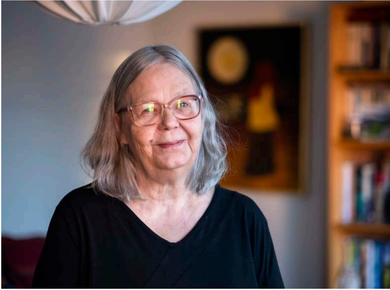
Magnea vonast til að ljúka doktorsritgerð sinni í þýðingafraeði á næstunni.