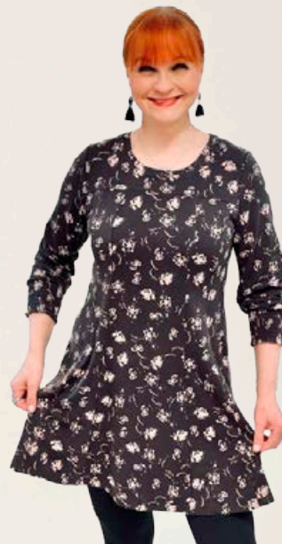
ZE ZE Goodby tunika Fæst líka í grænu Stærðir 38-46 Verð áður 8.990 kr Útsöluverð 5.394 kr