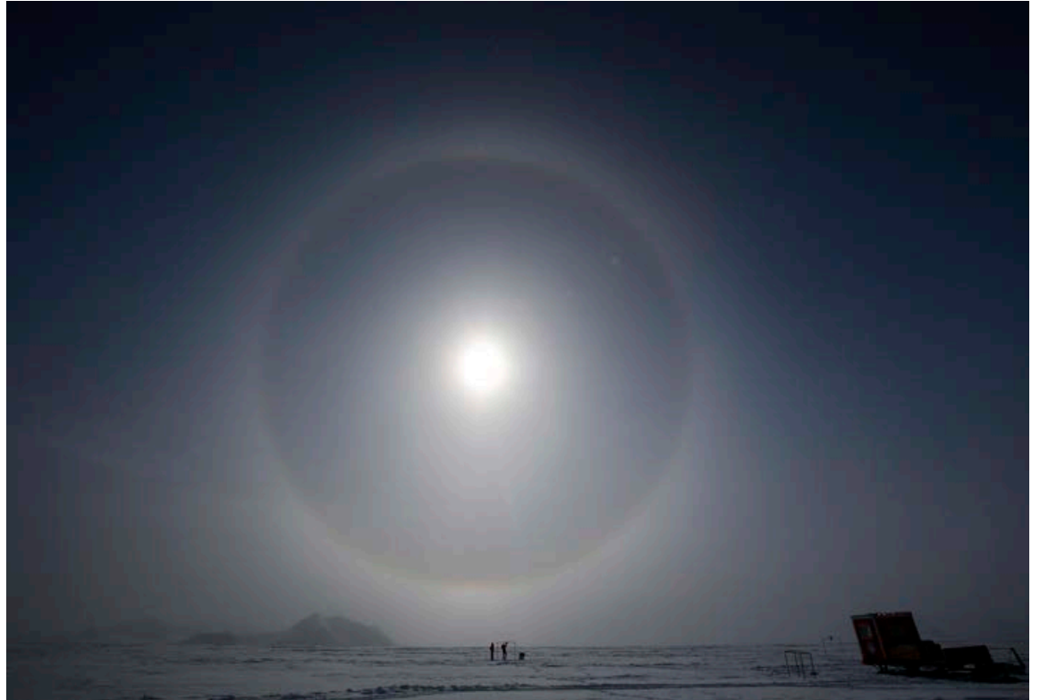
Losun manna á svokölluðum klórflúorefnum varð til þess að gat myndaðist í ósonlaginu.

stjórnavöldum í Róm en Ítalir hafa mótmælt kröftuglega og segja ákvörðunina atlögu gegn efnahag sínum. Fleiri vínframleiðslulönd, til dæmis Spánn, hafa einnig lagst gegn þessu en engu að síður fengu Írar engar mótbáru frá framkvæmdastjórn Evrópusambandsins þegar þeir tilkynntu um áætlanir sínar í sumar. Kærufresturinn er nú liðinn og Írar geta sett merkingarnar á umbúðirnar. ■