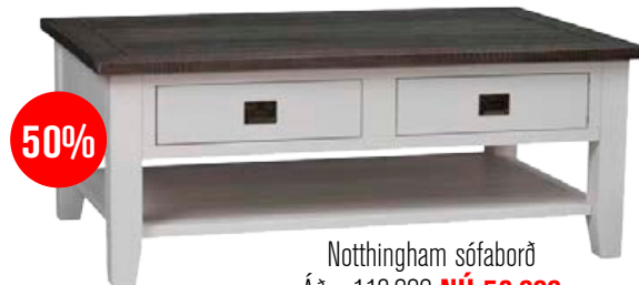
Nottingham sófaborð Áður 116.000 NÚ 58.000