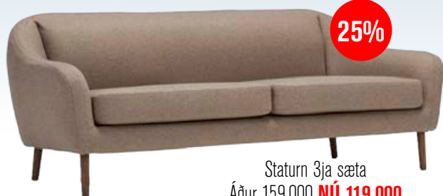
Statur 3ja sæta Áður 159.000 NÚ 119.000