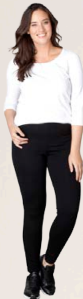
YESTA Aurelia treggings Fleiri litir til Stærðir 44-56 Verð áður 7.980 kr Útsöluverð 5.586 kr