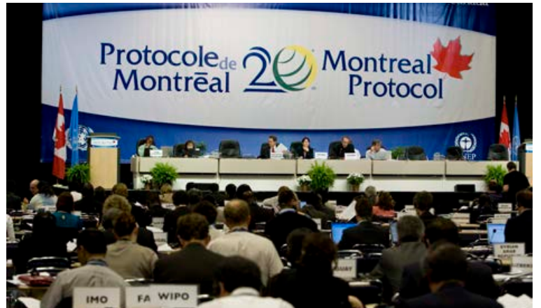
Montréal-bókunin hefur verið uppfærð níu sinnum frá samþykkt árið 1987.

„Nú sést árangurinn af þessu mikilvæga alþjóðlega átaki að draga úr og banna framleiðslu á ósoneyðandi efnum, sem skilar sér í því að þynning og einkum sú mikla þynning á ósonlaginu sem hefur átt sér stað á vormánuðum mun smám saman