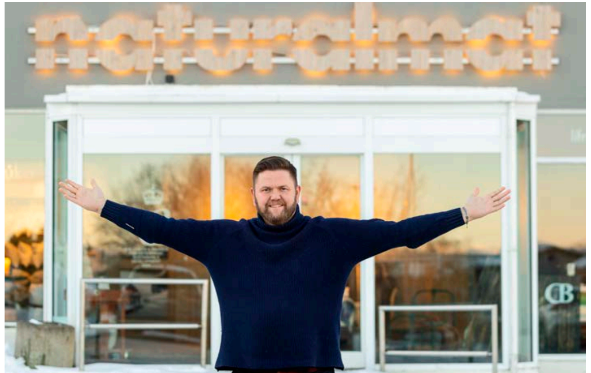
Hjónin hafa rekið saman verslunina Naturalmat – Náttúruúrúmið í um eitt og hálf tveggja ár.

„Ég hef alltaf haft gaman af því að skapa með einhverjum hætti, hvort sem það er í tónlist eða