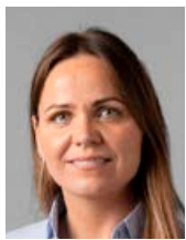
Ingibjörg Isaksen þingflokks- formaður Framsóknarflokksins

Breytingar í aldurssamsetningu þjóðarinnar eru ein af stóru áskorunum íslensks samfélags. Fjöldi eldra fólks eykst og hlutfall aldraðra af heildarmannfjölda fer ört hækkanði á næstu árum og áratugum. Kröfur eldra fólks til þjónustu hafa að sama skapi breyst verulega frá því sem áður var.