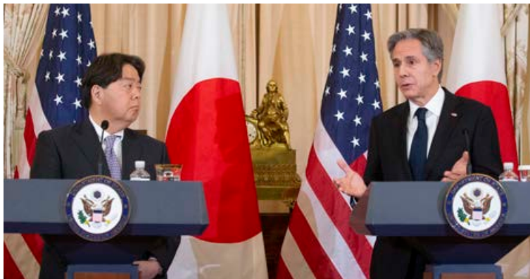
Utanríkisráðherrar Japans og Bandaríkjanna.

Trump, ásamt fleirum, hefur krafist rannsókna á máli Bidens. Fyrrverandi forsetinn spurði meðal annars á samfélagsmiðli sínum hvernær alríkislögreglan ætlaði að leita á hinum fjölmörgu heimilum Bidens og í Hvíta húsinu. ■