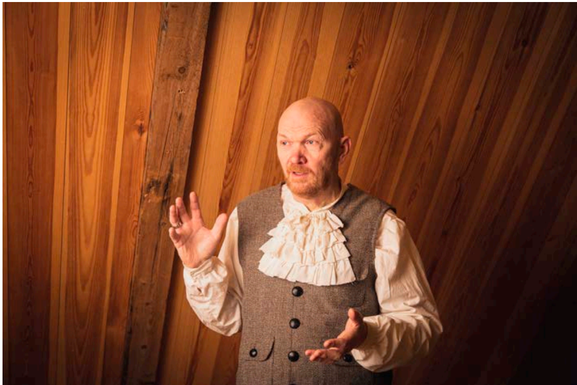
Gísli segir sýninguna fyrst og fremst vera fyrir þá sem kunna að meta lágmenningu.