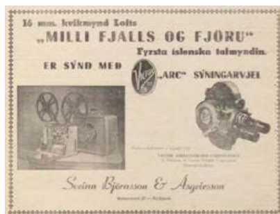
Ný sýningarvél var aðalatriðið í auglýsingunni í Morgunblaðinu.

Loftur hafði áður gert margar þögla kvikmyndir en hafði heimsótt Bandaríkin nokkrum árum áður þar