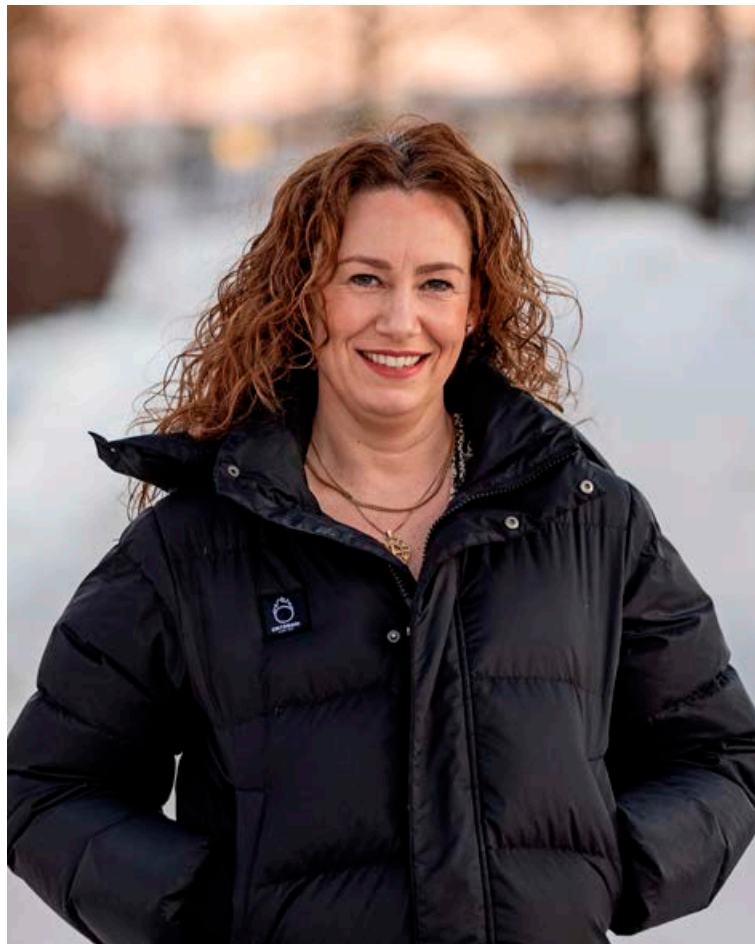
Íris hefur meðal annars notað sjálfsdáleiðslu til að stjórna eigin líðan.

„Námið hjá Dáleiðsluskóla Íslands var allt öðruvísi nám en nokkuð sem ég hafði lært áður. Miklu dýpra. Ég upplifði mjög jákvæðar breytingar á sjálfri mér í náminu og hópurinn sem ég lærði með var frábær. Að kynna undirvitundinni er mjög sérstök