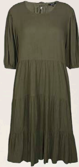
ZE ZE Bulk stuttermakjóll Fæst líka í bláu Stærðir 38-46 Verð áður 9.990 kr Útsöluverð 6.993 kr