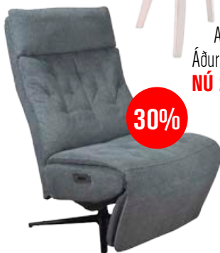
Hill hvíldarstóll með tauáklæði Áður 176.000 NÚ 123.000