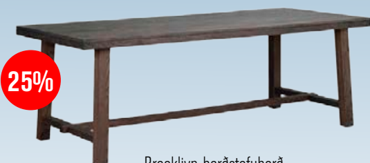
Brooklyn borðstofuborð 220x98, stækkun 2x50 cm, reykt eik – hvítuð eik Áður 199.000 NÚ 149.000