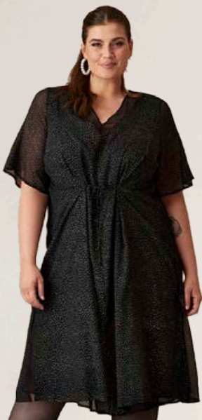
ZHENZI Megane kjóll Stærðir 42-56 Verð áður 12.990 kr Útsöluverð 9.093 kr