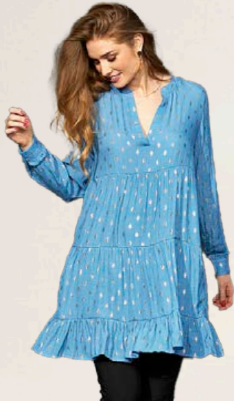
ZE ZE Atla kjóll Fæst líka í svörtu Stærðir 38-48 Verð áður 9.990 kr Útsöluverð 6.993 kr