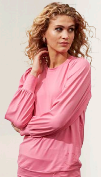
ZE ZE Tron mjúk kósýpeysa Fæst líka í svörtu Stærðir 38-46 Verð áður 5.990 kr Útsöluverð 4.193 kr