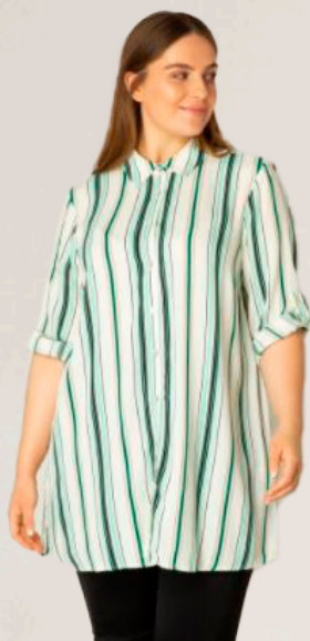
YEST/YESTA röndótt skyrta Stærðir 38-56 Verð áður 10.980 kr Útsöluverð 7.686 kr