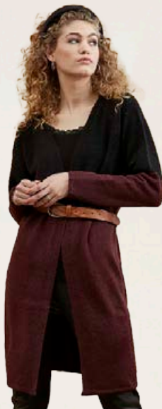
ZE ZE Síð opin peysa Fæst líka í svörtu Stærðir 40-46 Verð áður 12.990 kr Útsöluverð 6.495 kr