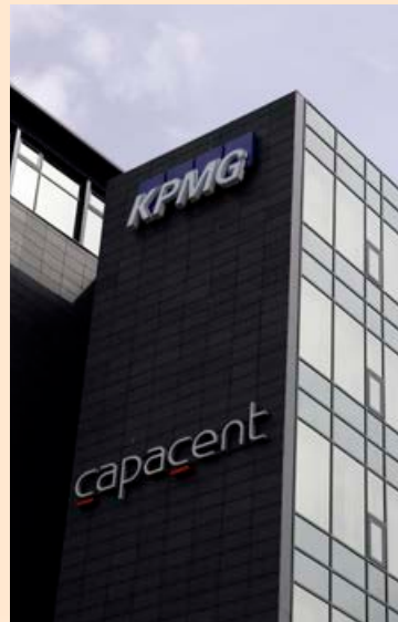
Starfsmenn Capacent á Íslandi voru samtals 44 talsins.

Capacent á Íslandi var hluti af Capacent Holding AB í Svíþjóð sem var upphaflega stofnað árið 1983