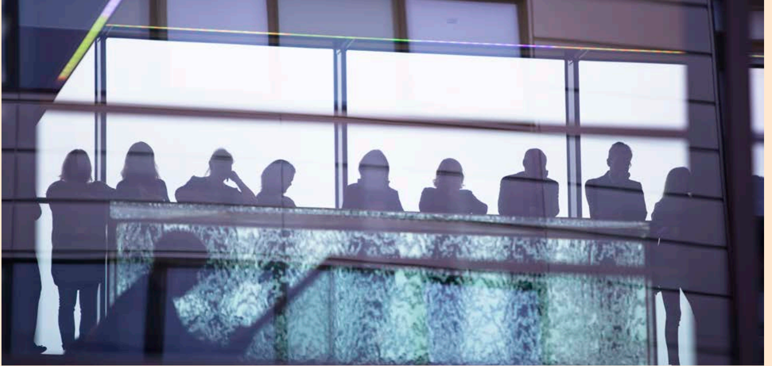
Meirihluti skráðra félaga í Kauphöllinni hefur komið tilnefningarnefnd á fót.