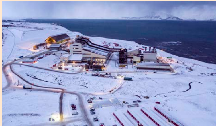
Nokkur röskun var á framleiðslu kísilveris PCC á fyrsta ársfjórðungi. Verðhækkningar á kísilmálm nýttust ekki kísilverinu.

Miklar tafir og erfiðar aðstæður á hrávörumörkuðum hafa ein-