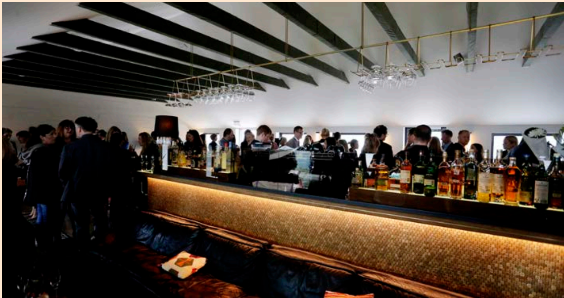
Staðurinn dregur nafn sitt af listmálaranum Jóhannesi S. Kjarval sem var með aðstöðu í húsnæðinu.

um aðgang að vinnustofunni, greiða ársgjald, og geta nýtt hana til fundarhalds og afþreyingar. Eftir því sem kemur fram í samningi Reykjavíkurborgar við Vinnustofu Kjarvals er borgin með ellefu aðgangskort, eitt fyrir hvert svið og hverja skrifstofu sem ákvað að taka þátt, en þau veita aðgang að vinnustofunni og veitingaaðstöðu alla daga vikunnar. Hvert aðgangskort kostar 120 þúsund krónur auk virðisauka-