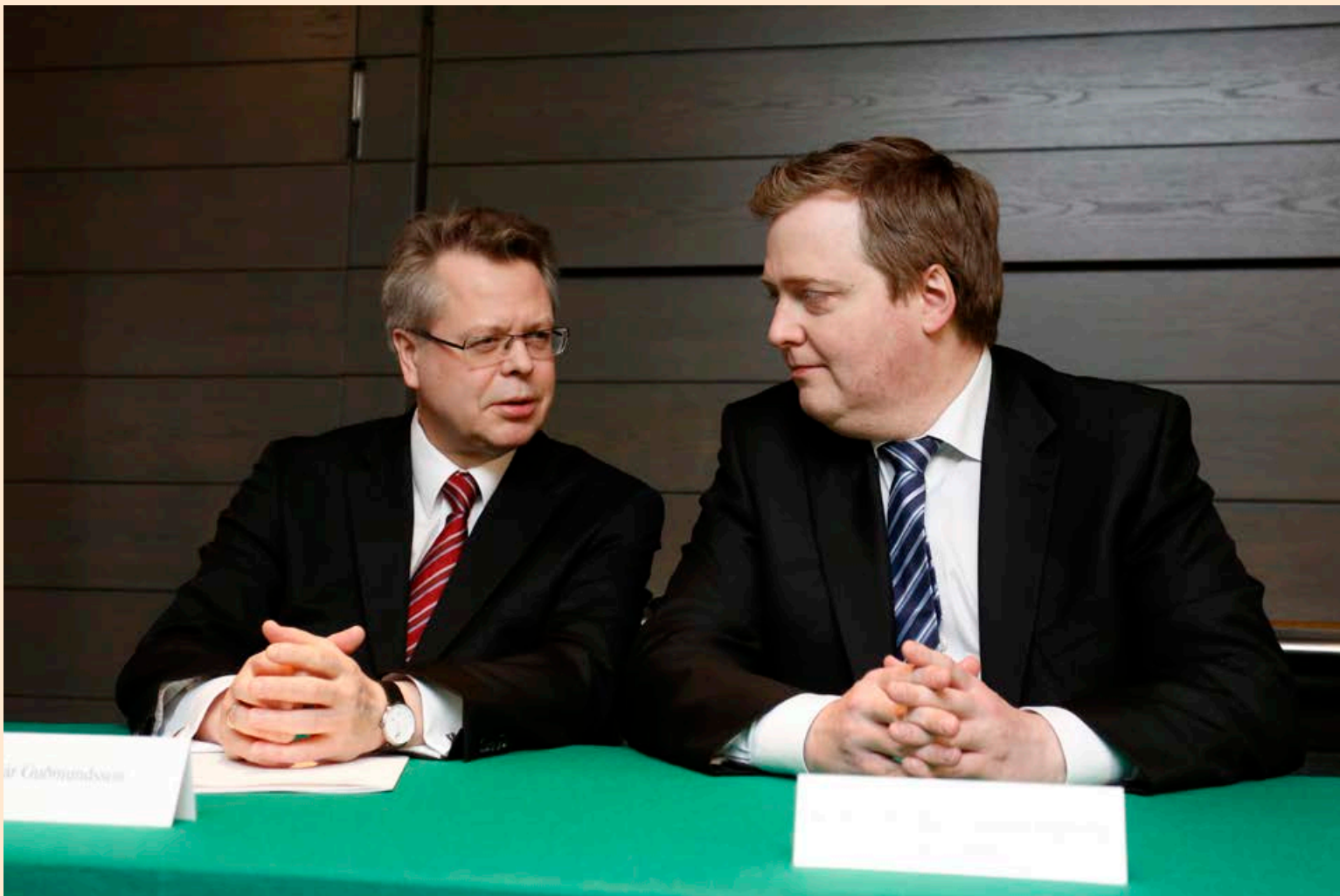
Mår Guðmundsson, fyrrverandi seðlabankastjóri, og Sigmundur Davíð Gunnlaugsson, fyrrverandi forsætisráðherra, á ársfundi Seðlabankans árið 2014.