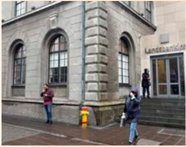
Virðisrýrnun útlána íslensku bankanna var meiri en norrænna.