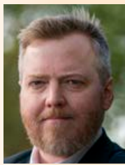
Sigmundur Davíð Gunnlaugsson , formaður Miðflokksins og fyrrverandi forsætisráðherra