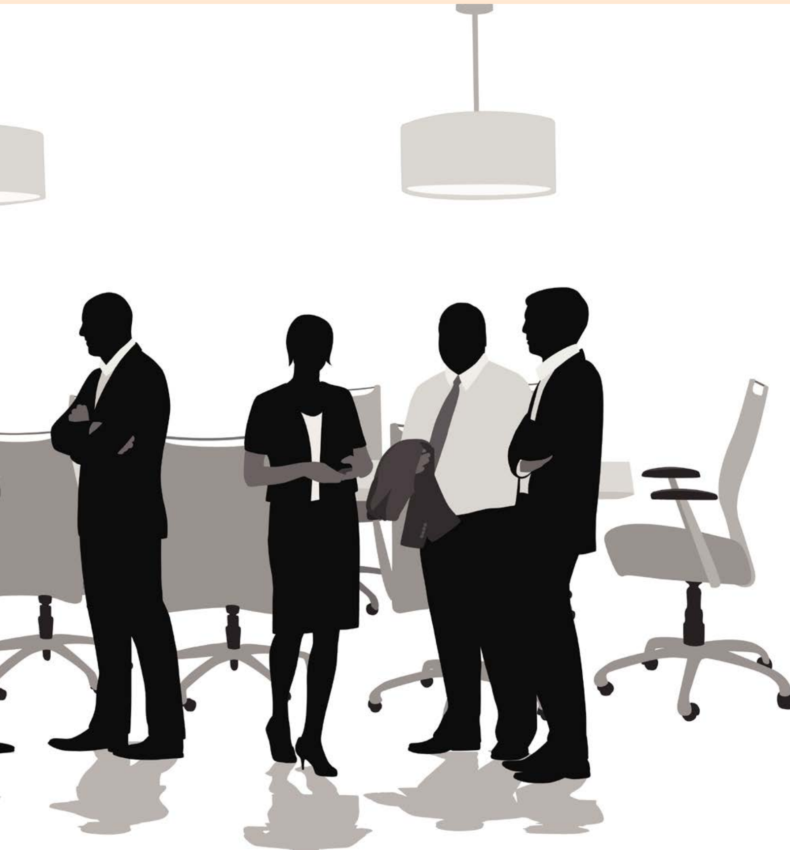
on Vance til þeirra skráðu félag sem sjóðir bandaríska sjóðastýringarfyrtækisins höfðu fjárfest í.