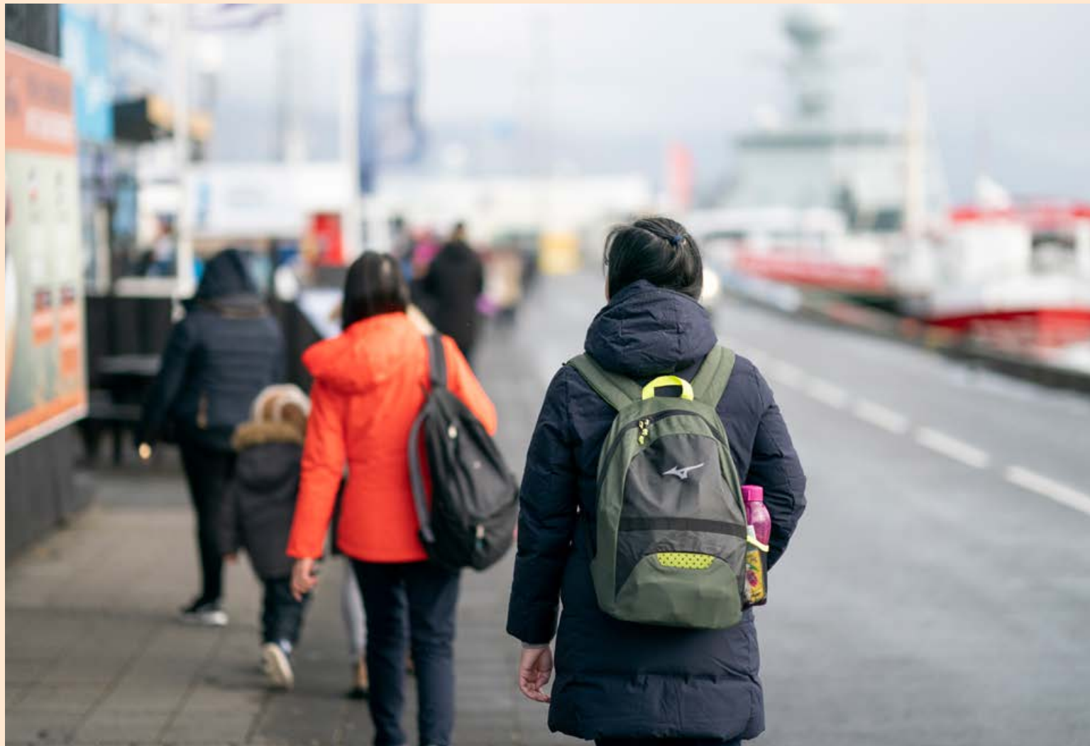
Traust til Íslands mælist mjög mikið hvað varðar meðhöndlun á COVID-19.

Þá bendir hann á að ferðamenn frá Bandaríkjunum hafi verið mjög verðmætir fyrir íslenska ferðaþjón-