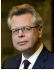
Mór Guðmundsson , fyrrverandi seðlabanka- stjóri