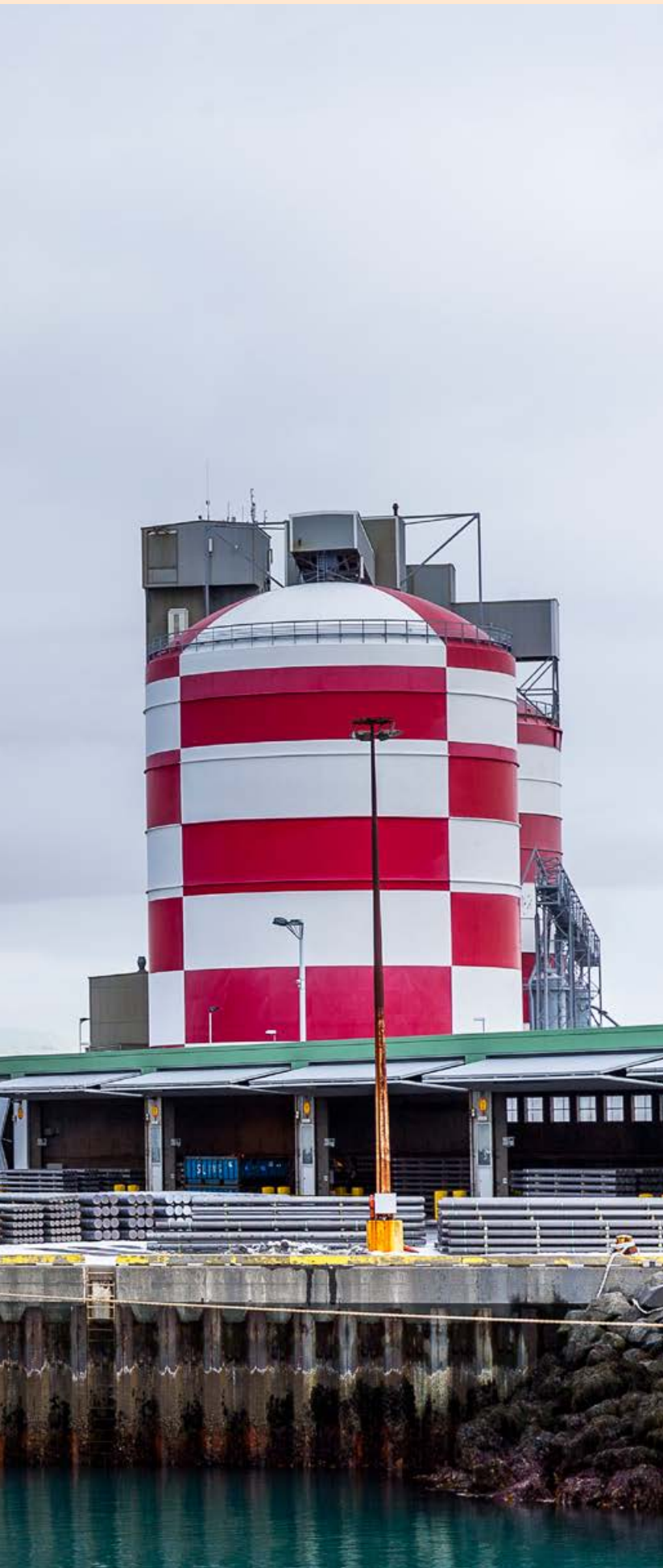
Tíma. Sem stendur nýtur ISAL allt að 25% afsláttar af samningsverði.

» Ad því er kemur fram í umfangullun nýsjálenska blaðamannsins Richard Harman, tapaði álverið við Tiwai Point um 46 milljónum dala á árinu 2019, eða um 6,5 milljörðum króna. Til samanburðar tapaði álverið í Straumsvík um 13 milljörðum króna á síðasta ári.