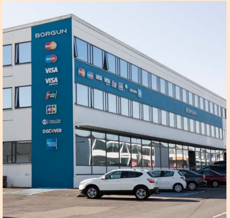
Formlegt sölufélagið Borgunar hófst í janúar 2019.