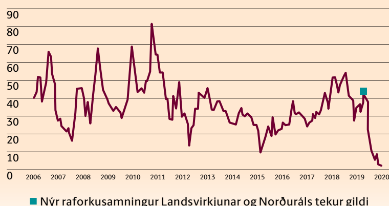
Verðþróun Nord Pool-markaðarins 2006–2020 EUR/MWH

■ Nýr raforkusamningur Landsvirkjunar og Norðuráls tekur gildi