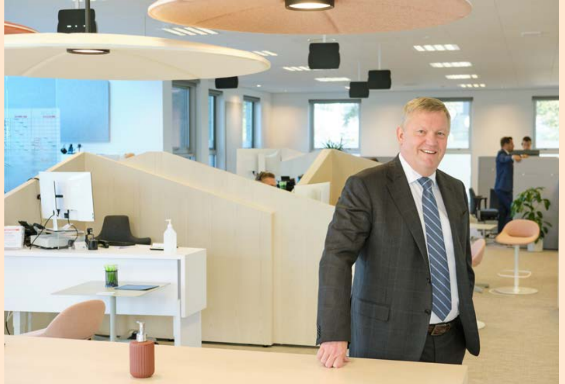
Hermann segir að tryggingareksturinn hafi verið arðbær síðastliðin fimm ár.

Samsett hlutfall, það er hversu vel tókst til að láta iðgjöld standa undir útgjöldum vegna tjóna, var um 98 prósent á fyrri helmingi árs. Vátryggingastarfsemin er rekin með hagnaði þegar hlutfallið er undir hundrað.