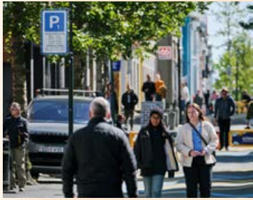
Iðandi mannlíf á Laugavegi.