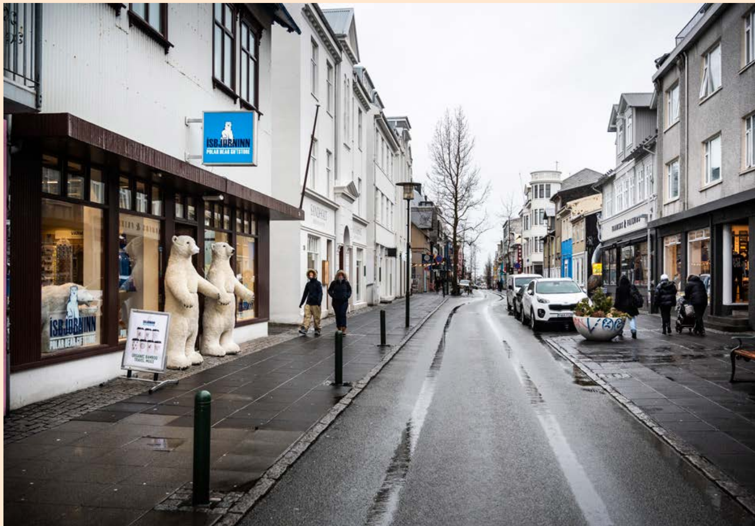
Aðgerðir stjórnvalda eru igildi lokunar landsins að sögn formanns FHG.

„En það sem er mikilvægt að hafa í huga,“ bætur Kristófer við, „er að með lögum um greiðsluskjól er kominn lagarammi um fjárhagslega endurskipulagningu fyrirtækja, sem styrkir samningsstöðuna þegar samið er við kröfuhafa. Ef gengið er of hart að skuldunaut á hann þess kost að fara í skjól og skipuleggja fjárhaginn.“