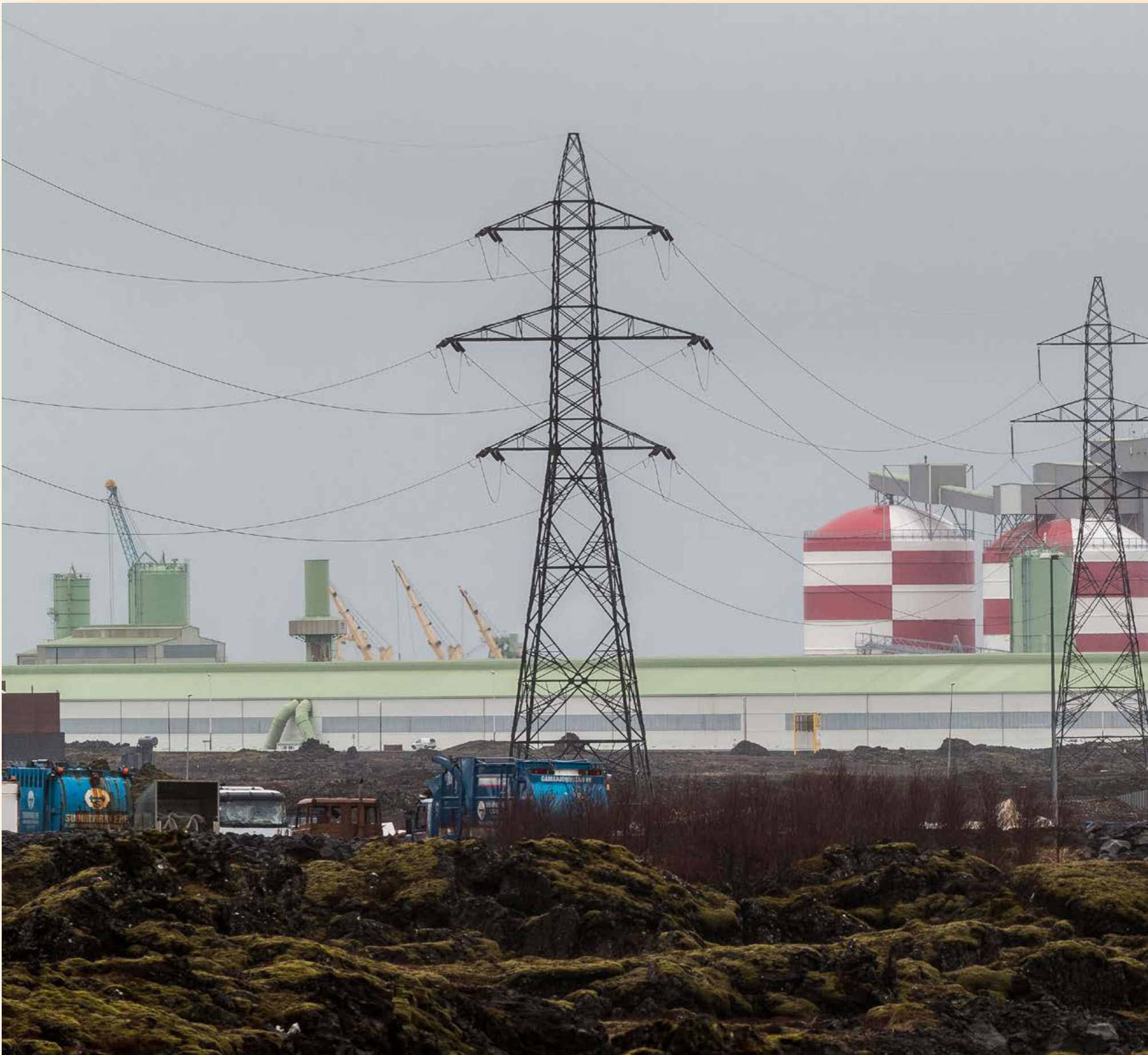
Rio Tinto Alcan lokaði nýlega einu álvera sinna á Nýja-Sjálandi vegna háskostnaðar. Álverið sem um ræðir var tvöfalt stærra en það í Straumsvík og tap þess var helmingi minna. FRÉTTABLAÐIÐ/VILHELM