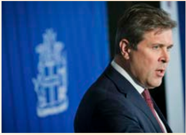
Bjarni Benediktsson, fjármálaráðherra.