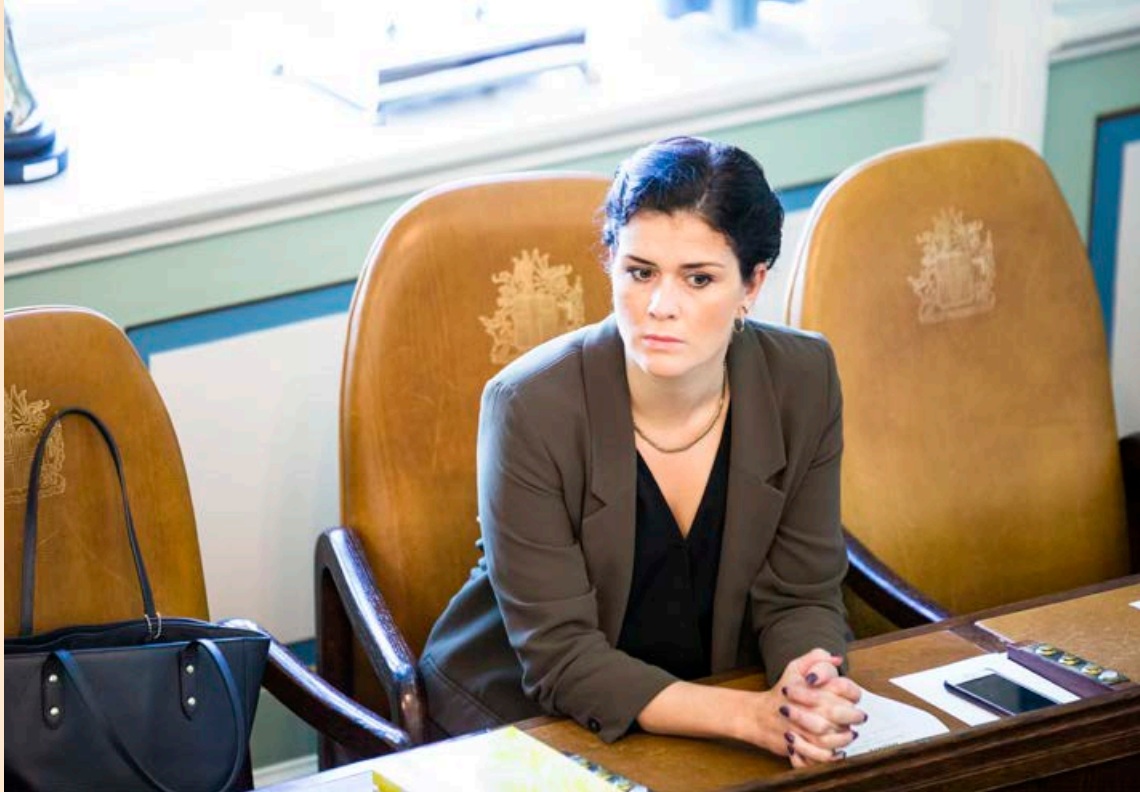
Iðnaðar- og orkumálaráðherra segir að lagabreytingarnar auki skilvirkni raforkumarkaðar.

Frumvarp iðnaðarráðherra kemur fram í kjölfar greiningarvinnu Deloitte, sem iðnaðarráðuneytið fékk til að skoða regluverk og fyrirkomulag flutnings og dreifingu raforku á Íslandi. En þýska greiningarfyrirtækið Fraunhofer hafði uppi ábendingar um fyrirkomulag flutnings raforku í skýrslu sinni um samkeppnishæfni raforkumarkaðar á Íslandi með tilliti til samkeppnishæfni stóriðju. Ráðuneytinu bárust drög að skýrslunni undir lok síðasta árs.