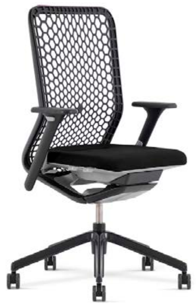
YOU TEAM LISTAVERÐ 279.900 KR. NÚ 139.950 KR. TAKMARKAÐ MAGN