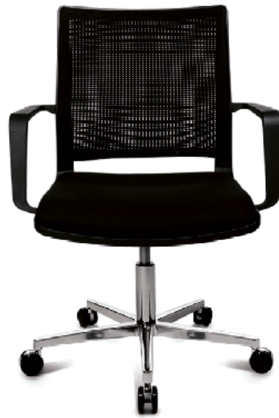
W70 FUNDARSTÓLL MEÐ DONDOLA LISTAVERÐ 148.900 KR. NÚ 74.450 KR.