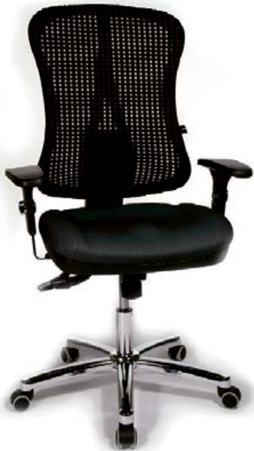
HEADPOINT LISTAVERÐ 93.900 KR. NÚ 59.900 KR.