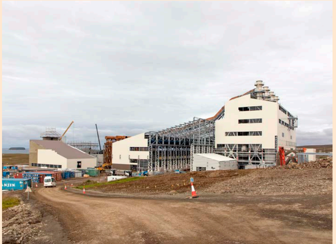
Kísilverið er byrjað að auglýsa eftir starfsfólki til að undirbúa endurræingu.

Jafnframt var samþykkt að strax í kjölfar lækkunar skyldi hlutfé félagsins hækkað um 4,5 milljarða króna með útgáfu hluta til eigenda