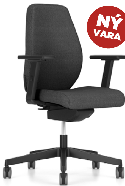
BJARG MB LISTAVERÐ 94.900 KR. 59.900 KR. KYNNINGARVERÐ