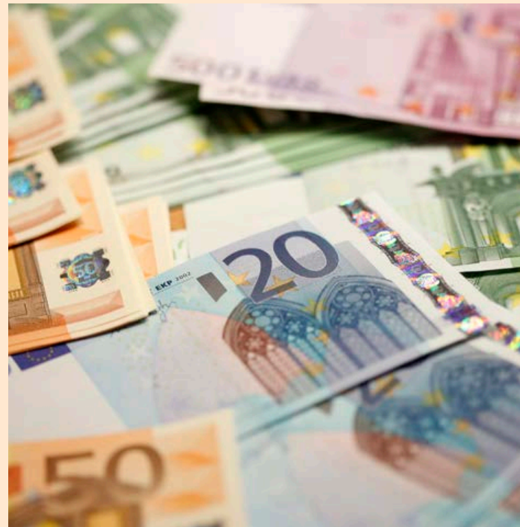
Hlutfall erlendra eigna er yfir 40 prósent hjá stærstu lífeyrissjóðunum.