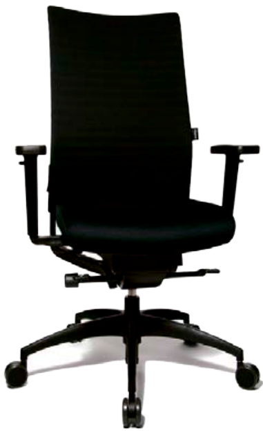
WAGNER ERGOMEDIC 100-3 LISTAVERÐ 229.900 KR. NÚ 148.900 KR.