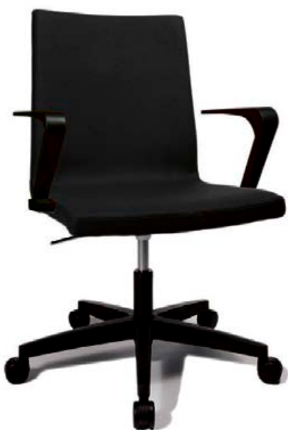
CUBE FUNDARSTÓLL MEÐ ÖRMUM LISTAVERÐ 88.300 KR. NÚ 52.900 KR. TIL Á LAGER Í DÖKK- OG LJÓSGRÁU