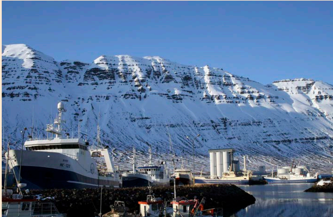
Sildarvinnslan var stofnuð í Neskaupstað árið 1957. Mest öll starfsemi fyrirtækisins er enn þá þar.

Atburði ársins 2020 verður hins vegar að hafa í huga þó að afkoma ársins 2019 sé nýjustu opinberu gögn sem hægt er að styðjast við. Sildarvinnslan gekk frá kaupum á útgerðarfélaginu Bergi í gegnum dótturfélag sitt Berg-Hugin í október síðastliðnum, en aflaverðmæti Sildarvinnslunnar og dótturfélaga er núna um það bil jafnt skipt milli