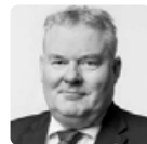
▶ Sigurður Ingi Jóhannsson samgöngu- og sveitarstjórnarráðherra