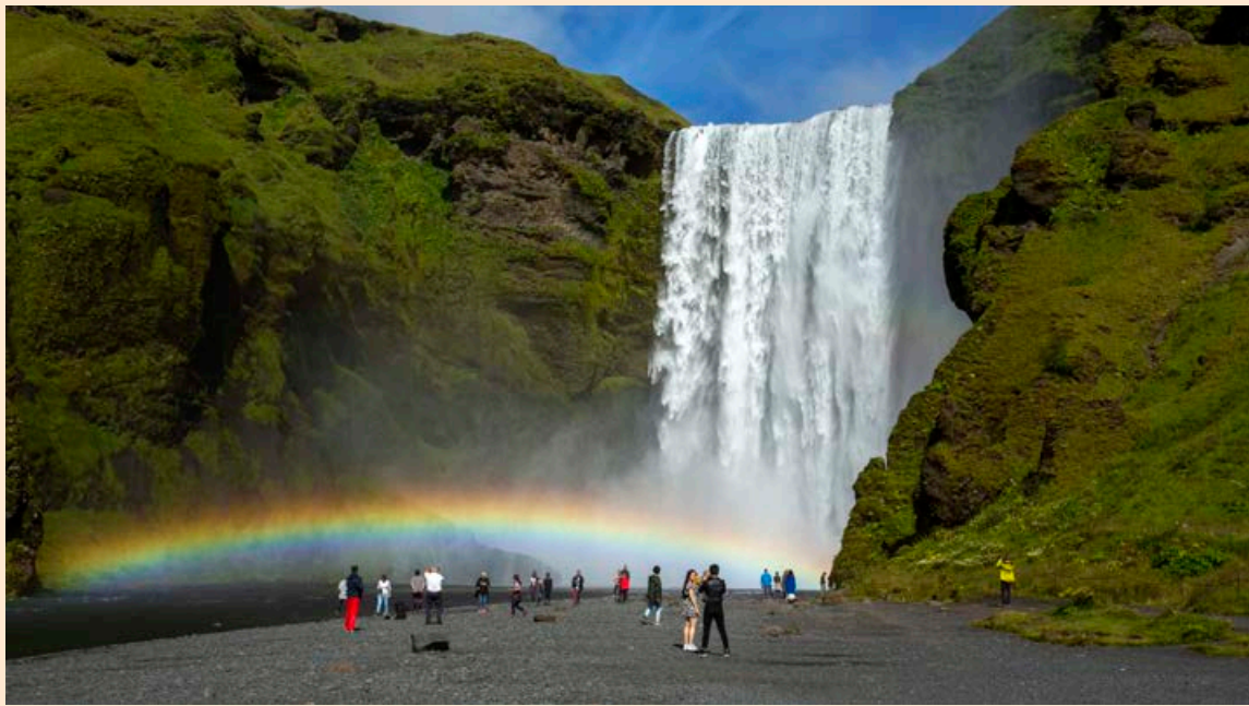
Umfjöllun um Ísland í erlendum fjölmiðlum er innan við tíundi hluti af því sem hún var í sumar.