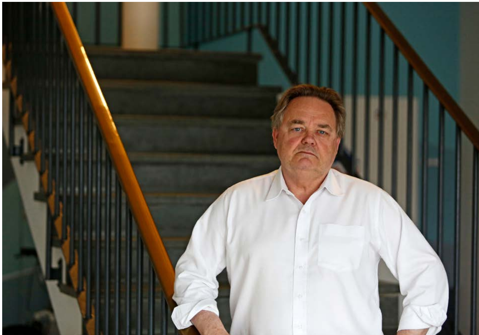
Fólk sem beitir ofbeldi í nánnum samböndum hefur í langflestum tilfellum orðið fyrir eða upplifað ofbeldi í æsku og er með mikla áfallasögu sem þarf að vinna í og það getur verið mjög flókið. Þannig að þó að það sé hægt að hjálpa fólk er samt engin ein lausn sem virkar fyrir alla.

Margir staldra við kostnaðinn við að fara til sálfræðings vegna vandamála sinna, en það þarf ekki í þessu tilfelli, því úrræðið er niðurgreitt af félagsmálaráðuneytinu. Það þarf því bara að borga