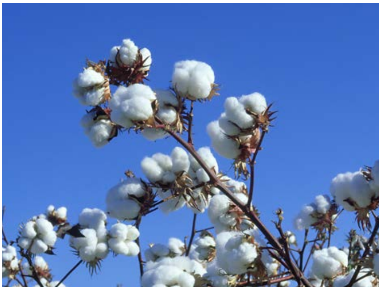
Það er ekki sama hvort það er bómull eða séra bómull.

heilbrigði jarðvegsins, vatnsaðgangs og fleira. Um 12,5 prósent af allri bómull á markaðnum eru framleidd undir þessum hatti. Einnig má nefna framleiðslu á lífrænni bómull. Hún er ræktuð án notkunar skordýraeiturs, genabreyttra fræja og manngerðs áburðar.