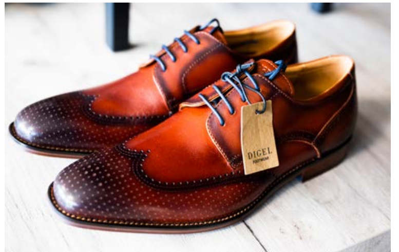
Í versluninni er vönduð skólina frá þýska merkinu Digel.