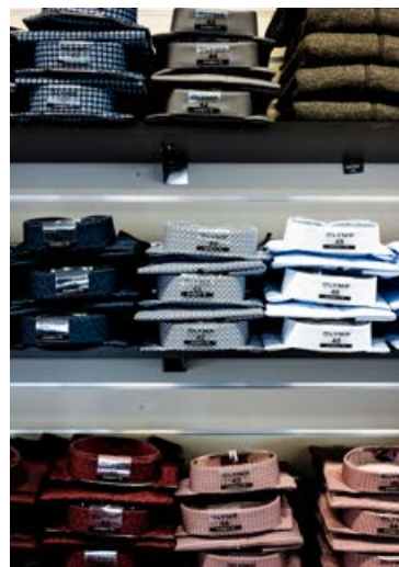
Verslunin er með úrval af skyrtum.

„Það verður svipað vöruúrval á Laugavegi og í Ármúla, en Laugavegurinn verður meira í boutique-stíl. Þar verðum við til dæmis með Harris Tweed föt sem við erum nýkomin með frá Buckrout Tailoring og vörur frá JOOP sem er klassískt merki með glæsilegan fatnað.“