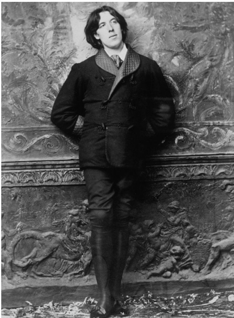
Oscar Wilde í Bandaríkjunum í janúar árið 1882.

Þau giftust árið 1884 og bjuggu í fjögurra hæða húsi í London sem Wilde eyddi miklum fjármunum í að láta endurgera. Wilde var idinn við skrif, vinsældir hans fóru stöðugt vaxandi og um skeið var mikið um gestagang á heimilinu. Hjónin eignuðust tvo drengi, Cyril og Vyvyan. Árið 1887 tók hann við