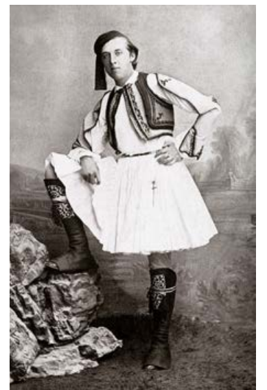
Oscar Wilde í grískum búningi árið 1877 en hann þótti skara fram úr við þýðingar á grískum og latneskum textum.

„Oscar Wilde var hár maður vexti, augun grá, fjörmikil og fögur með afbrigðum; hárið mikið og með jörpum ljóma. Hann fann mikið til útlits síns, og þótti vel, þegar honum var líkt við rómverskan keisara frá hnignunaröldinni. Í búnaði var hann allra