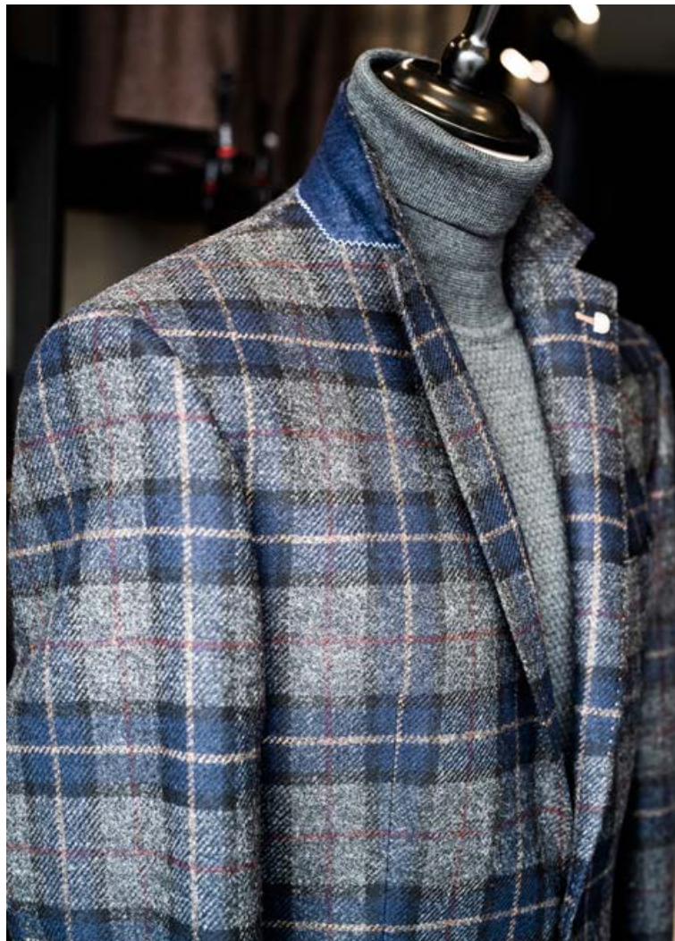
Vandaður jakki og peysa frá Digel.

Sólveig segir að þau hafi sérstaklega fundið fyrir þessari ruglingslegu aðkomu þegar Reykjavíkurborg ákvað að snúa umferðarflaumum frá Frakkastíg að Klapparstíg við, en hann hélst þannig síðasta vetur og hefur mætt