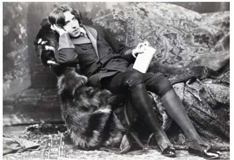
Oscar Wilde þótti og þykir enn einstaklega hnyttinn og heillandi.

Samhliða vaxandi vinsældum eyddi Wilde sífellt meiri tíma utan heimilisins og þá helst í félagsskap ungra fállegra manna. Árið 1891 kynntist hann svo ungum manni, lávarðinum Alfred Douglas, en samband þeirra átti eftir að leggja líf Wilde í rúst. Faðir Alfred, aðalsmaðurinn John Douglas, var afar ósáttur við samband þeirra og dreifði andstyggilegum orðrómum um Wilde sem leiddi til þess að Wilde ákvað að lögsækja hann fyrir meiðyrði. Úr urðu alræmd réttarhöld þar sem verjendur Douglas ásökuðu Wilde um kynvillu og fór það svo að Douglas var fundinn saklaus. Wilde var dæmdur til að greiða lögfræðikostnað Douglas og var svo sjálfur fundinn sekur um ósiðsemi og samkynhneigð (e. sodomy) og dæmdur til tveggja ára