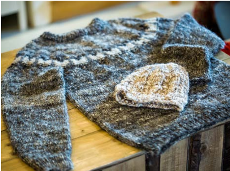
Ullin er falleg, hlý, endingargóð og umhverfisvæn.

Það eru þó til sjálfbærar aðferðir við framleiðslu á bómull sem taka til greina áhrif framleiðslunnar á umhverfið. The Better Cotton Initiative er alþjóðlegt átak sem styrkir ræktendur víða um heim í átt að sjálfbærari bómullarframleiðslu þar sem tekið er tillit til