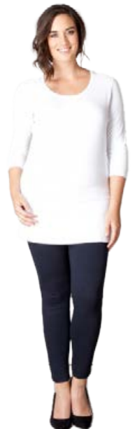
YESTA Amel kvartermabolur Fæst líka í Svörtu og navybláu Stærðir 44-60, Verð kr. 7.980