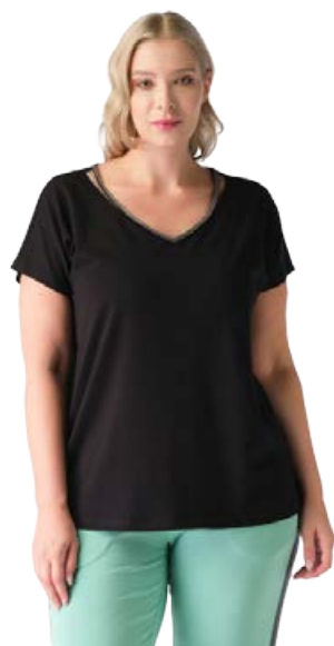
NO SECRET stuttermabolur Stærðir 42-56 Verð kr. 7.980