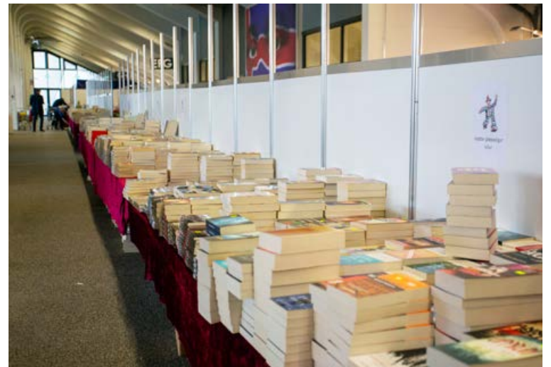
Nú er rétti tíminn til að sækja sér gott lesefni.