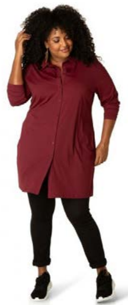
IVY BELLA Sophie hálfisð skyrta Stærðir 46-52 Verð kr. 10.980