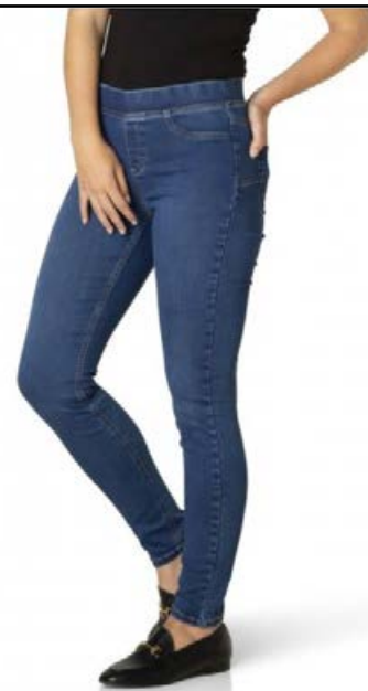
YEST - Tess gallabuxur Fást líka í svörtu og ljósbláu Stærðir 36-48 Verð kr. 10.980