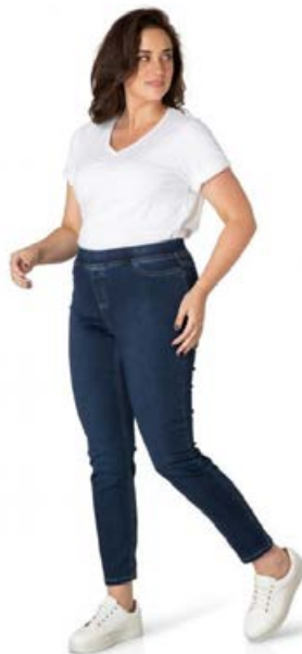
YESTA – TessA gallabuxur Fást líka í svörtu og ljósbláu Stærðir 44-60 Verð kr. 10.980