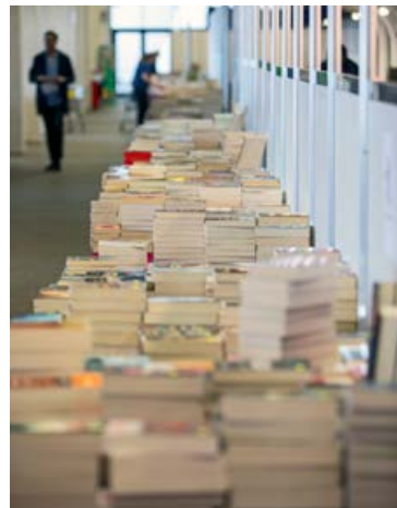
Glæpasagnalengjan er ekkert smærði á Laugardalsvelli.