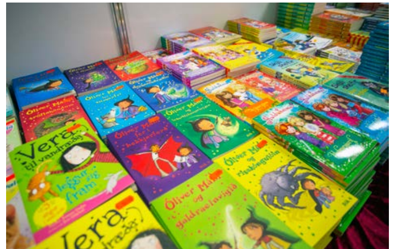
Mikið úrval er af bókum fyrir yngstu kynslóðina.

Bókamarkaðurinn verður opinn alla daga frá 10-21.