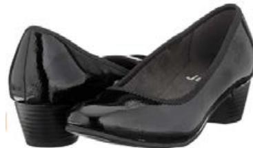
JANA lakkskór Fást líka mattir Stærðir 37-42 Verð kr. 8.990