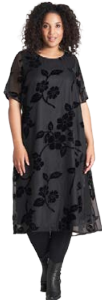
STUDIO shiffonkjóll Stærðir 40-56 Verð kr. 24.980