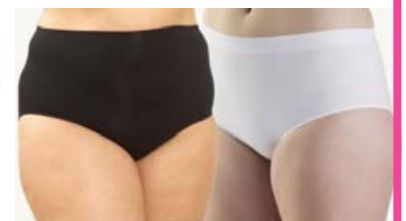
FESTIVAL nærbuxur Fást í svörtu og hvítu Stærðir 38-56 Verð kr. 2.990