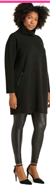
YEST Catelyne Peysukjóll Stærðir 36-48 Verð kr. 11.980