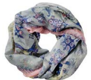
LASESSOR silkiklútur Múmín Fleiri litir til Hringur 70x80 cm Verð kr. 6.990