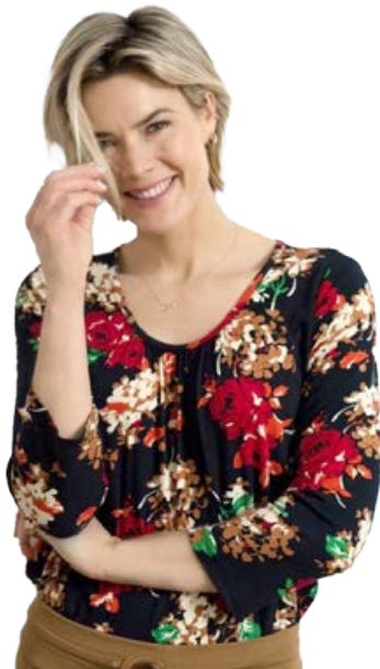
ES&SY bolur Stærðir 38-46 Verð kr. 5.980