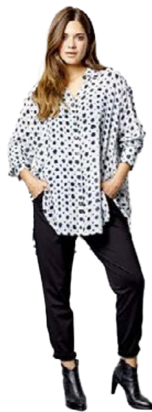
QUE „oversized“ Skyrta Stærðir 38-52 Verð kr. 27.980