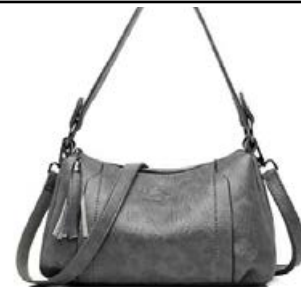
Hliðartaska með tveimur ólum Fleiri litir til Verð kr. 6.990