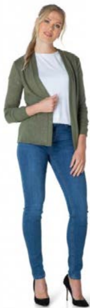
ES&SY golla með glitter Fæst í svöru, bláu og ólífugrænu Stærðir 38-46 Verð kr. 6.980