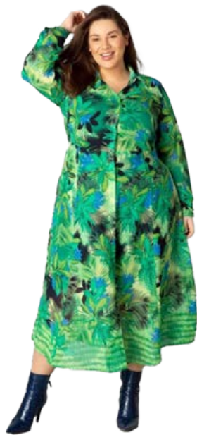
YESTA shiffonkjóll Stærðir 44-54, Verð kr. 18.980