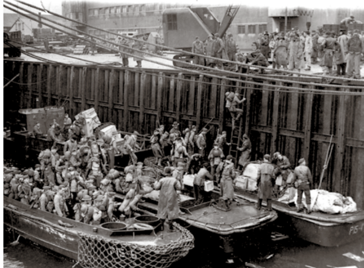
Á þessari mynd sést breskt herlið koma til Reykjavíkurhafnar árið 1940. Ekki er vitað hvenær íslenskir karlar byrjuðu að hitta þá leynilega en ljóst er að það hófst mjög fljótlega eftir að dátarnir komu.

fánaberi fyrir Ísland á Ólympíuleikunum, dæmdur fyrir samneyti við aðra karlmenn. Það er eina lög-regluskýrslan sem hefur fundist.