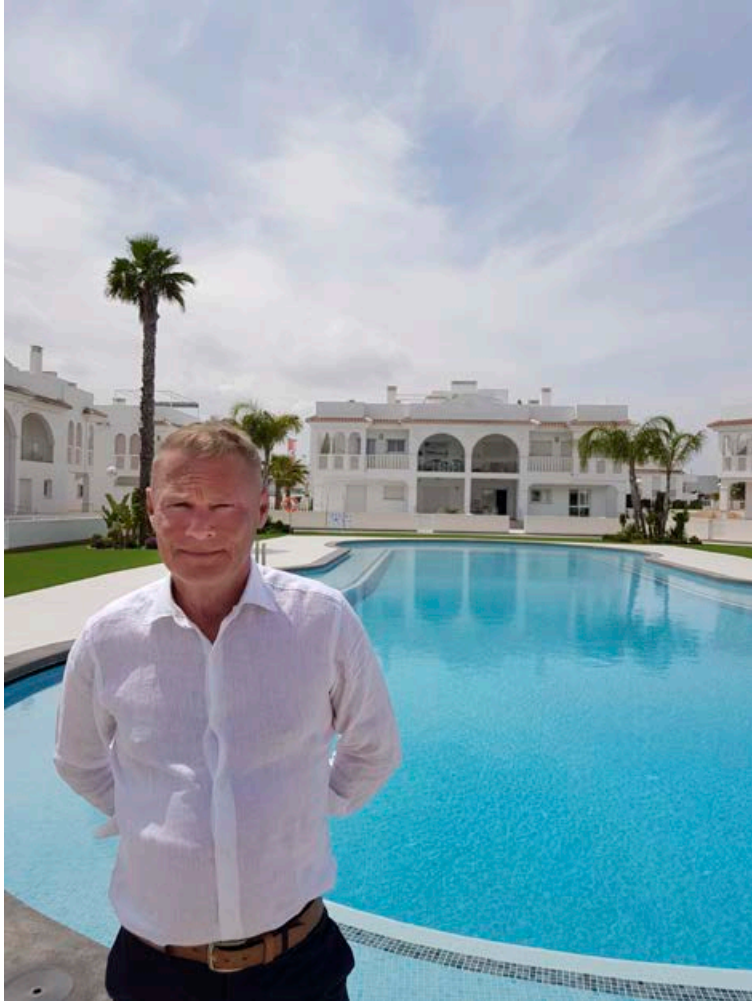
Hús Helgafells eru staðsett við stærstu sundlauginna af þremur, í Allegra-klanum, sem er í göngufjarlægð frá hinum heillandi miðbæ Quesada.

Quesada er heillandi bær með margt í boði fyrir ferðamenn.