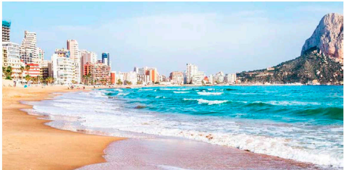
Hvíta ströndin, eða Costa Blanca, við Miðjarðarhafið heillar margan ferðalanginn enda eru baðstrendurnar þjóðarstolt Spánverja sem kappkosta að halda þeim ávallt hreinum og bjóðandi fyrir gesti.

Helgafell við Quesada er mjög miðsvæðis þegar kemur að því að ferðast inn í land eða niður að sjó. Umferðin á svæðinu er eitthvað sem Íslendingar mættu taka sér til fyrirmyndar. Hér er einfalt að rata, umferðin er létt og er auðvelt að keyra á milli staða. Á svæðinu er að finna fjóra til fimm 18 holu