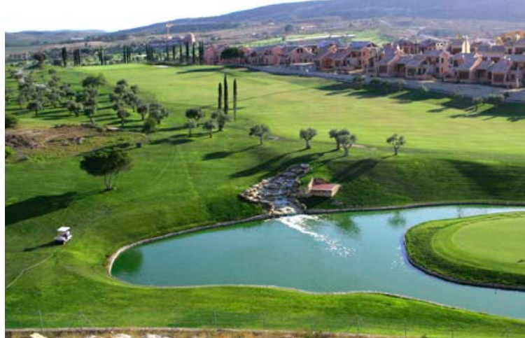
Valencia er golfparadís. Fimm átján holu golfvöllir eru á svæðinu og er á þeim boðið upp á frábæra afþreyingu fyrir byrjendur sem lengra komna.

golfvelli í hæsta gæðaflokki. „Vellirnir eru allir afar vel hannaðir og skemmtilegir og Íslendingar og Evrópúbúar streyma niður eftir á vellina til að spila golf í sumarblíðunni. La Marquesa er í Rojales í 5 mínútna akstri frá Helgafelli. La Finca er næstur í um 15 mínútna akstri frá okkur. Svo kemur Las Colinas um 20 mínútur frá okkur. Compamanor er svo í 20-25 mínútna akstri frá Helgafelli. Allir eru þeir útbúnir golfskálum og í kringum La Finca er einnig fjöldi veitingastaða.“