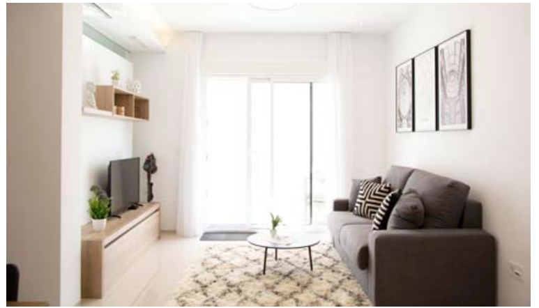
Íbúðir Helgafells eru allar rúmgóðar, fallega innréttaðar og vel útbúnar með eldunargræjum, fríu interneti og sjónvarpi. Þá er nóg af bílastæðum.

fossana í sömu ferð, en svæðið er að margra mati alger paradís á jörðu. Þá er tilvalið að koma með sundfötin og skella sér í vatnið.