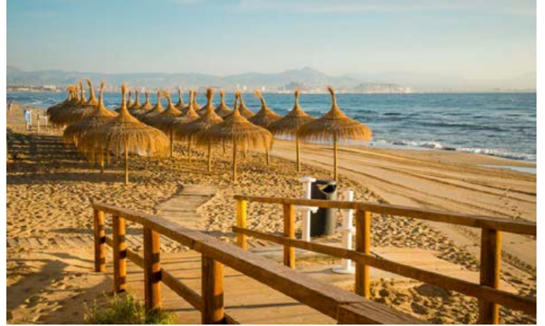
Strendurnar við Costa Blanca eru allt frá því að vera stórar ferðamanna-strendur með spennandi vatnasporti og kokteilstöðum yfir í að bjóða upp á ró og næði fyrir þá sem vilja slaka á og hlusta bara á sjávarniðinn.

Svæðið býður upp á fjölbreytta verslunarmöguleika fyrir þá sem