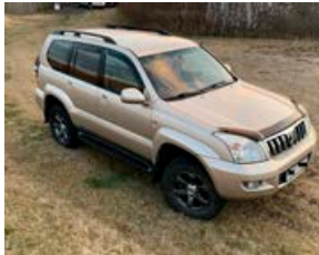
LANDCRUISER 120 GX ÁRG 2006

Þessi gullmoli til sölu, ek. 301þús. Sami eigandi síðustu 10 ár, gott viðhald, smurbók og ný grind. Verð 2.000.000 kr. Uppl. í s. 8585410