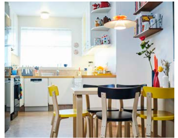
Borðkrókurinn er með stólum í stíl við innréttinguna. Þarna hafa eflaust mörg áhugaverð málefni verið rædd.