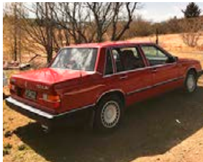
GULLMOLI- EKKINN AÐEINS 119 ÞÚS!

Þessi gullmoli til sölu, ek. 301þús. Sami eigandi síðustu 10 ár, gott viðhald, smurbók og ný grind. Verð 2.000.000 kr. Uppl. í s. 8585410