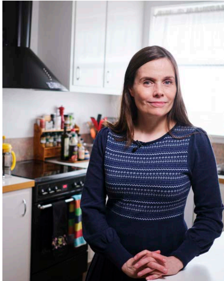
Katrín Jakobsdóttir á sér leyndarmál í eldhúsinu sem hún upplýsir um.