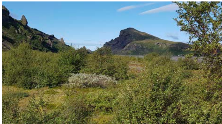
Þórsmörkin var eyðimörk en er í dag eitt af ástsælustu útivistarsvæðum landsins. Vistheimt hefur umbylt svæðinu í paradís.