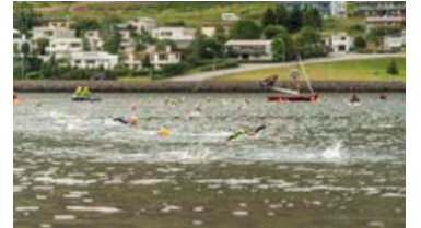
Dagskrá Hlaupahátíðarinnar hefur þróast í gegnum tíðina og núna er líka keppt í sjósundi.