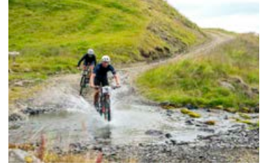
Margir hjólaþegar koma sérstaklega vestur til að taka þátt í hátíðinni, enda er hjólaleiðin einstök.