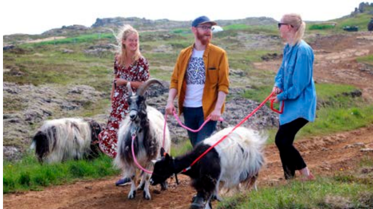
Geiturnar taka upp á ýmsu á labbinu, yfirleitt tengt því að borða, því þær sjá lítinn tilgang í að fara í göngutúr ef það er ekki til að finna eitthvað að borða.