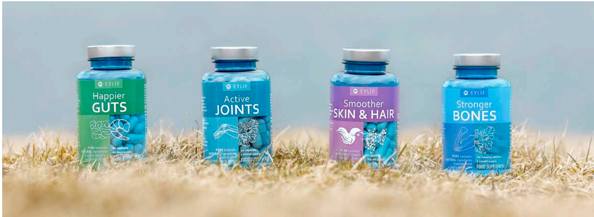
Bætiefnalínan frá Eylif samanstendur af Happier Guts, Active Joints, Stronger Bones og Smoother Skin & Hair.