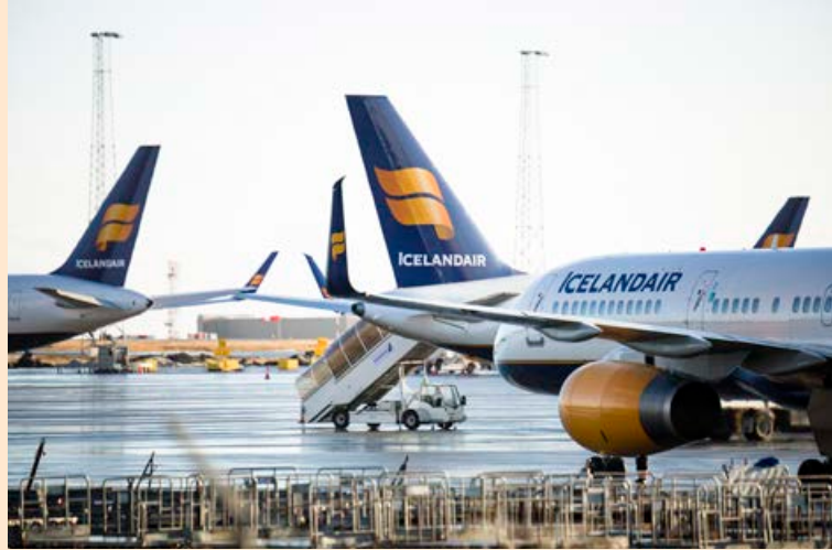
Reksturinn í vetur gæti orðið þungur, segir í verðmati.

„Væntanlega hefur farið um marga vegna tillagna sóttvarnalæknis um takmarkanir á komur ferðamanna ef ekki næst að skima