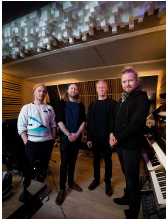
Strákarnir í stúdíóinu.