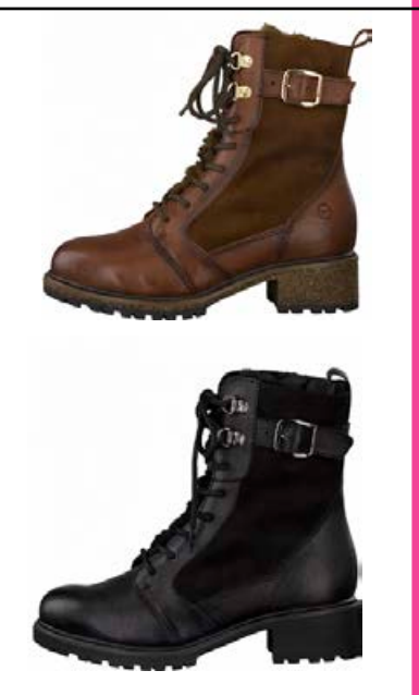
TAMARIS Loðfóðraðir kuldaskór Stærðir 37-42 Verð kr. 28.990