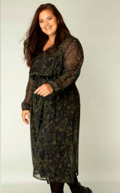
YEST/YESTA shiffonkjóll Stærðir 38-56 Verð kr. 12.980