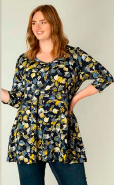
YESTA Ankaria tunika Stærðir 44-60 Verð kr. 10.980