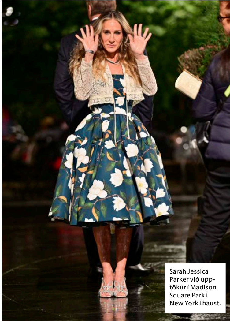
Sarah Jessica Parker við upp-tökur í Madison Square Park í New York í haust.

Persónan Bradshaw er óhrædd við að fara eigin leiðir í tískunni og er óhrædd við að taka áhættu. Hún hefur sést klæðast litríkum fötum á tókustað frá þekktum hönnuðum. En látum myndirnar tala sínu máli. ■