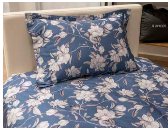
Blá rúmföt með myndum af magnolíu. Blómið er þekkt fyrir að hafa góð áhrif á svefninn.