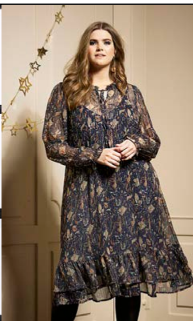
ZHENZI Pluma Shiffonkjóll Fæst líka í bleiku Stærðir 42-56 Verð kr. 12.990