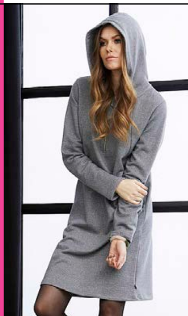
ZE-ZE Paya hettupeysukjóll með Lurex Stærðir 38-48 Verð kr. 12.990