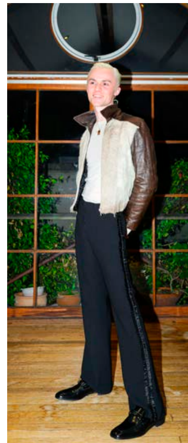
Vintage leðurjakki frá manni sem selur föt úti á götu í London, Maison Margiela toppur, vintage buxur úr göðgerðarverslun og Prada skór.