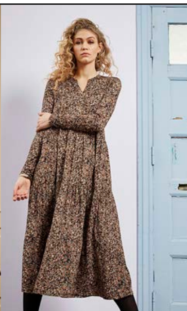
ZE-ZE Nati Síður pífukjóll með smágerðu blómamynstri Fæst líka í bláu - Stærðir 38-46 Verð kr. 8.990