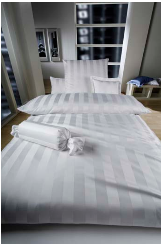
Hér sést skjannahvitt og stílhreint damask frá Curt Bauer.