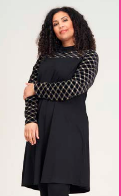
STUDIO Dina kjóll Stærðir 40-56 Verð kr. 12.980