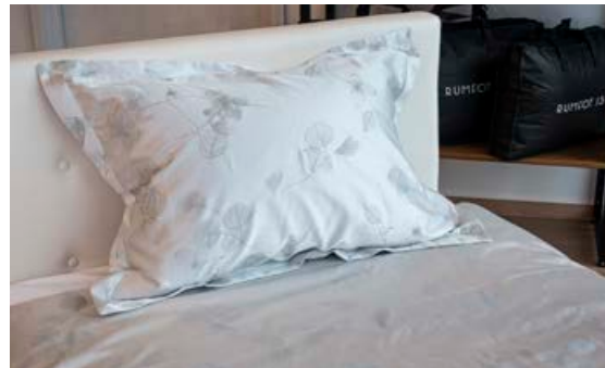
Ítalskt hágæða silkidamask saumað á Íslandi