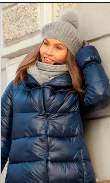
LASESSOR Signa húfa Fæst í fleiri litum Verð kr. 6.990