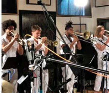
Hljómsveitin Brass Against.