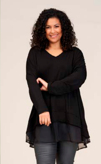
STUDIO Hedvig kjóll Stærðir 40-56 Verð kr. 14.980