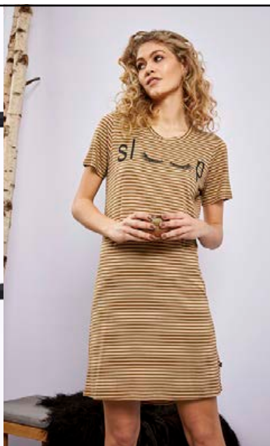
ZE-ZE náttkjóll Fæst líka í bleiku og bláu Stærðir 38-48 Verð kr. 5.990