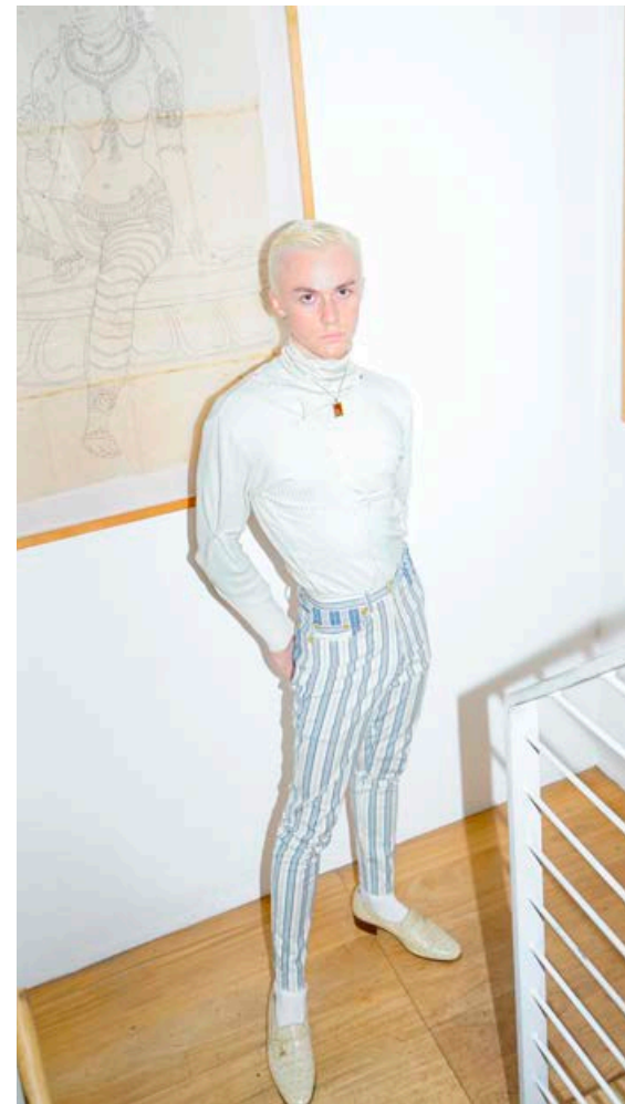
Vintage toppur sem hann saumaði sjálfur, vintage Moschino buxur, antik skór og Viðja jewelry hálsmen.

Í augnablikinu er ég mikið að vinna með brúna og ljósa liti. Ég er hægt og rólega að safna í litríkan fataskáp.