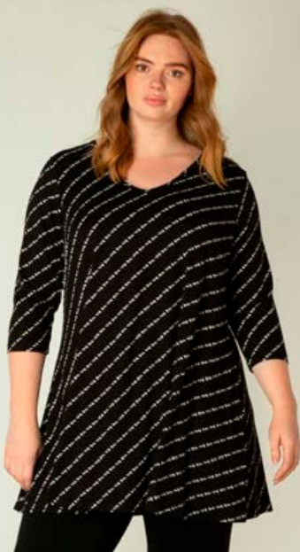
YESTA Ankaria essential tunika Stærðir 44-60 Verð kr. 10.980