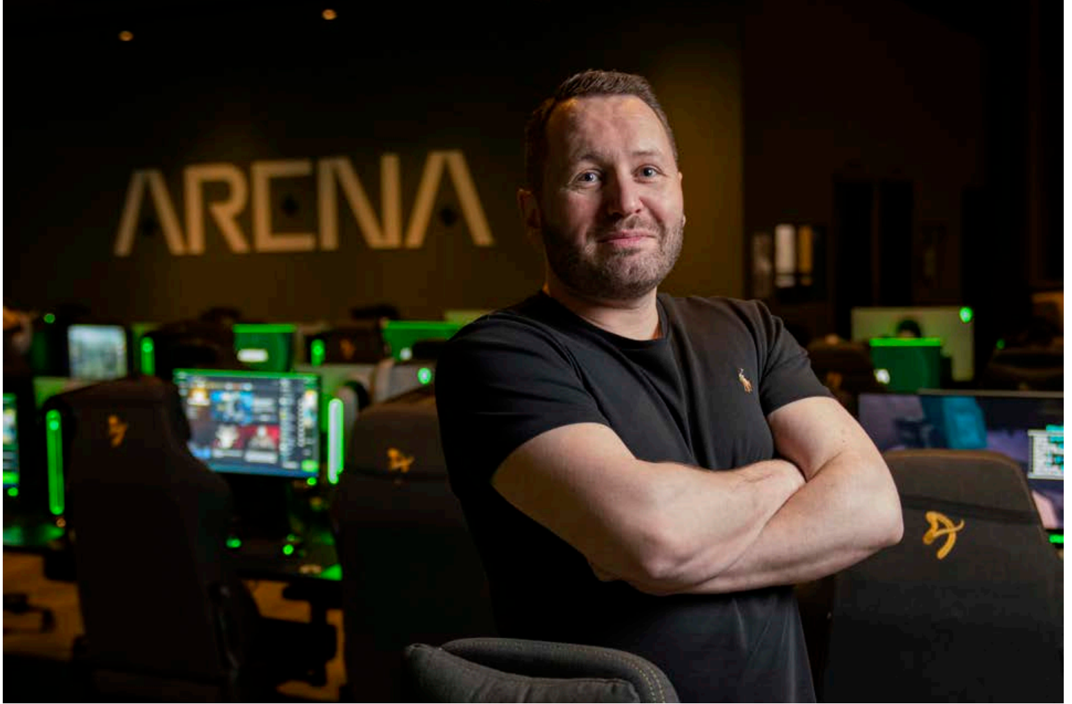
Arena er nú opið í fyrsta sinn án allra samkomutakmarkana og það er mikil ánægja með aðstöðuna og veitingastaðinn, Bytes.

Það er líka stór skjár á veitingastaðnum þar sem allir helstu fótboldaleikirnir og aðrir vinsælir íþróttaviðburðir eru sýndir og það eru alltaf tilboð og „happy-hour“ milli klukkan 16 og 19 í tengslum við leiki. Arena er svo sjálft með setustofu þar sem má finna annan risaskjá, sófa og sæti og þar getur fólk horft á leikjámót og aðra rafíþróttaviðburði.“