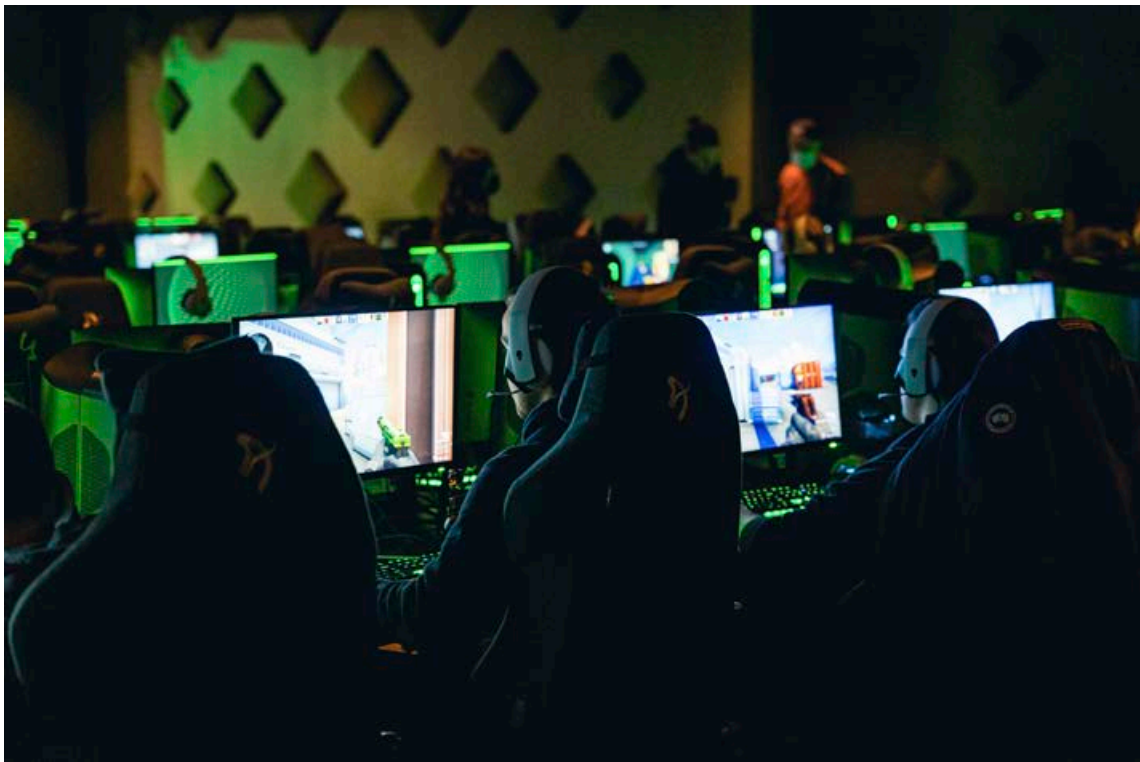
Fólk getur valið milli þess að spila inni í sal eða í einkaherbergjum og það er bæði hægt að spila á PC og PlayStation 5.