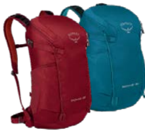
Skimmer 20L ♀ Skarab 22L ♂

Frábær fyrir skólann, í vinnuna eða hvenær sem er