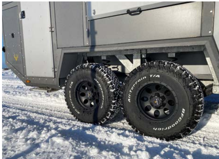
Hjólhýsið er hannað fyrir íslenskar aðstæður og það kemur á grófum BF Goodrich 33" dekkjum, fjórum dempurum og gormum.