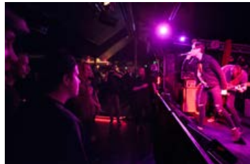
Í kvöld verður sannkallað parti á Gauknum.