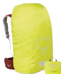
Regnplast í ýmsum stærðum