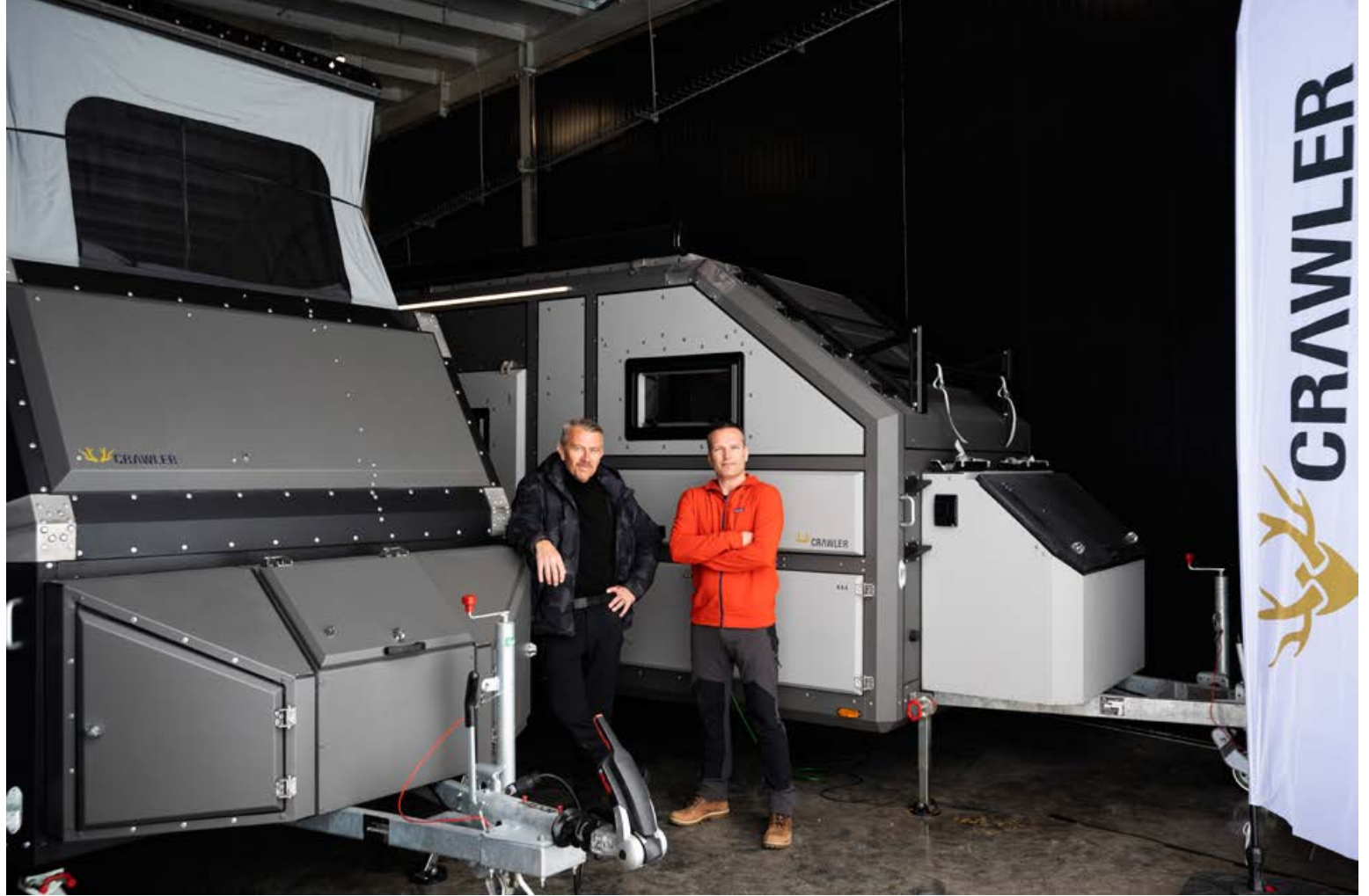
Hjólhýsin eru gerð úr áli og eru því létt og hafa öll þau þægindi sem ferðalangar þurfa á ferðalögum sínum á fáförnum slóðum.