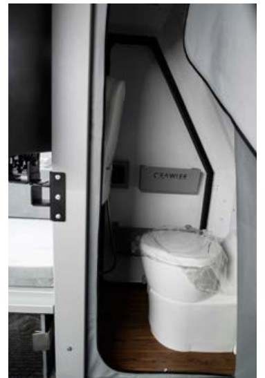
Væri ekki notalegt að hafa salerni með sér í fjallaleiðangurinn?