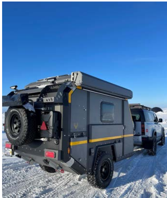
Hjólhýsin henta vel í hvers kyns ferðalög um landið, hvort sem er á fáförnum vegum eða slóðum.

Crawler hýsin verða til sýnis í sýningarsal Tarandus ehf. um helgina (laugardag og sunnudag) á opnu húsi frá klukkan 13-16, að Dofrahellu 3, 221 Hafnarfirði.