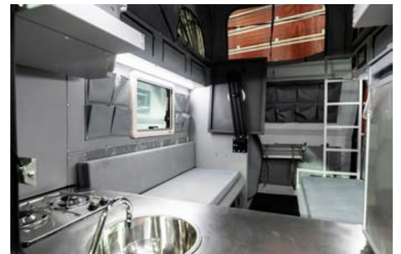
Hýsin eru vönduð og vel búin. Eldhús með eldunaraðstöðu, ísskápur og vaskur með heitu og köldu vatni. Þægilegt rúm, gott skápláss og salerni.