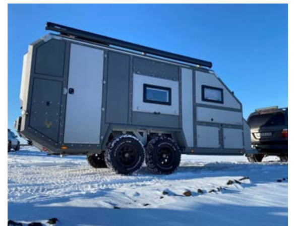
Crawler hjólhýsið litur vel út enda vandað til allrar gerðar.