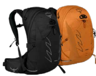
Talon 22L ♂ Tempest 20L ♀

Bakpoki sem hentar vel sem dagpoki, vandaður og þægilegur