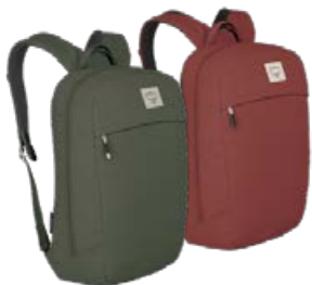
Arcane Large Day