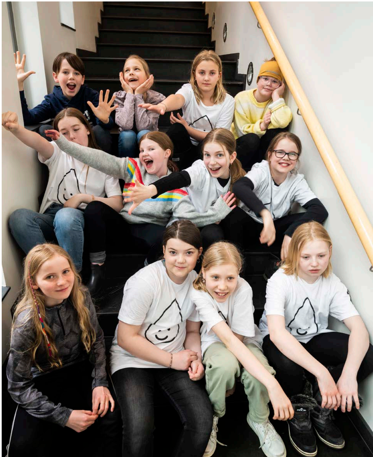
Krakkarnir sem taka þátt í listahátíðinni Vatnsdropanum í Kópavogi hlakka mikið til að sýna gestum og gangandi afrakstur sinn.