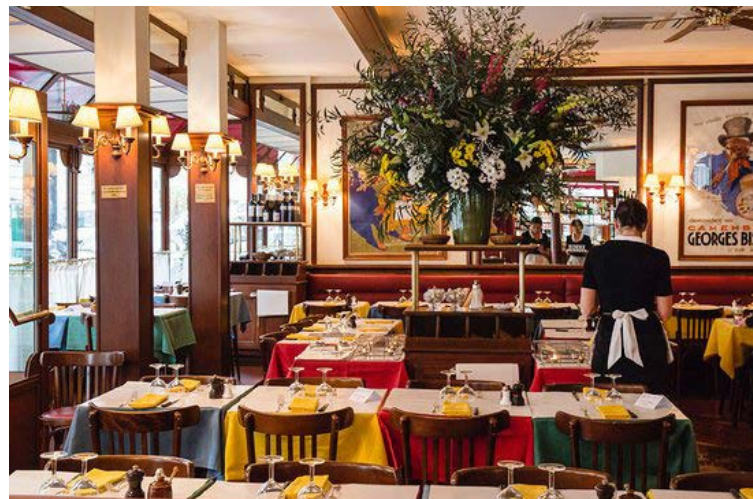
Á stöðunum er ekki hægt að panta borð og þeir eru alltaf þéttsetnir.

Staðirnir eru þrír í París og staðurinn þar sem flóra viðskiptavinanna þykir einstaklega litrík er í Rue Marboeuf, 8. hverfi borgarinnar. Áttunda hverfi þykir með glæsilegri hverfum Parísar og hefur að geyma hinn fræga Sigurboga. Má þar finna allt frá vel