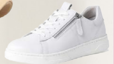
TAMARIS götuskór Stærðir 37-42 Verð kr. 24.990