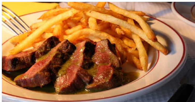
Hin klassiska franska steik með grænni sósu og frönskum gleður marga.

Láttu æðruleysið ráða för og biðdu eftir að ein af þaulreyndu og glaðlyndu þjónustustúlkunum, sem eru snarar í snúningum, vísi þér til borðs.