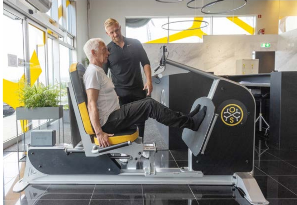
Æfingarnar taka skjótan tíma en gefa mikinn árangur.

„Það er víst einkenni frumkvöðla að hafa brennandi áhuga á því að byrja á einhverju en missa svo áhugann þegar allt er farið að virka. Ég tengi við það og er snöggur að breyta til þegar mér