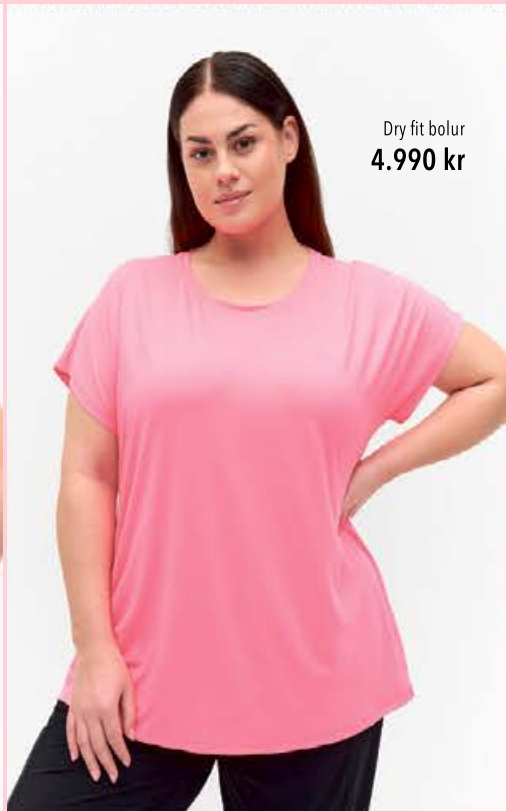
Dry fit bolur 4.990 kr