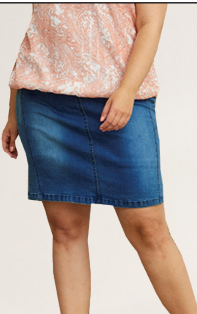
ZHENZI gallapils með buxum undir Fæst líka í dökkbláu Stærðir 42-56 Verð 8.990