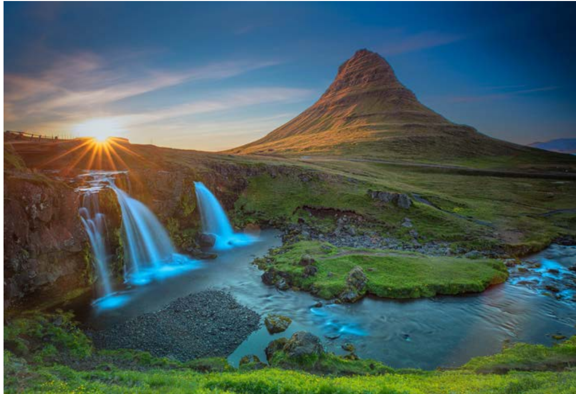
Ótrúlega fallegt sjónarhorn á Kirkjufelli með fossana í forgrunni.

HDR er þó gagnrýnt fyrir að gera myndir óraunverulegar og hefur orðsporið verið á undanhaldi eftir mikla frægðarför. Ljósmyndarar sem vilja sjálfir hafa öll tók á myndefninu stilla því myndavélinni á þrífót og taka nokkrar myndir í beit. Undirlýstar myndir fyrir björtustu hluta myndarinnar s.s. himininn og vatn. Yfirlýstar myndir fanga skuggasvæðin, t.d. brekkuna við fossinn og aðrar myndir fyrir allt þar á milli. Flestar myndavélar leyfa ljósmyndararum að stilla ljósnæmi og fjölda fyrir sjálfvirkar tókur í beit. Mælt er með fjarstýringu til að koma í veg fyrir hreyfingu. Flestir stilla þrífæti í augnhæð enda þægilegast. Með því að stilla þrífæti í lægstu stöðu má ná mjög skemmtilegum