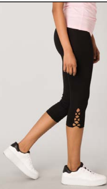
YEsT/YESTA leggings Stærðir 36-52 Verð 4.980 kr