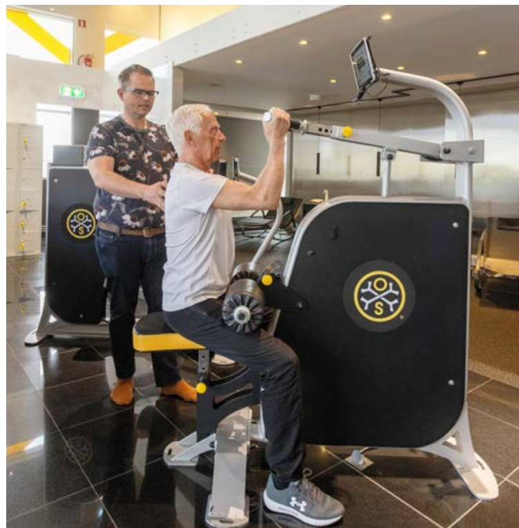
Þjálfarar leiðbeina fólki og passa upp á að æfingarnar séu rétt gerðar.