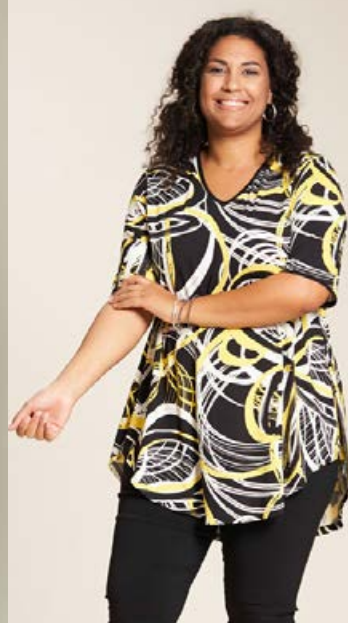
STUDIO Tunika Stærðir 38-56 Verð 10.980 kr.