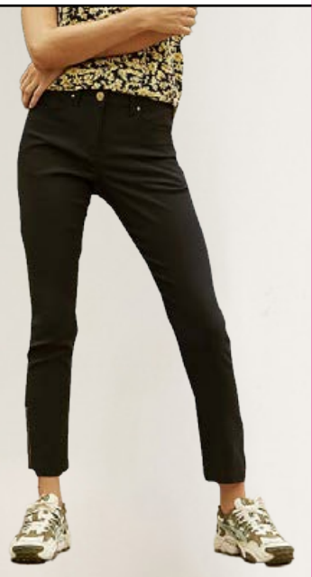
ZE-ZE sanne buxur með rennilás á ökkla Fæst í fleiri litum - Stærðir 36-48 Verð 9.990 kr