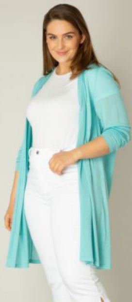
YESTA létt sumar peysa Fæst líka í limegrænu og kremhvítu Stærðir 44-54 Verð 12.980