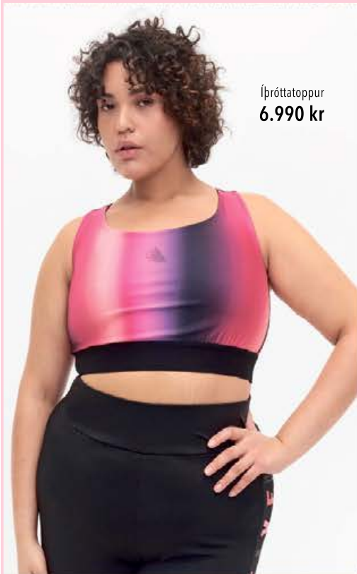
Íþróttatoppur 6.990 kr