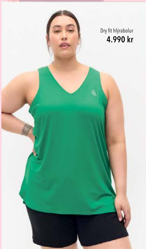
Dry fit hlýrabolur 4.990 kr