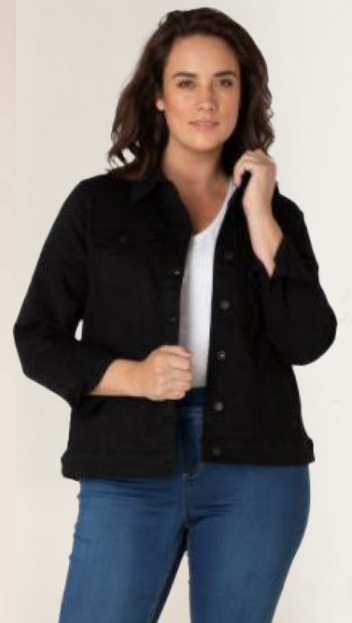
YESTA gallajakki Fæst í fleiri litum Stærðir 44-60 Verð 14.980