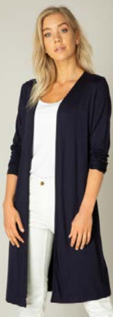
ES&SY Peysa Stærðir 38-46 Verð 5.980 kr