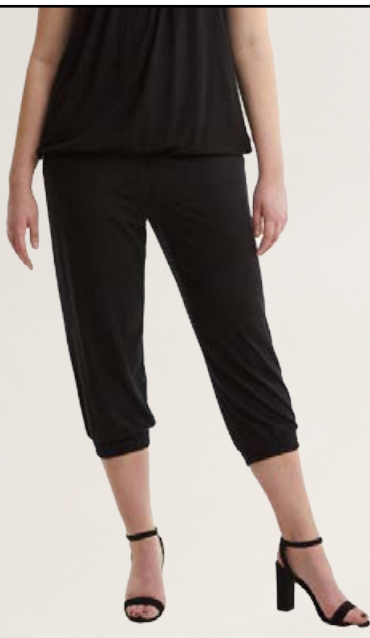
Zhenzi kósýbuxur Stærðir 42-58 Verð 6.990 kr