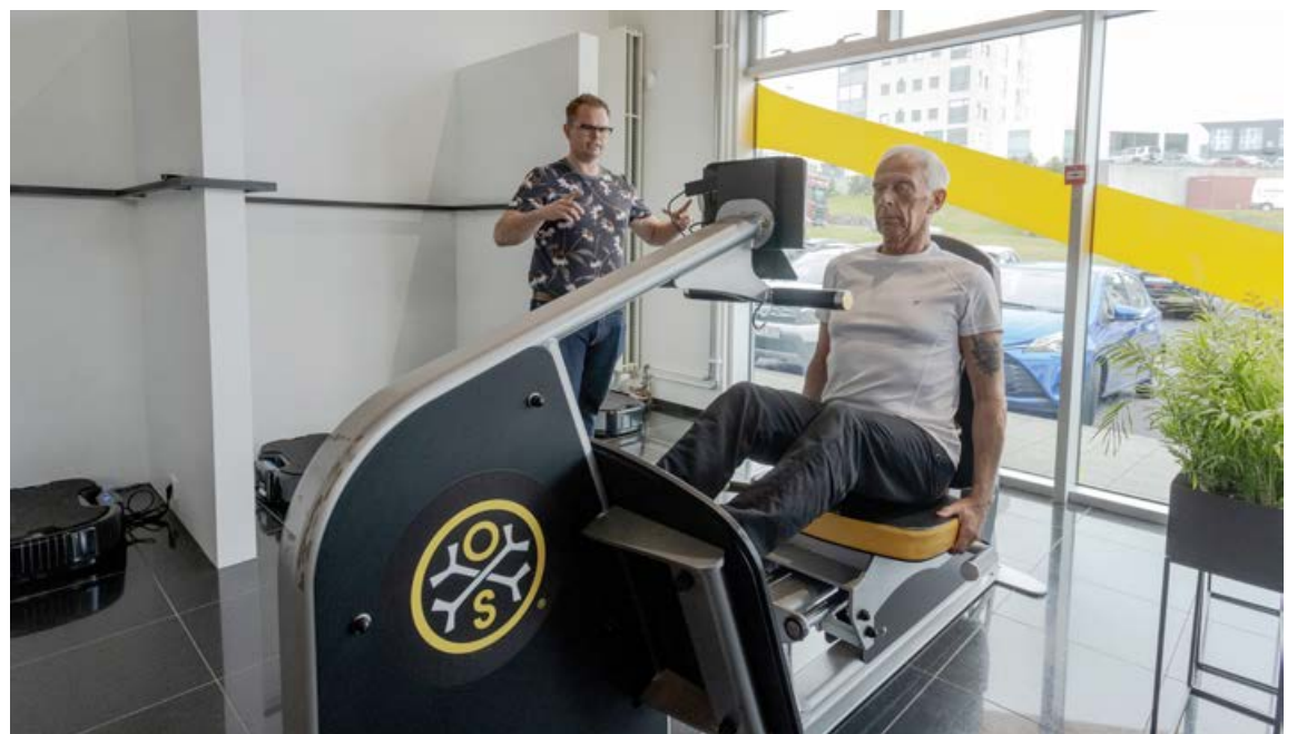
Með OsteoStrong ástundun bætir fólk styrk sinn og þol. Æfingarnar taka einungis 20 mínútur í hvert skipti.