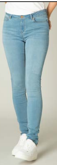
YEST/YESTA Joy gallabuxur Fást í fleiri litum Stærðir 36-60 Verð 10.980