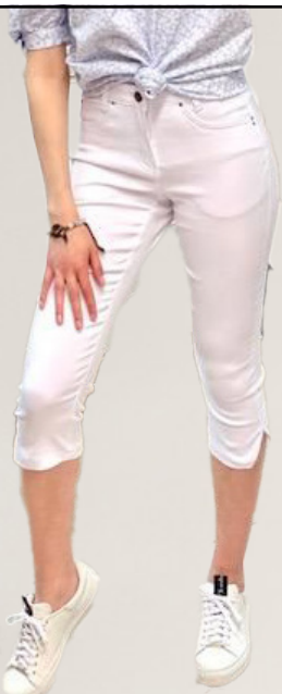
ZE-ZE sanne hnébuxur Fást í fleiri litum Stærðir 38-48 Verð 7.980 kr