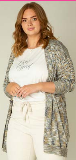
YEST/YESTA létt sumarpeysa Stærðir 40-56 Verð 12.980