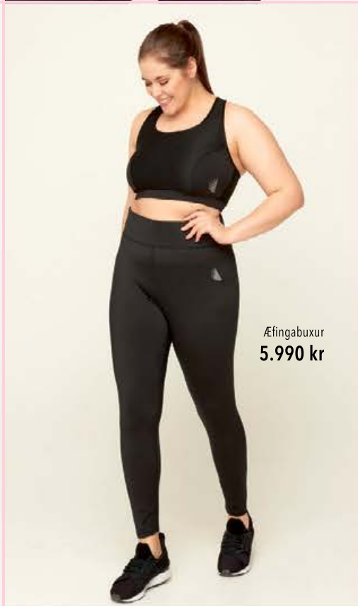
Æfingabuxur 5.990 kr