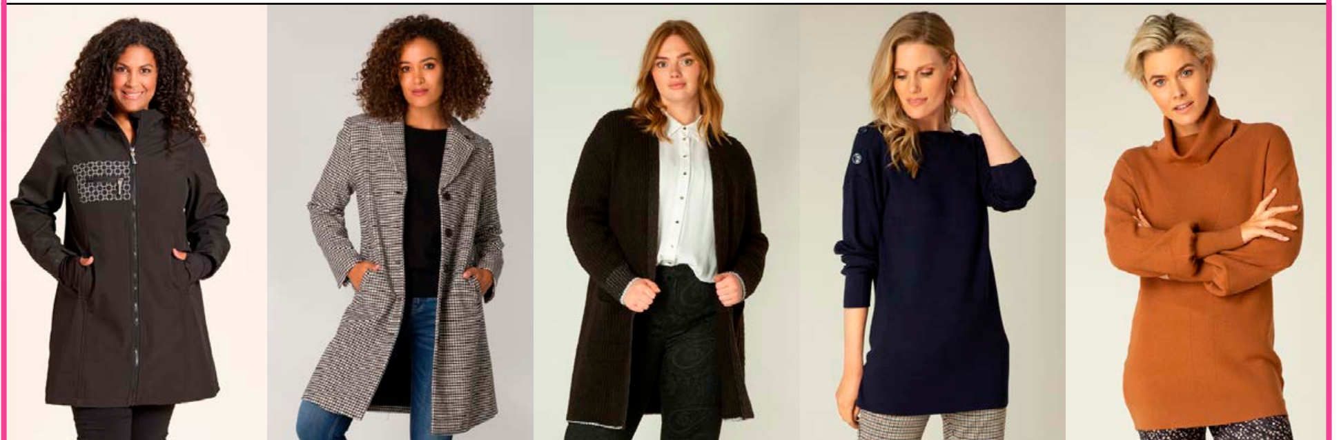
STUDIO Lotte softshell jakki Stærðir 38-56 Verð 23.980 kr