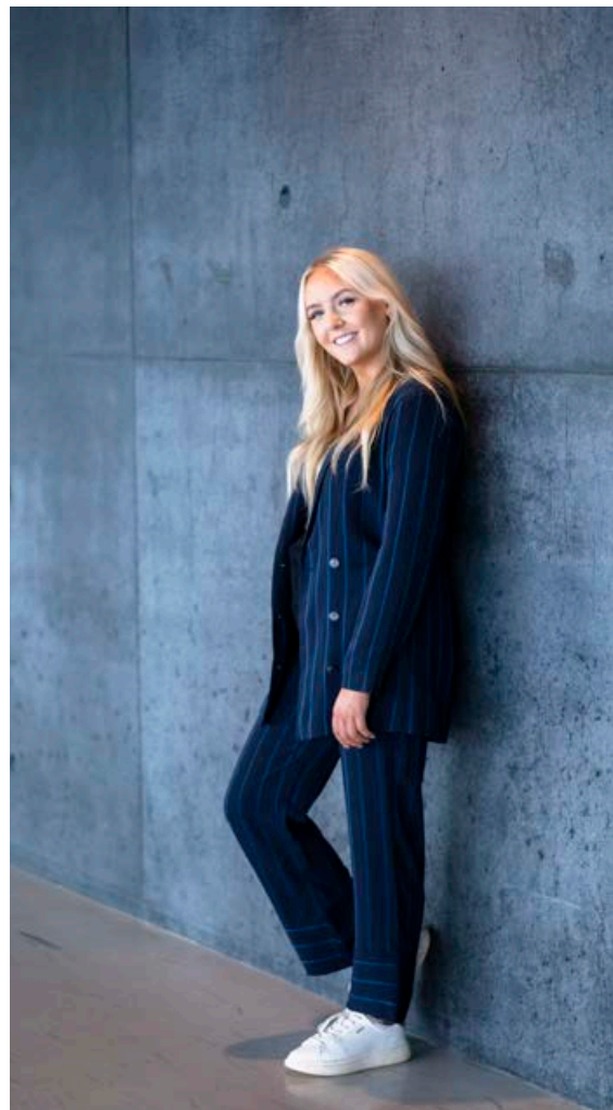
Hér er stíllinn hennar Andreu í hnotskurn, skyrta, buxur og skór frá Boss, sem lýsir vel því sem koma skal í haust. Svarti liturinn kemur sterkur inn aftur, stílhreinar flikur sem gefa afslappað yfirbragð og undirstrika þægindin.