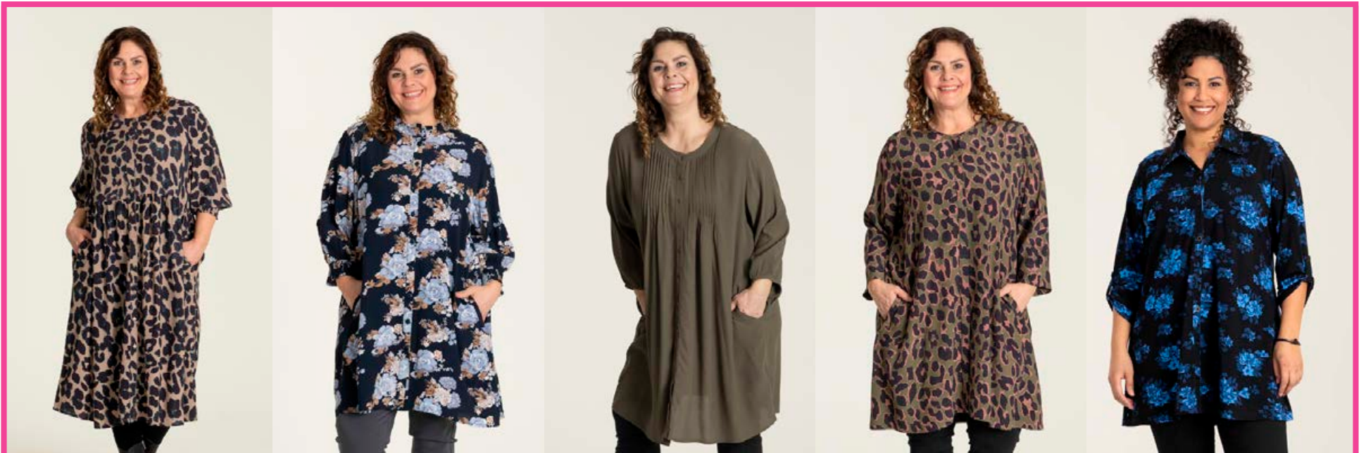
GOZZIP Kia kjóll Stærðir 38-56 Verð 20.980 kr