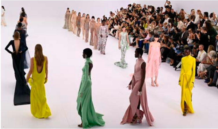
Fendi sýnir hér mikla litagleði fyrir haust og vetur 2022-2023 á sýningarpallinum í París fyrr í sumar.