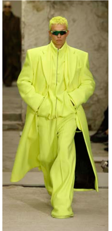
Vetements var einnig með puttann á púlsinum í sumar fyrir haust- og vetrartískuna.

” Stjörnulitirnir í haust og vetur verða svo sannarlega ekkert í átt við navy bláan og drapplitaðan.