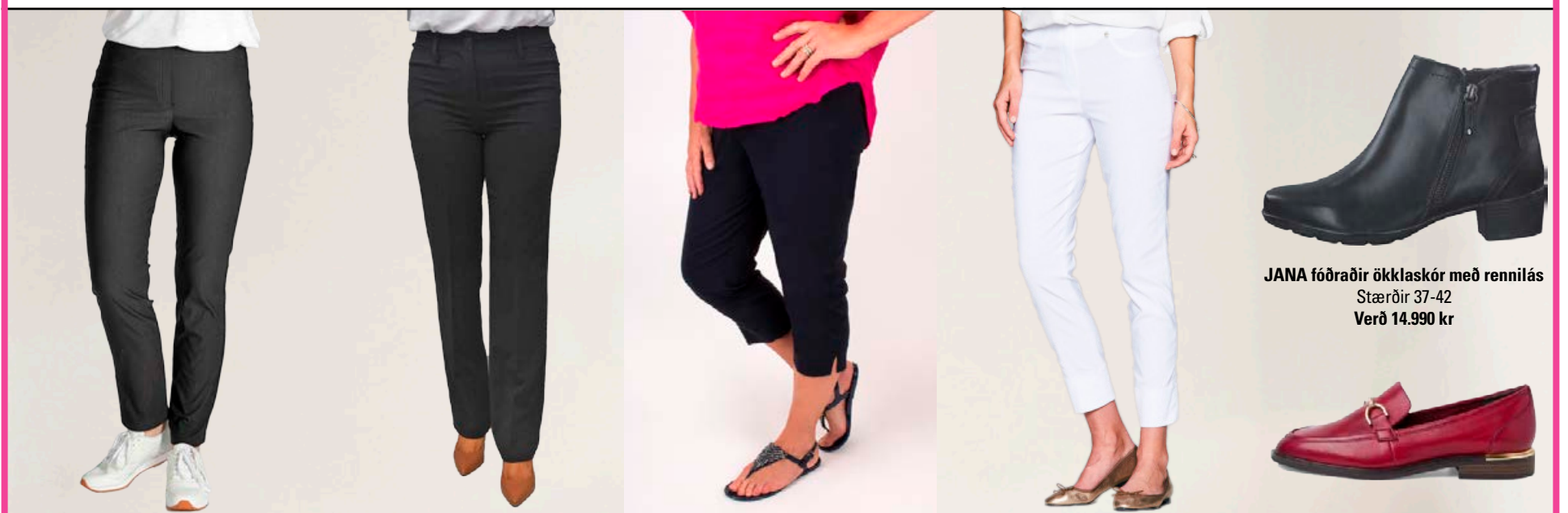
ROBELL Bella Thermo vetrarbuxur Fást líka í navybláu Stærðir 38-52 Verð 11.980 kr