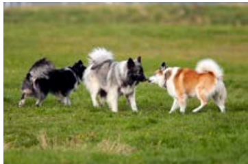
Hundar og menn taka sprettinn á Nesinu.