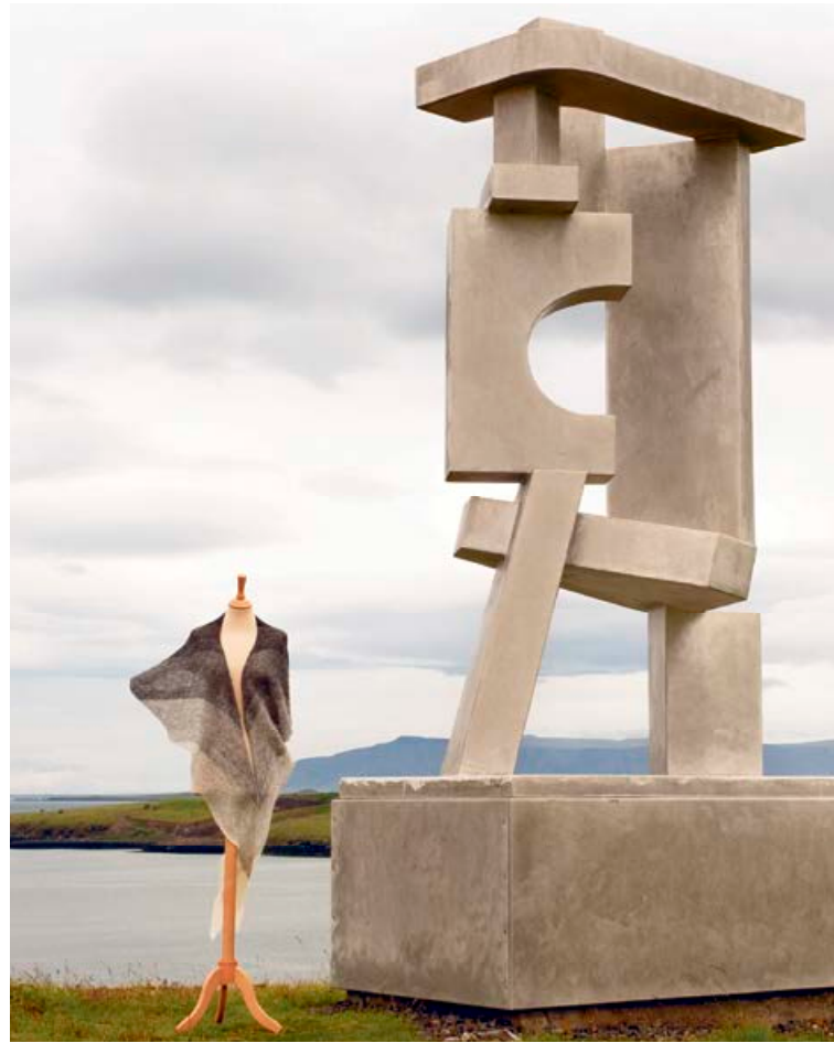
Ásynja heitir þetta sjál en Snorri Sturluson segir í Eddu sinni að ásynjur séu jafn heilagrar og mikils ráðandi og æsir.

Þetta sjál heitir Seiður en í gömlum kvæðum segir að gyðjum hafi í upphafi verið kenndur seiðurinn.