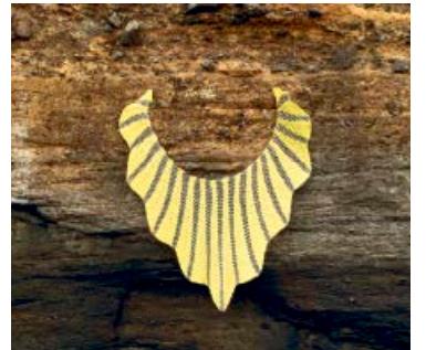
Nótt og nift er nafnið á þessu sjali. Nift þýðir afkomendur og þá sérstaklega kvenkynið. Út frá þessu sjali fæddist ættbálkurinn Sjalaseiður.

hélt í fyrstu, en með aðstoð góðra kvenna tókst að leggja lokahönd á þá hugmynd nýverið.“