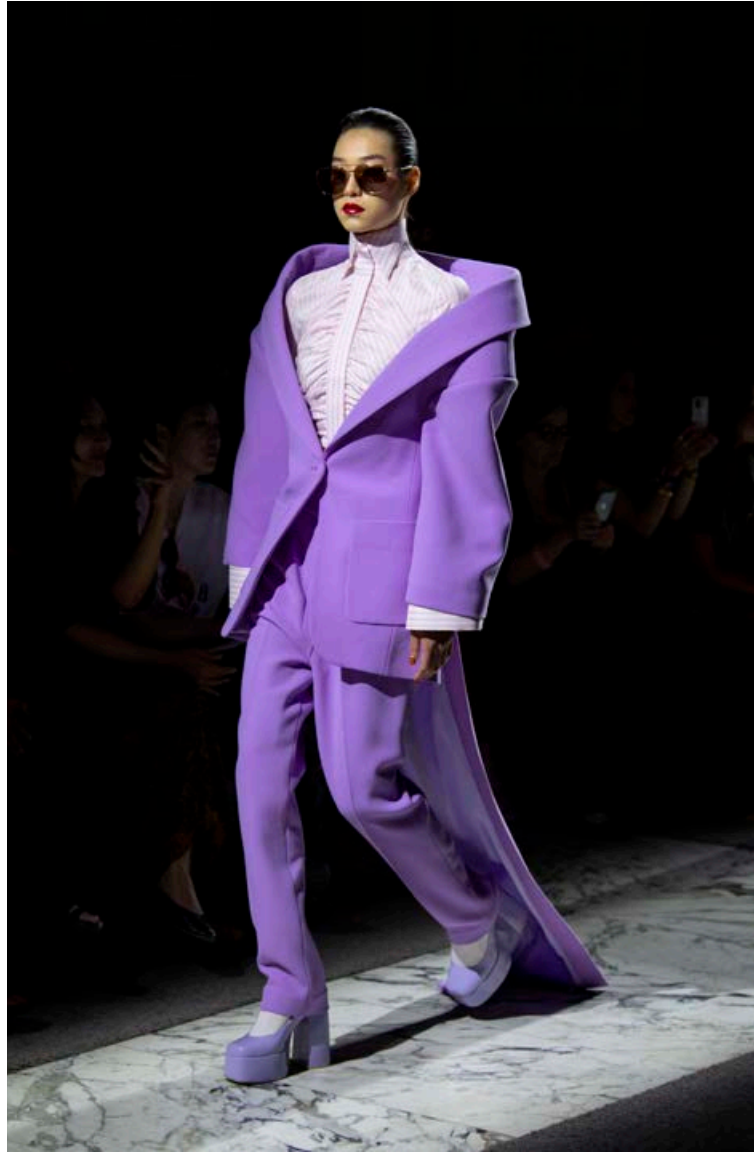
Viktor & Rolf var með nokkrar litaútgáfur af þessari gegguðu dragt í París í sumar. Þessi fjólublái tónn mun verða heitur í haust.

Það er því kannski óþarfi að koma öllum sumarflíkunum fyrir í geymslu strax, heldur má endilega nýta litríka sumardressið út haustið og vel fram á vetur. Ermastutta kjóla er til dæmis hægt að para með rúllukragabolum og bykkum sokkabuxum og ermastuttar skyrtur má nota undir hlýjar peysur með vaffhálsmáli. ■