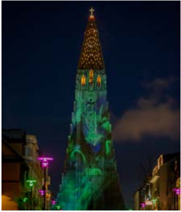
Litfögur Hallgrímskirkja á síðustu Vetrahátíð.