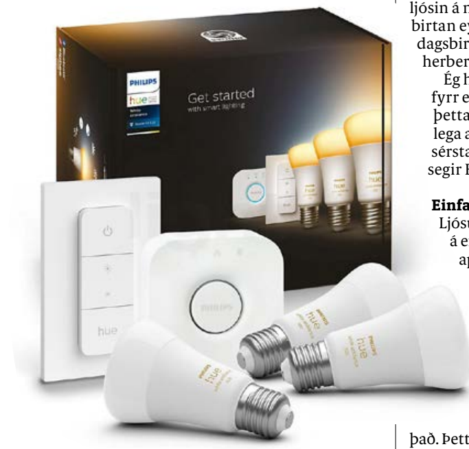
Í september er tilbod á startpakka frá Philips Hue.