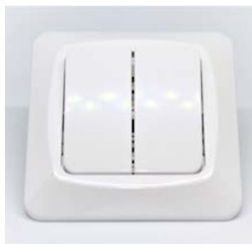
Slökkvarar af ýmsum gerðum eru fánlegir hjá Lukson.