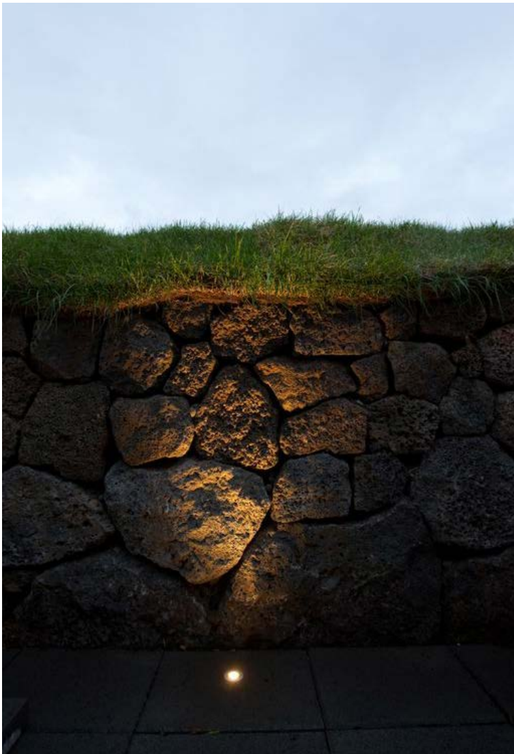
Oft á „less is more“ við í útlýsingu. Við viljum fá samspil ljóss og skugga.