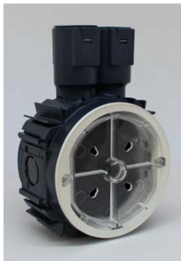
Rofadós fyrir rafmagn.