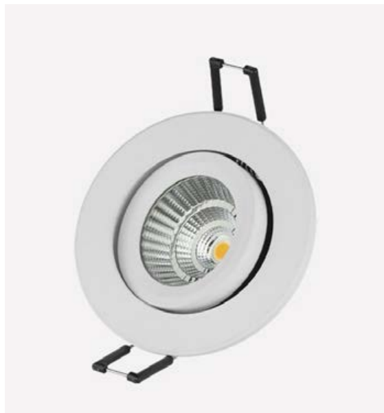
Innfellð ljós eru nett og þægileg.