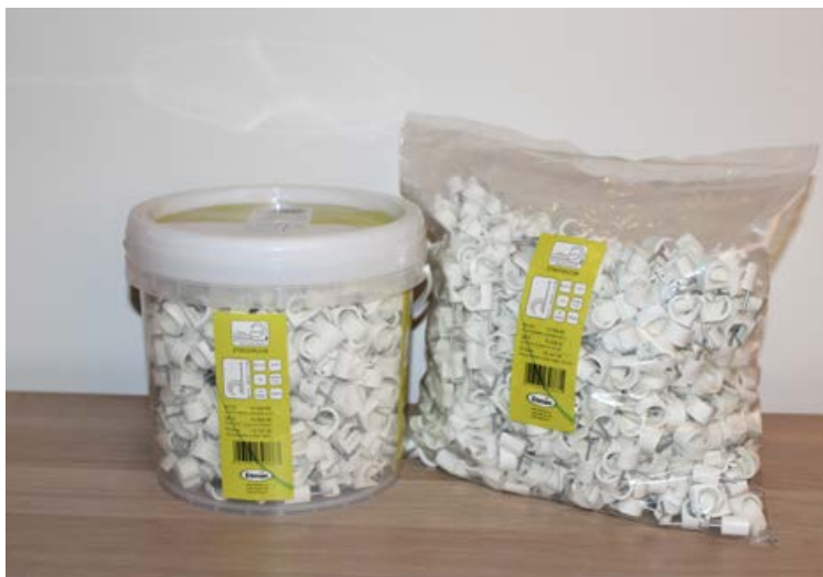
Mikið úrval af alls kyns raflagnaefni meðal annars kapalspenna.