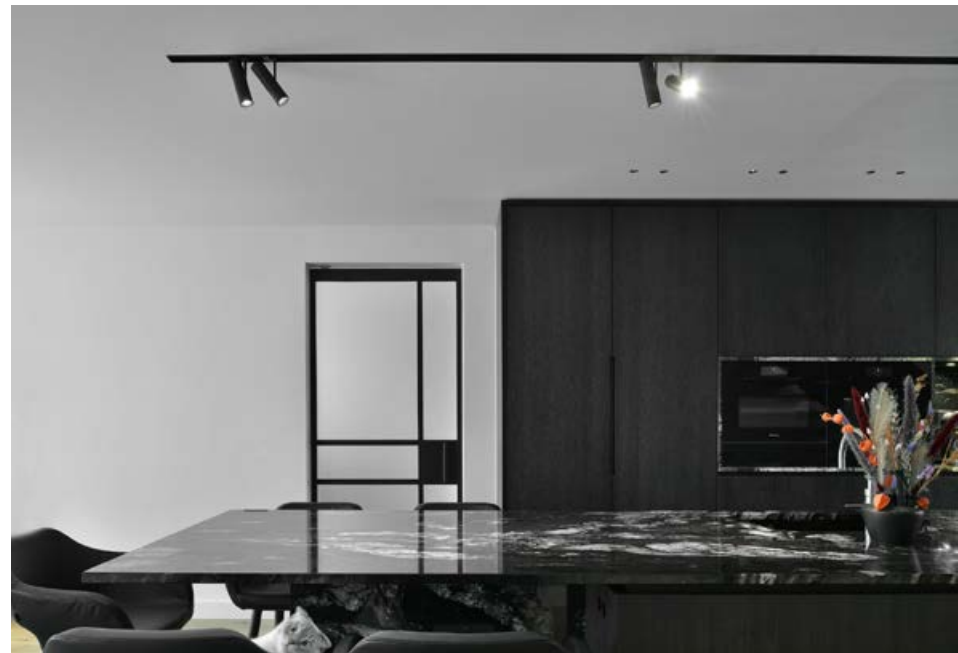
Svart er mjög í tisku um þessar mundir.

S. Guðjónsson er rötgróid fyrir-tæki sem hefur frá árinu 1967 flutt inn lýsingarbúnað og síðar raflagnaefni. Fyrirtækið þjónar breiðum hópi viðskiptavina, þar helst rafverktökum og rafvirkjum, rafhönnuðum, arkitektum og hönnuðum en einnig eru ýmis fyrirtæki í hópi viðskiptavina sem og einstaklingar. Í dag er fyrirtækið hluti af Fagkaupum ehf. sem er samsteypa níu rekstrareininga, sem allar starfa að mestu leyti á fagaðilamarkaði.