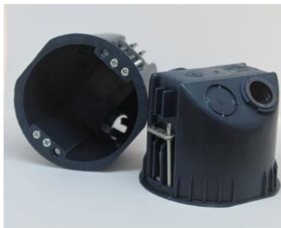
Rofadós en Lukson er með samning við verksmiðjuna.