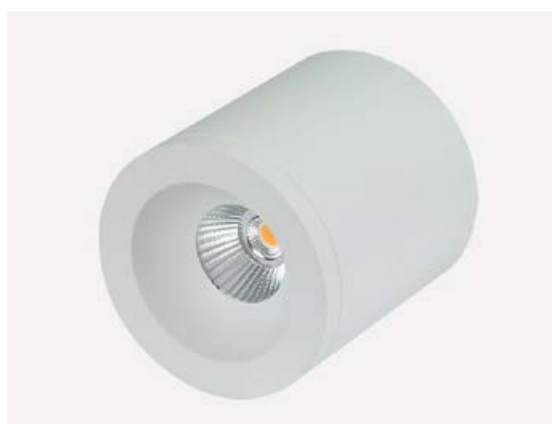
Öll ljós eru dimmanleg.

Hleðslustöðvarnar geta lesið hvað heimilið hefur mikið rafmagn afgang og er hægt að stilla þær miðað við hvað þær mega taka mikið rafmagn.