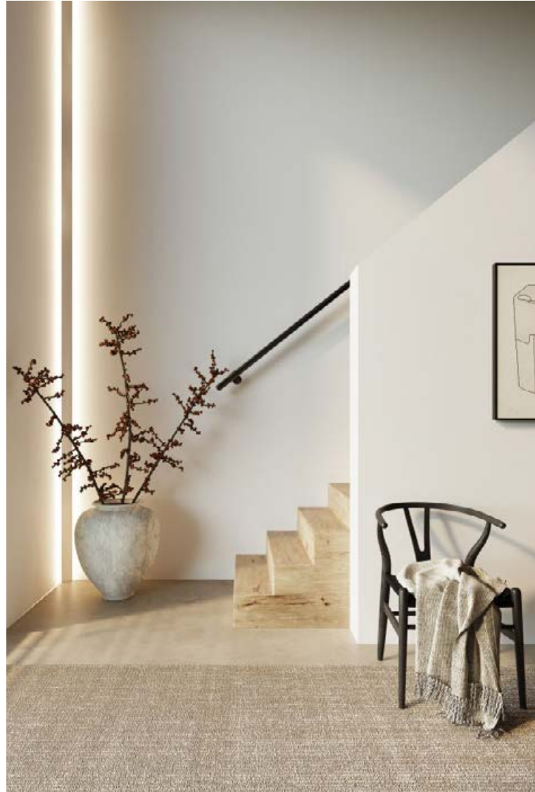
Falleg óbein lýsing með sérstökum hornprófil. MYNDIR/ÞSENDAR