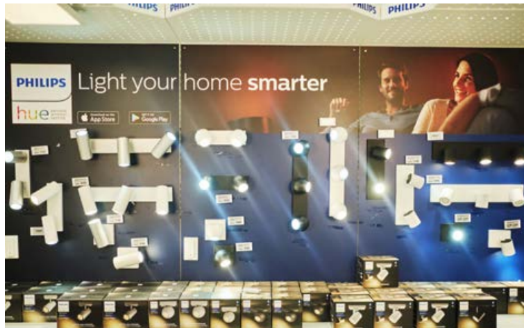
Í stærri verslunum Húsasmiðjunnar eru ljósin uppsett og hægt að sjá með eigin augum hvernig þau virka.

„Þá er hægt að stilla það þannig að það gerist ekki alltaf á sama tíma, kannski kvikna þau eina nóttina klukkan þrjú og næstu korter yfir þrjú. Ef einhver er að fylgjast með húsinu þínu þá grunar hann síður að enginn sé heima ef ljósin kvikna á mismunandi tímum. Ef þú hefur séð Home Alone þá veistu að þú þarft að