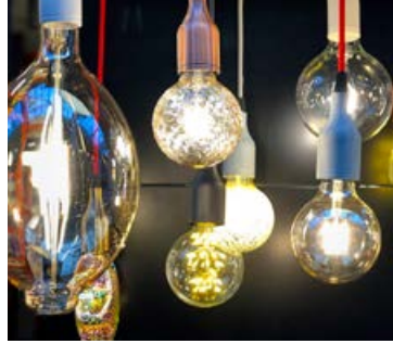
Perur hafa mismunandi orkunotkun.

Ljós með glóperum á alltaf að slökkva þegar ekki í notkun. Glóperur eru óhagkvæmasti ljósgjafinn og nýta orkuna verst af þeim ljósgjöfum sem eru í boði. Best er