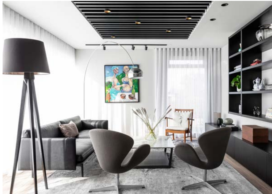
Stofan er oft mest notaða rými heimilisins og gegnir margþættu hlutverki og gerir fjölbreyttar kröfur til mismunandi lýsingar.