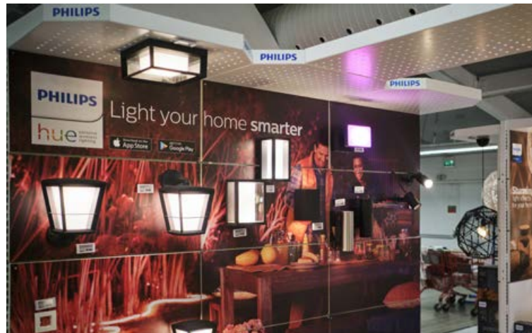
Hægt er að kaupa bæði inni- og útiljós, perur og ljóskastara, lampa og loftljós af öllum stærðum og gerðum í snjallljósalínu Philips Hue.