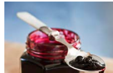
Það er einfaldara en margir halda að útbúa sultu.

Það er frekar einfalt verk að útbúa bláberjasultu sem er auðvitað ljómandi góð með pönnukökum, vöfflum eða ofan á ost á ristaðri brauðsneið, svo að dæmi séu nefnd. Sultur eru líka bráðsniðugar tækifærisgjafir og auðvelt er að búa fallega um krukuna með textílút og teygju.