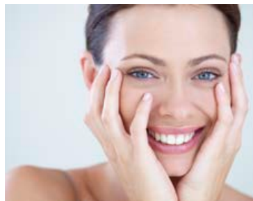
Sumir verja jarðvistinni með útlits- legt forskot.

Þó hafa sérfræðingar í mann- legri hegðun tint saman sex atriði sem virðist einkenna daglega upp- lifun óvenjulega aðlaðandi fólks.