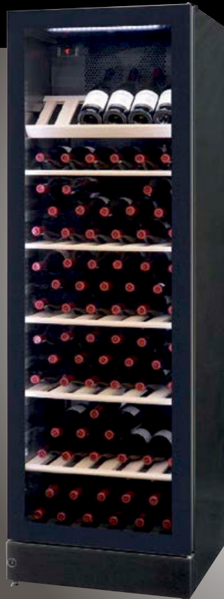
WFG 185 - St. (hxbxd) 1850x595 x596 mm (+2 - +10°C)