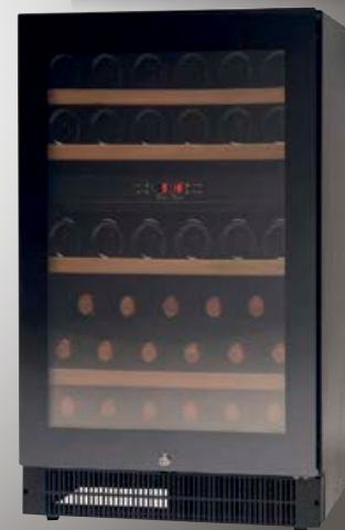
WFG 45 - Stærð (hxbxd) 820 x595 x573 (+5 - +10/+10 - +18°C)