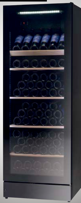
WFG 155 - St. (hxbxd) 1550 x 595 x610 (+5 - +22°C)