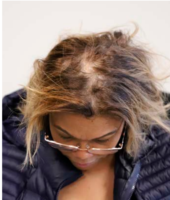
Svona var hárið á Naný þegar hún fór í prófanahópinn.

Nourkrin virkar vel gegn hárlasi Rannsóknir sýna að Nourkrin bætiefnið vinnur gegn hárlasi og stuðlar að eðlilegum hárvaxtarhring. Hárlas getur haft ýmsar orsakir en Nourkrin nærir hársökkina svo þeir geti viðhaldið eðlilegum hárvaxtarhring.