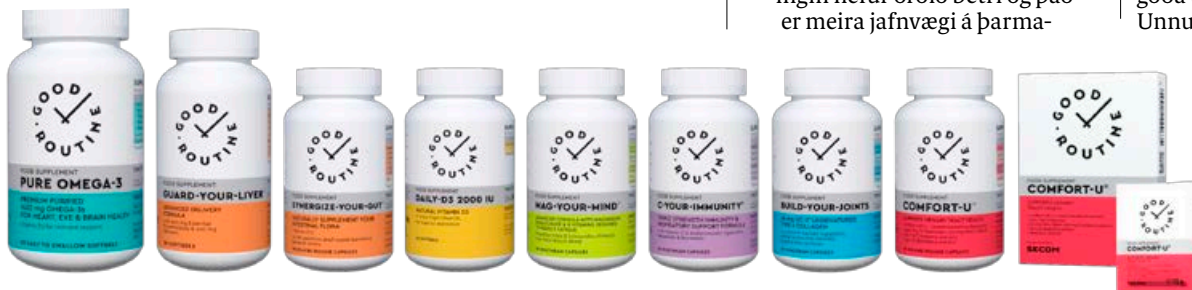
Good routine framleiðir gæða fæðubótarefni með náttúrulegum innihaldsefnum.

Good Routine fæst í Hagkaup, Lyfjum & heilsu, Apótekarum Krónunni, Fjarðarkaupum og á www.goodroutine.is