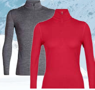
Oasis hálfrennd 15.990 kr.