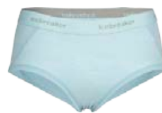
Sprite Hot Pants Nærbuxur 6.990 kr.