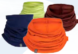
Flexi Chute hlýir hálskragar 4.990 kr.