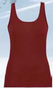
Siren Tank hlýrabolur 8.390 kr.