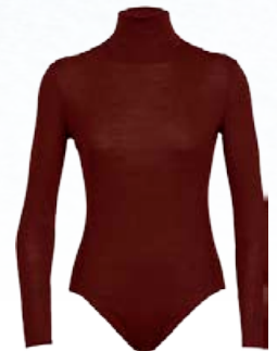
Queens samfella 14.990 kr.