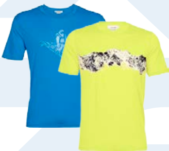
Tech Lite II stuttermabolur 12.990 kr.