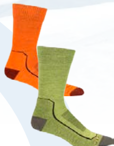
Hike+Light sokkar 3.990 kr.