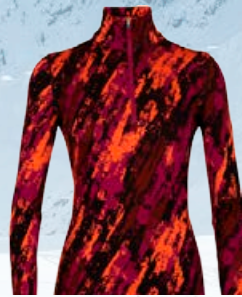
Vertex hálfrennd 22.990 kr.