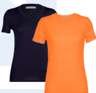
Tech Lite II stuttermabolur 11.990 kr.