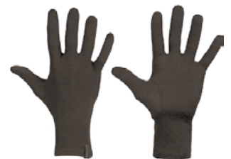
Glove Liner hanskar 4.890 kr.