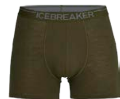
Anatomica Boxers Nærbuxur 6.590 kr.