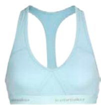
Sprite Racerback Toppur 8.490 kr.