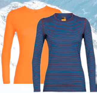
Oasis síðerma 14.990 kr.

Icebreaker Merino ull. Fyrir alla þá sem vilja hlýjan ullarfatnað sem stingur ekki og dregur ekki í sig lykt.