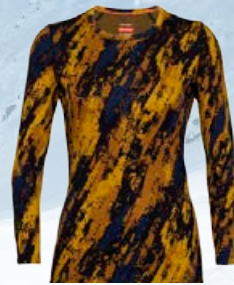
Vertex síðerma 18.990 kr.