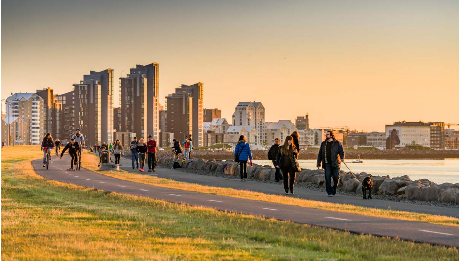
Enginn verður skilinn eftir í Reykjavík þar sem græna umbreytingin verður byggð á réttlæti, sanngirni og þátttöku. Íbúar búa við öryggi og geta haft jákvæð áhrif á eigið líf og annarra.