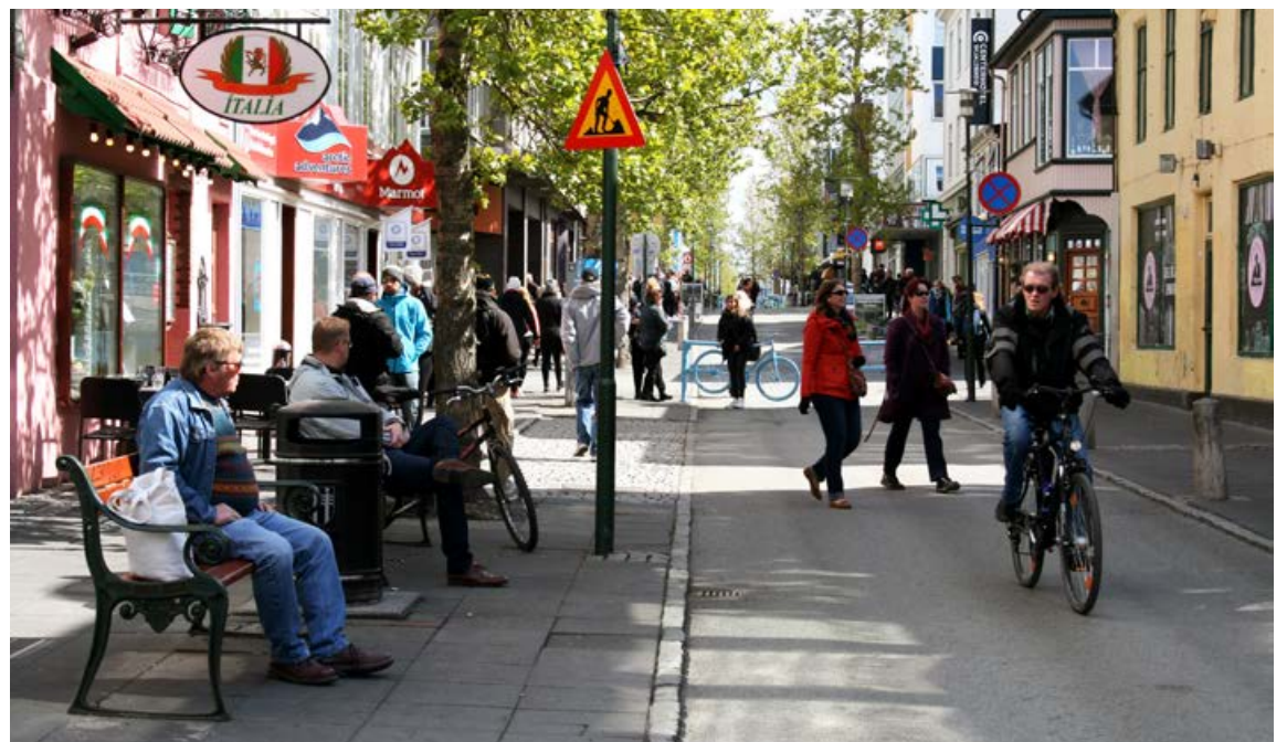
Í framtíðarsýn Græna plansins til 2030 er Reykjavík kolefnishlutlaus, blómleg, skemmtileg og heilbrigð borg.

Fjölmargar stefnur og áætlanir borgarinnar verða hluti af Græna planinu og tryggja framgang þess. Ein lykilafurð Græna plansins er öflug fjárfestingaráætlun til 10 ára, til að byggja nýjar undirstöður fyrir grænan hagvöxt framtíðarinnar. Öflug uppbygging á íbúðarhúsnæði og grænir samgönguinnviðir, ásamt sterkum félagslegum innviðum, skapa grunn fyrir góð lífsgæði í borginni. Unnið verður með fjölbreyttum hópi að því að marka atvinnu- og nýsköpunarstefnu til að tryggja nýjum og nauðsynlegum vaxtarsprotum góð skilyrði, byggja á styrkleikum núverandi stöðu og vinna gegn veikleikum og skapa þannig nýjan grundvöll fyrir atvinnulíf, vöxt og verðmætasköpun framtíðarinnar.