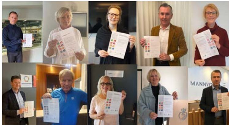
Forstjórar í Kópavogi með viljayfirlýsingu um innleiðingu heimsmarkmiða.

„Með verkefninu vill Markaðsstofa Kópavogs hvetja fyrirtæki og stofnanir í bænum til að innleiða heimsmarkmiðin í stefnu sína og daglegan rekstur og sýna þannig samfélagslega ábyrgð í verki. Allir vinni saman að því að bæta umhverfið og samfélagið og gera Kópavog, Ísland og heiminn allan