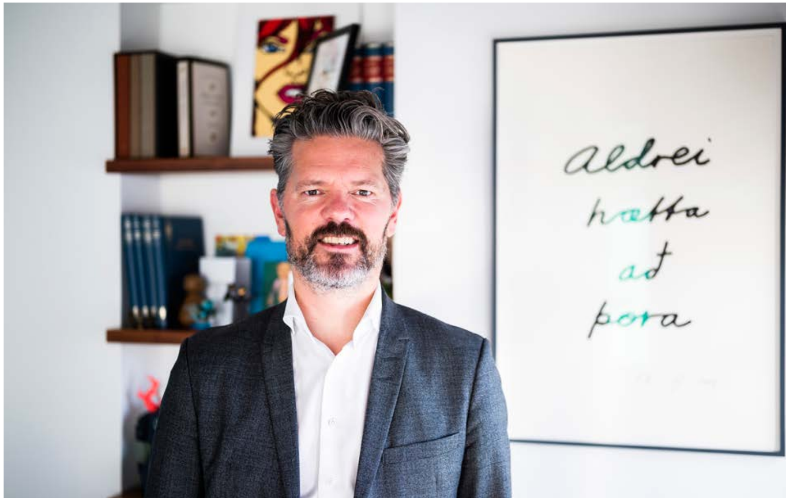
Dagur segir heimsmarkmið Sameinuðu þjóðanna kristalla hluti sem borgin, landið og heimurinn allur þurfi að ná utan um. FRÉTTABLAÐIÐ/SIGTRYGGUR ARI

„Því kalli þurfa borgaryfirvöld að svara með því að gefa fólki kost á að breyta ferðavenjum sínum í grænni átt. Við þurfum líka að flokka meira og nýta betur. Hætta að hugsa um úrgang sem rusl og skapa þess í stað verðmæti úr flestu sem til fellur og fer þá í hringrásarhagkerfið; ekki bara húsgögnin sem fara í Góða hirðinn heldur líka hvað við eigum að gera við steypuveggi, gler, plast og pappa til að gefa því framhaldslif.“