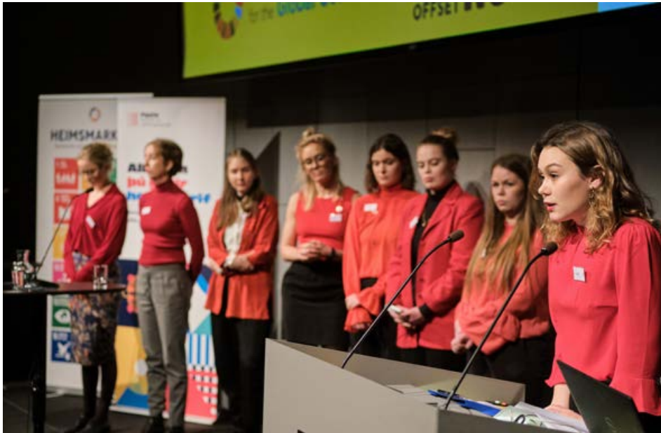
Festa hefur fundið fyrir miklum áhuga hjá ungu fólki á sjálfbærni og samfélagsábyrgð og hefur virkjað þau með sér í ýms verkefni.