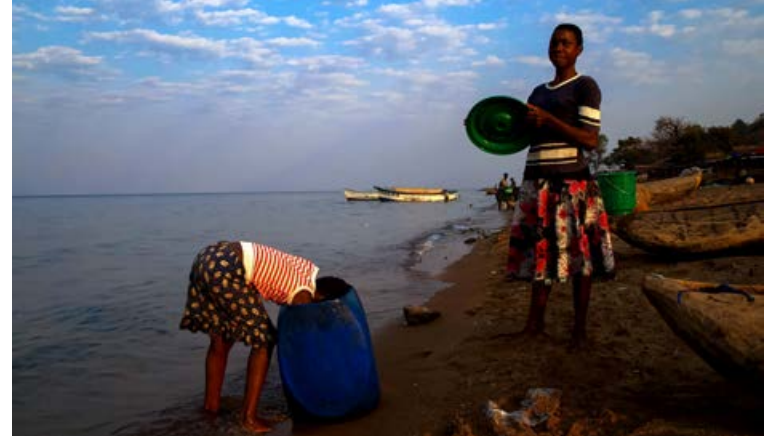
Frá Malaví þar sem Íslendingar hafa rétt hjálparhönd við uppbyggingu.