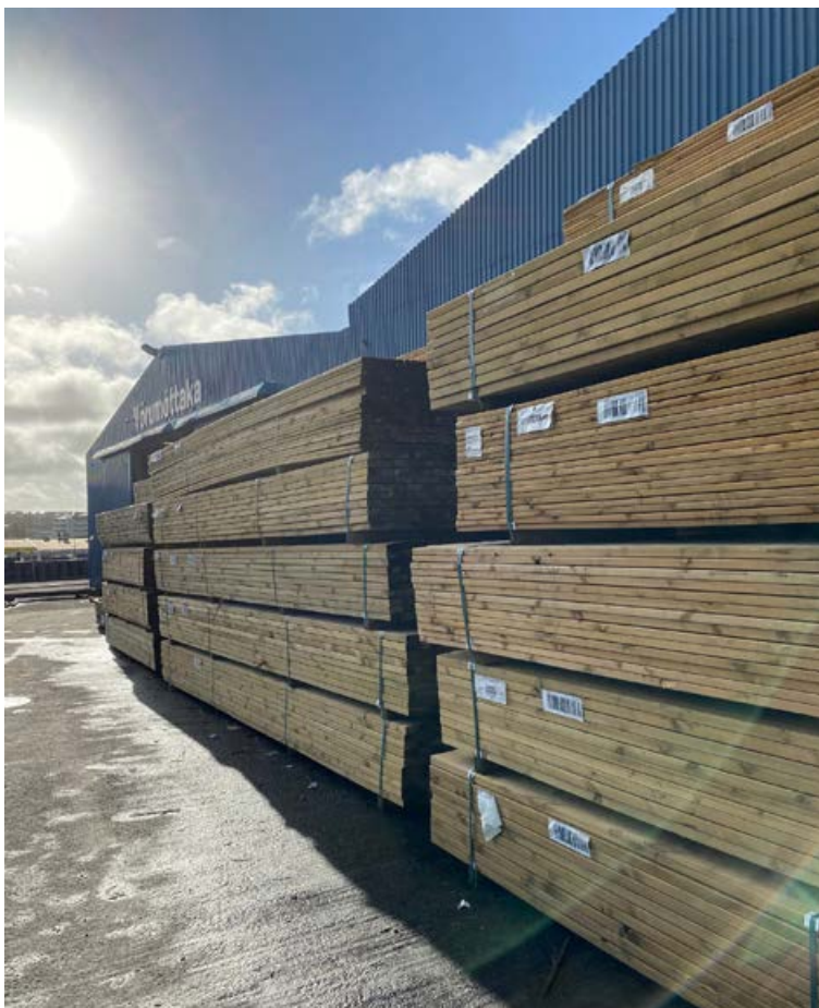
BYKO er stór innflutningsaðili á timbri og vill auka notkun á endurnýjanlegum byggingarefnum og auðvelda fólki að kaupa byggingarvörur sem eru betri með tilliti til heilsu- og umhverfissjónarmiða. Fyrirtækið vill líka auðvelda vistvænar umhverfissvottaðar framkvæmdir.