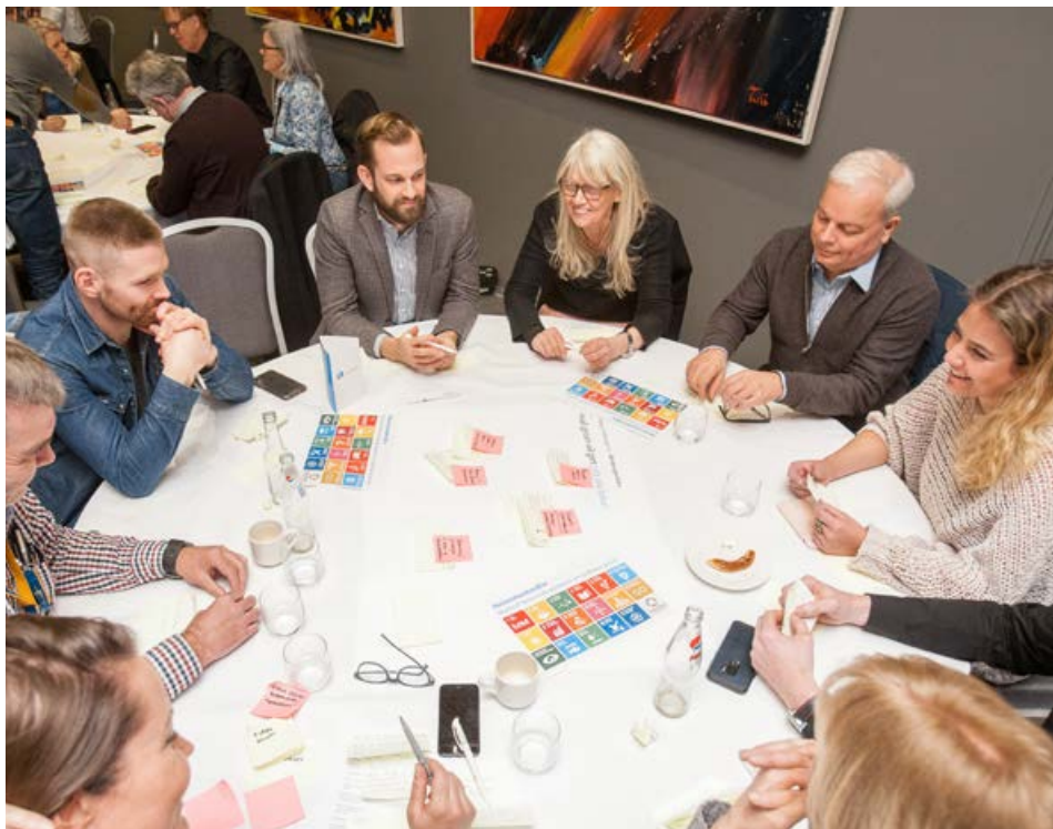
Starfsfólk Landsvirkjunar á vinnustofufundi um Heimsmarkmið SP.