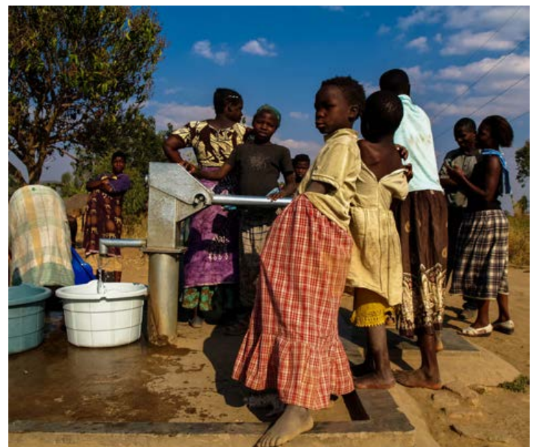
Ísland styður við starf tólf grunnskóla í Mangochi héraði. Hér eru börn og fullorðnir að sækja vatn.

Einstakur árangur hefur unnist á þessum sviðum. Bætt aðgengi kvenna að mæðra- og ungbarnaþjónustu, þjálfun heilbrigðisstarfsfólks og bygging sjúkrahúsa og fæðingardeilda í héraðinu hefur haft þau áhrif að dauðsföllum af völdum barnsburðar fækkaði um 40 prósent milli 2012-2017.