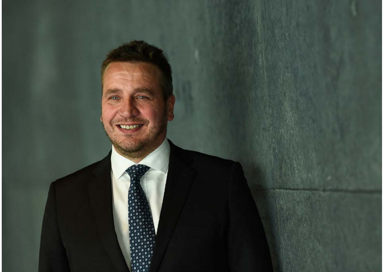
Guðlaugur Þór segir að í alþjóðlegri samvinnu leggi Ísland mikla áherslu á þau mál þar sem það hefur hvað mestu að miðla, en það eru markmiðin sem varða jafnrétti, sjálfbæra orku og sjálfbæra nýtingu hafs og lands. Vel hefur gengið að nýta íslenska sérþekkingu á sviði jarðhita.

„Þróunarríki koma fyrst til með að rétta úr kútnum efnahagslega þegar þeim tekst að fjölga sjálfbærum fyrirtækjum og efla sjálfstæðan atvinnurekstur. Fyrirtæki ráða fólk til vinnu og skapa verðmæti, sem þau útdeila með því að borga kaup. Þannig aukast umsvif sem ýta undir almenna hagsæld, alveg eins og gerðist hjá okkur fyrir ekki svo löngu síðan. Efnahagur Íslands var á pari við