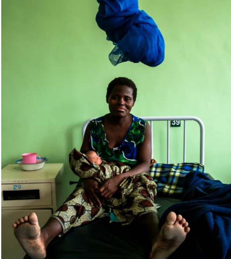
Þróunarsamvinna Íslands og Malaví á sér langa sögu. Áhersla á aukid jafnrétti kynjanna hefur spilað stórt hlutverk, einkum á undanförunum árum.

Þróunarsamvinna Íslands og Malaví á sér langa sögu en á síðasta ári fögnuðu ríkin 30 ára samstarfsafmæli. Áhersla á aukid jafnrétti kynjanna hefur spilað stórt hlutverk, einkum á undanförunum árum. Stuðningi Íslands er beint til Mangochi-héraðs. Þrátt fyrir að Malaví og Ísland séu svipuð að stærð, eru íbúar Mangochi-héraðs tæplega fjórum sinnum fleiri en allir Íslendingar. Í Mangochi styður Ísland meðal annars við valdeflingu kvenna með því að styrkja starf héraðsins í heilbrigðis-, vatns- og menntamálum.