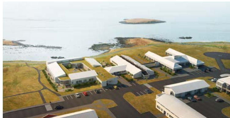
Nýbygging við Hjúkrunarheimilið á Höfn. Húsið er með grasþaki og er nú unnið að vistvænni hönnun og vottun skv. BREEAM-vottunarferlinu. Arkitektar eru Basalt arkitektar.

málum og setur af stað aðgerðir til að hrinda þeim í framkvæmd. „Þetta á líka við um vörur. Þeir sem framleiða vörur, hvort sem það er steinull eða húsbýgging, geta látið reikna út kolefnissporið og fengið ráðleggingar um hvað hægt er að gera til bóta. Hægt er að reikna út kolefnisspor fyrir allt mögulegt,“ segir Helga og tekur sem dæmi Steinullarverksmiðjuna á Sauðárkróki. „Steinullin er meðal annars framleidd úr basaltsandi úr fjórinni og skeljasandi frá Faxaflóa. Við reiknuðum út kolefnisspor steinullarinnar og það er 3,5 sinnum lægra en hjá þekktum framleiðendum erlendis. Þetta er meðal