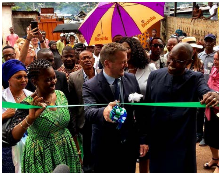
Guðlaugur segir að efnahagur Íslands hafi verið á pari við Afríkuríki sunnan Sahara fyrir hundrað árum, en að við höfum rífið okkur upp með því að byggja upp heilbrigða atvinnuvegi sem borga fyrir almenna velmegun og að Afrika geti gert það sama.

Í framhaldinu bendir hann á að afurðir frá fátæku ríki margfaldist gjarnan í verði í hagkerfi þar sem kaupmáttur er mikill. Oft séu þær kostakaup fyrir þá sem hafa meira á milli handanna. Í þessu sára misræmi, sem keppikefli allrar þróunarsamvinnu sé að uppræta, felist tækifæri til að brúa bilið. „Með réttum formerkjum geta fyrirtæki í okkar heimshluta