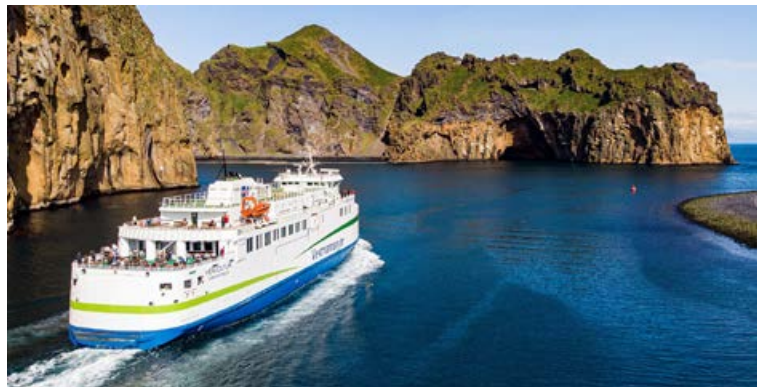
EFLA hefur unnið að landtengingu við rafmagn fyrir skip í höfn.