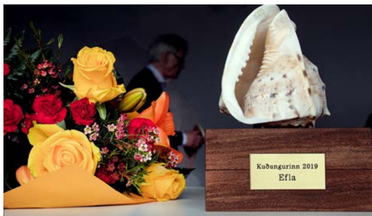
EFLA er núverandi handhafi Kuðungsins, sem er umhverfisviðurkenning umhverfis- og auðlindaráðuneytisins og var veitt fyrir á þessu ári.

Hún leggur áherslu á að mikilvægt sé að fara úr því sem kallast linulegt hagkerfi yfir í hringrásarhagkerfi. „Við þurfum að hætta að framleiða, nota, menga og henda og fara yfir í að endurnota, gera við, endurvinna og samnýta. Eftirspurn eftir grænum vörum og þjónustu hefur aukist og í auknum mæli verður fjármagni beint í grænar fjárfestingar og umhverfisvænni verkefni,“ segir hún.