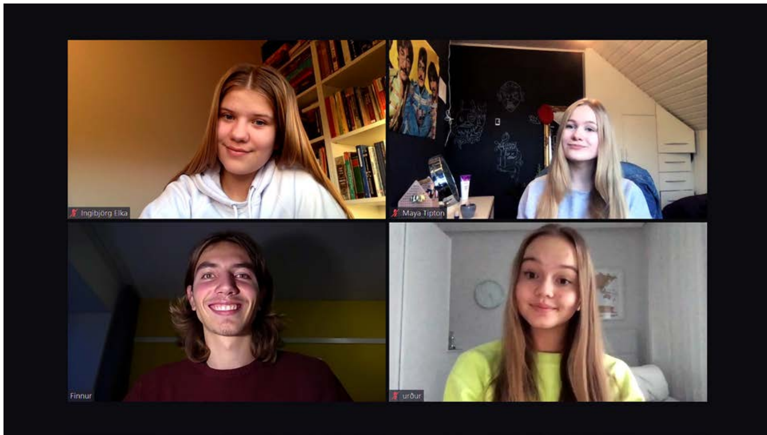
Krakkarirnir í ungmennaráðinu hittast reglulega á netfundum og ræða málin. Þau hafa gert kannanir sín á milli og má sjá niðurstöður þeirra hér að neðan.