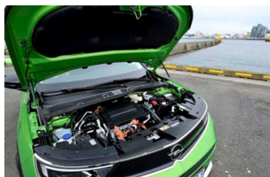
Rafmótorinn er 134 hestöfl og viðbragðið 8,7 sekúndur í hundraðið.

» Það er gott að keyra bílinn og hann er með hljóðlátari rafbílum.