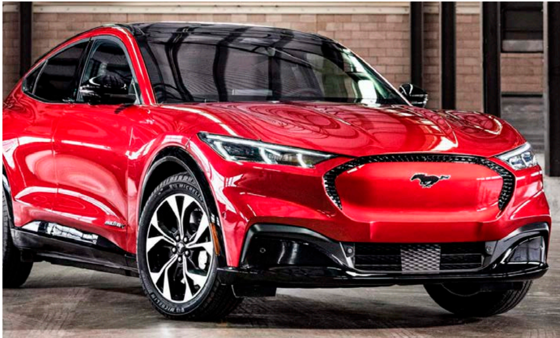
Ford Mustang Mach E rafbíllinn seldist í 1.384 eintökum í maímánuði í Noregi.