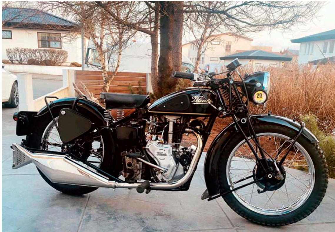
Velocette MAC 350 hjólið kom nýtt til landsins 1936 og lítur nú aftur eins vel út 85 árum seinna.