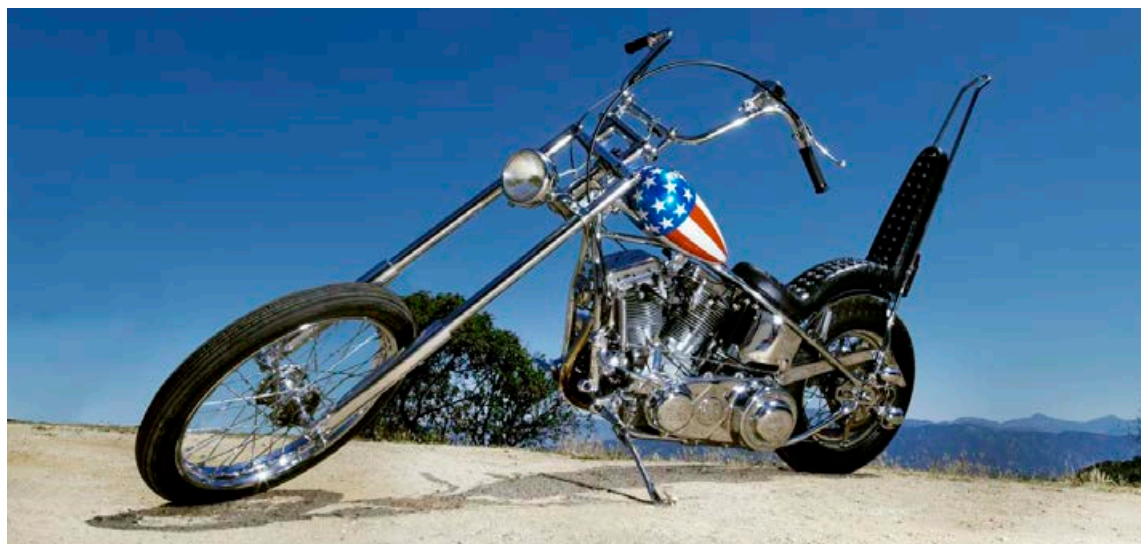
Hjólið sem selt var 2014 hefur verið tilefni deilna og margir dregið uppruna þess í efa, meðal annars Peter Fonda.