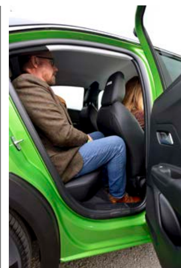
Pláss er af skorum skammti fyrir fætur og hár síls flækist fyrir.

Opel Mokka-e kostar frá 4.590.000 kr. í grunnútgáfu en líklega vilja flestir allavega Elegance-útgáfu með leiðsögukerfi, bakmyndavél og nálægðarskynjurum. Ekki þarf að bæta miklu við til að fá vel búna GS-Line eða Ultimate-útgáfu. Eins og búast má við er verð á Peugeot 2008 í svipuðum tón en grunnverð hans er 4.490.000 kr. Vel búinn MG ZS EV er frá 4.090.000 kr. og Hyundai Kona Electric frá 5.290.000 kr. með minni rafhlöðunni svo að Opel Mokka liggur um miðjan flokkinn í verði. ■