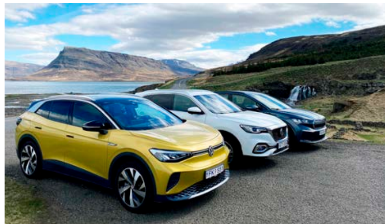
Tveir stigahæstu bílarnir komu úr flokki minni jeppa og jepplinga en þar sigraði VW ID.4 örugglega á undan Skoda Enyaq og MG EHS PHEV.