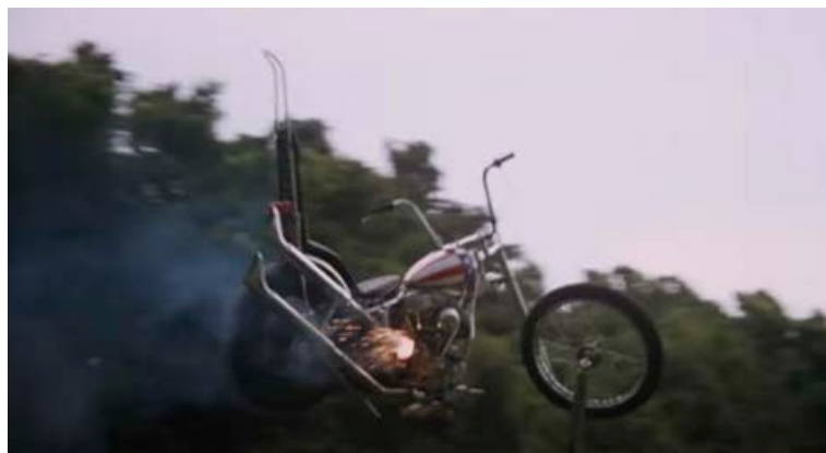
Atriðið úr myndinni þegar hjólið fer út af eftir að Peter Fonda er skotinn.