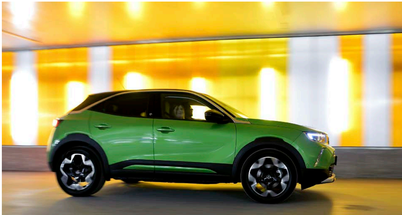
Opel Mokka vekur athygli fyrir frísklegt útlit og glaðlegt litaval.

Það er tvennt sem að setja má út á við inn- eða útstig en það er annars vegar fyrirferðarmiklir B-bitar og há brik við sílsa. Þegar inn er komið er plássið hins vegar furðu gott og auðvelt fyrir hávaxna að finna góða akstursstillingu. Plássið í aftursætum er viðunandi fyrir tvo fullorðna en aftur er sílsinn fyrir fótum farþeganna. Farangursrymið er heldur ekki til að hrópa húrra fyrir en flestir samkeppnisaðilar gera betur í þeim efnum.