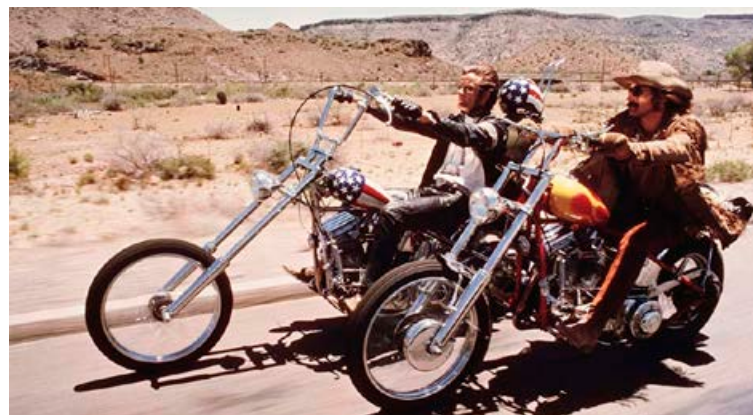
Captain America er hjól Peter Fonda fyrir aftan hjól Dennis Hopper.