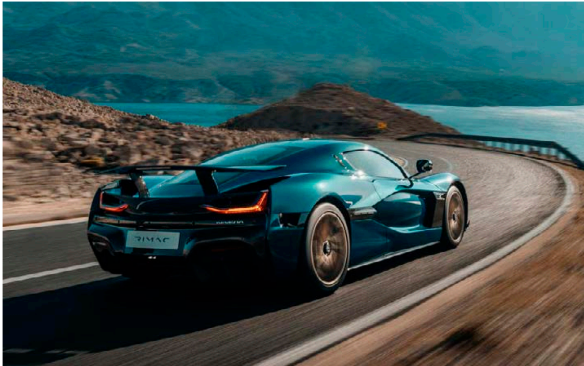
Rimac ofursportbíllinn telst nú framleiðslubíll og mun því eflaust reyna við einhver met áður en langt um liður.