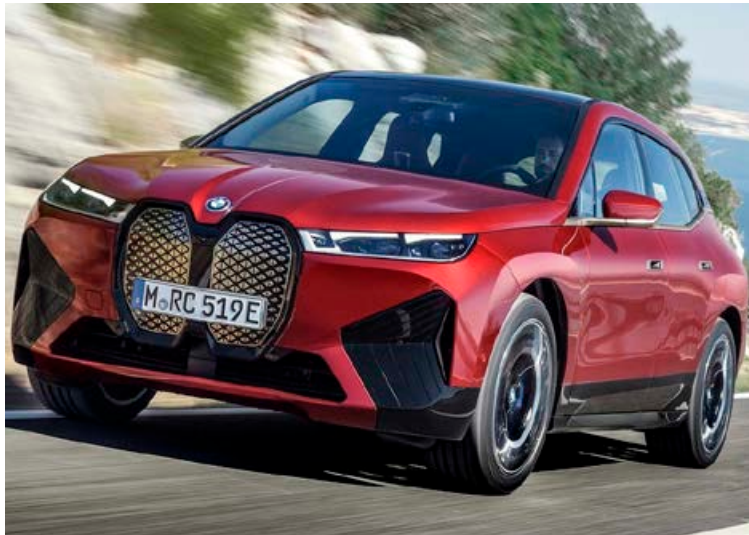
BMW iX vekur athygli fyrir stórt nýrnagrill sem í raun er óþarfi í rafbil.