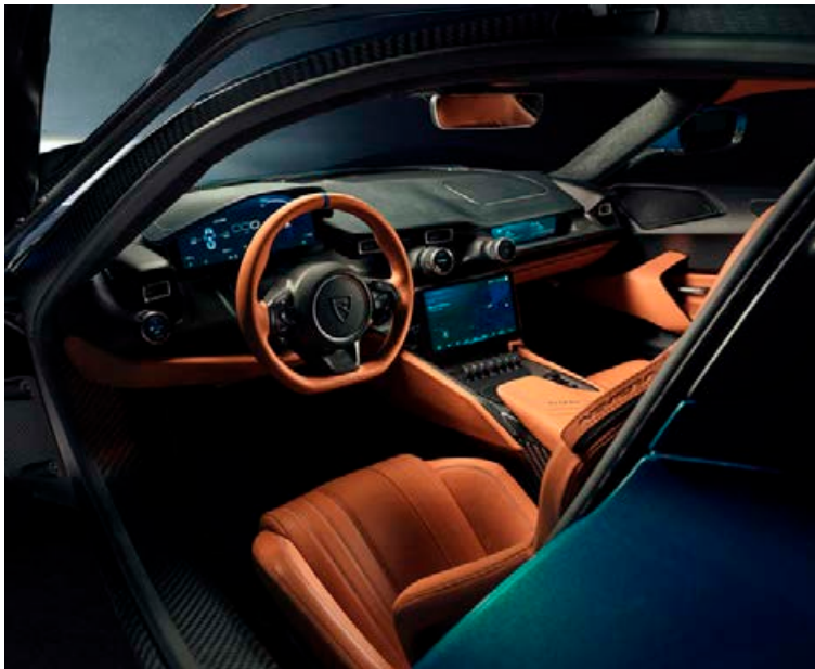
Innréttingin byggir á tölvuskjám sem tala við hugbúnaðarkerfi bílsins.

Aflið kemur frá H-laga 120 kWst rafhlöðu undir bílnum sem er gefin upp fyrir 550 km drægi. Lag rafhlöðunnar er nokkurs konar undirstaða fyrir einrýmis yfirbyggingu bílsins sem öll er úr koltrefjum og er stærsta koltrefja-eining sem framleidd er í bílaheiminum í dag. Mikið er lagt upp