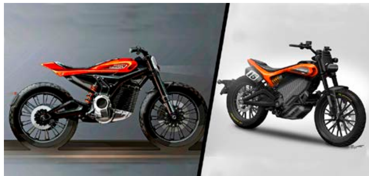
Líklega er nýja LiveWire rafhjólíð með þessu FlatTrack-útliti, en eins og sjá má af númeraplötu er það hugsað fyrir götuakstur.

Nýja hjólið verður frumsýnt á mótörhjólasýningu þann 8. júlí og er hugsanlega með FlatTrack-hönnun ef marka má hönnunarmyndir frá fyrirtækinu. Stóra LiveWire