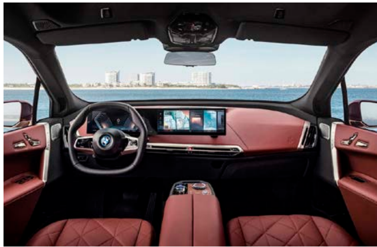
Sexhyrnt stýrishjól og bogadregið mælaborð með tveimur upplýsingaskjáum verður í bílunum, annar 12,3 tommur og hinn 14,9 tommur.

þarf á að halda er einfalt og ódýrara hjól fyrir yngri kaupendur og FlatTrack-hjólið gæti einmitt höfðað til þeirra. ■