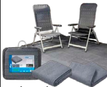
DÚKUR Í FORTJALD