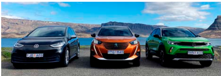
Allir bílarnir í flokki stærri fólksbíla voru rafbilar og bar þar VW ID.3 sigur úr þýtum en systurbílarnir Opel Mokka og Peugeot e-2008 komu næstir.

Land Rover Defender var eini órafmagnaði billinn í valinu og sigraði flokk stærri jeppa og jepplinga en tengiltvinnbílarnir Kia Sorento og Ford Explorer fylgdu í kjölfarið.