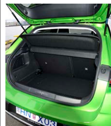
Farangursrymi er 310 lítrar sem er minna er hjá samkeppnisaðilum.