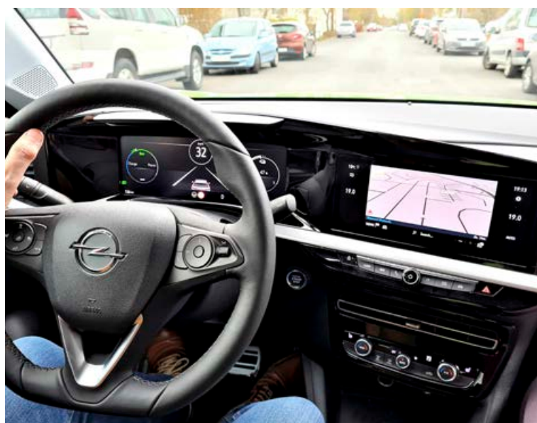
Uppsetning mælaborðs er einföld og blátt áfram og sem betur fer er hægt að stjórna miðstöð og hljóðstyrk með hefðbundnum snúningstökkum.