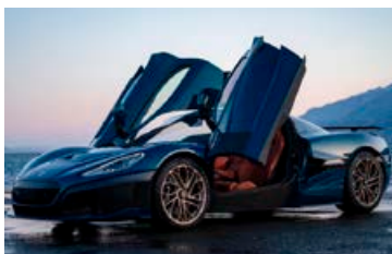
Hurðirnar eru vængjahurðir sem opnast á ská upp á við.

úr loftflæði eins og búast má við og hlutir eins og vindskeið, botnplata, vinddreifari og húdd breyta stöðu sinni eftir akstri og hraða bílsins. Aðeins 150 Rimac Nevera verða smíðaðir og síðan seldir í þremur útfærslum, GT, Signature og Timeless. Hvert eintak mun kosta um 300 milljónir króna svo við skulum ekki búast við slíkum grip hingað til lands í bráð. ■