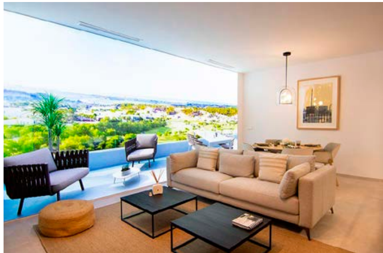
Á Las Colinas er fjölbreytt úrval af fallegum íbúðum með frábæru útsýni yfir golfvöllinn. Starfsfólk Spánareigna veitir persónulega þjónustu við kaupin.

Um þessar mundir eru vextir hagstæðir og hægt er að tryggja fasta vexti á lánum til allt að 20-25 ára, sem auðveldar fólki kaupin og verðtryggð lán þekkjast ekki á Spáni. Höfuðstóll lánsins lækkar við hverja afborgun og eigið fé í eigninni eykst.