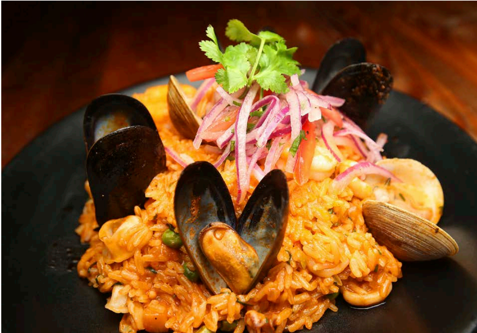
Paella með bláskel og smokkfiski. Sannkallaður veislumatur að spænskum sið.