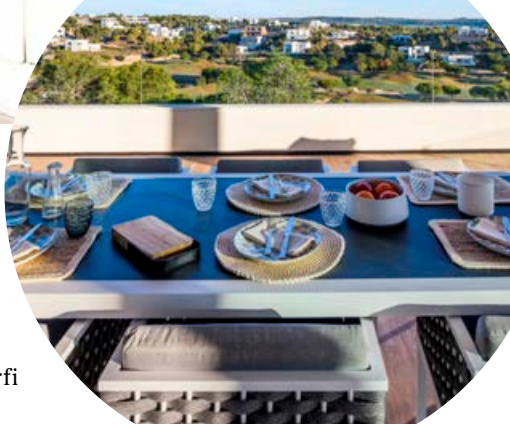
Marga dreymir um að eiga sitt eigið afdrep á Spáni, annaðhvort til að heimsækja reglulega eða til að flytja suður í hlýrra loftslag.