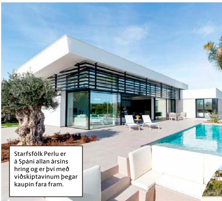
Starfsfólk Perlu er á Spáni allan ársins hring og er því með viðskiptavinum þegar kaupin fara fram.