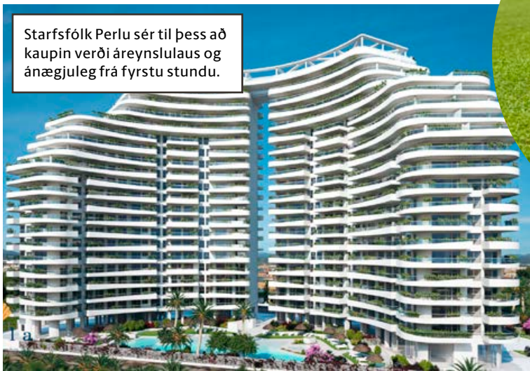
Starfsfólk Perlu sér til þess að kaupin verði áreynslulaus og ánægjuleg frá fyrstu stundu.