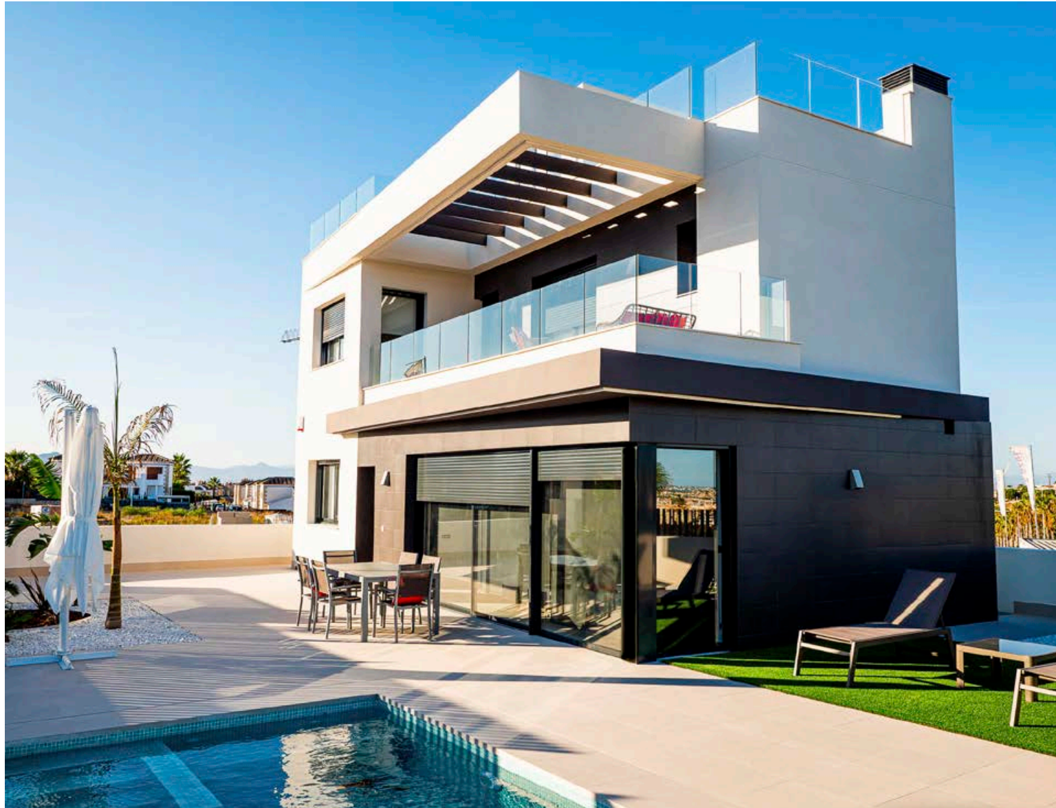
Falleg einbýlishús við La Finca golfvöllinn á frábæru verði. Stílhrein hönnun og fagaður glæsileiki. Stutt á golfvöllinn og notalegur þjónustukjarni með verslunum og veitingastöðum í göngufæri. Hægt er að velja um mismunandi stærðir á einbýlishúsum eða íbúðum á þessu frábæra svæði.

„Við aðstoðum viðskiptavinum okkar við allt kaupferlið, frá upphafi til enda, allt frá því að við förum yfir kaupóskir, mismunandi tegundir eigna og staðsetningu, verð, skipulag skoðunarferðar og þar til skrifað er undir kaup-