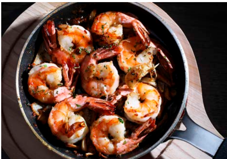
Hvítlauksrækjur eru tapasréttur sem flestir fá sér þegar Spánn er heimsóttur.

Skolið bláskelina undir köldu rennandi vatni og fjarlægjið það sem er kallað „skegg“. Hendið þeim skeljum sem virðast skaddaðar. Setjið í stóran pott ásamt hvítvíni. Leggið lok á pottinn og látið sjóða