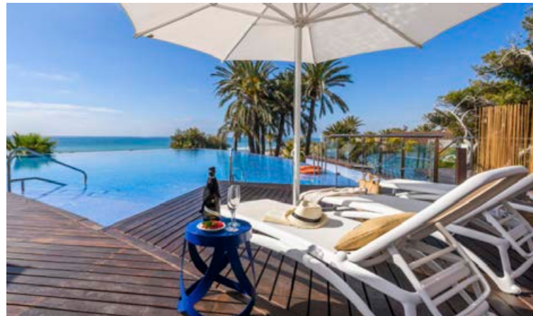
Það getur verið notalegur lífsstíll á Spáni.

Lögd er sérstök áhersla á persónulega þjónustu fyrir hvern. „Þarfir viðskiptavinum eru mismunandi og við viljum sinna hverjum og einum fyrir sig. Viðskiptavinir okkar hafa verið mjög ánægðir með þjónustuna í gegnum árin, enda fáum við í dag flesta nýja viðskiptavinum til okkar vegna meðmæla frá eldri viðskiptavinum. Það finnst okkur best.“