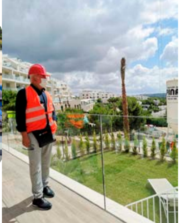
Orra segir þau leggja aðaláherslu á nýbyggingar vegna þess að það hafa orðið miklar framfarir í byggingargæðum á Spáni síðustu árin.