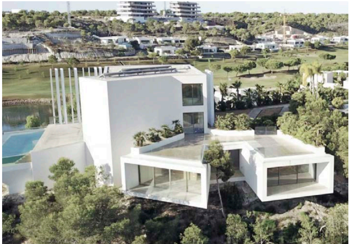
Armani-villan Morning Breeze, á Las Colinas-golfvöllinum, hönnuð af Monicu Armani. Fullkominn glæsileiki sem vakið hefur mikla athygli. Las Colinas var valinn besti golfvöllur á Spáni árið 2020.