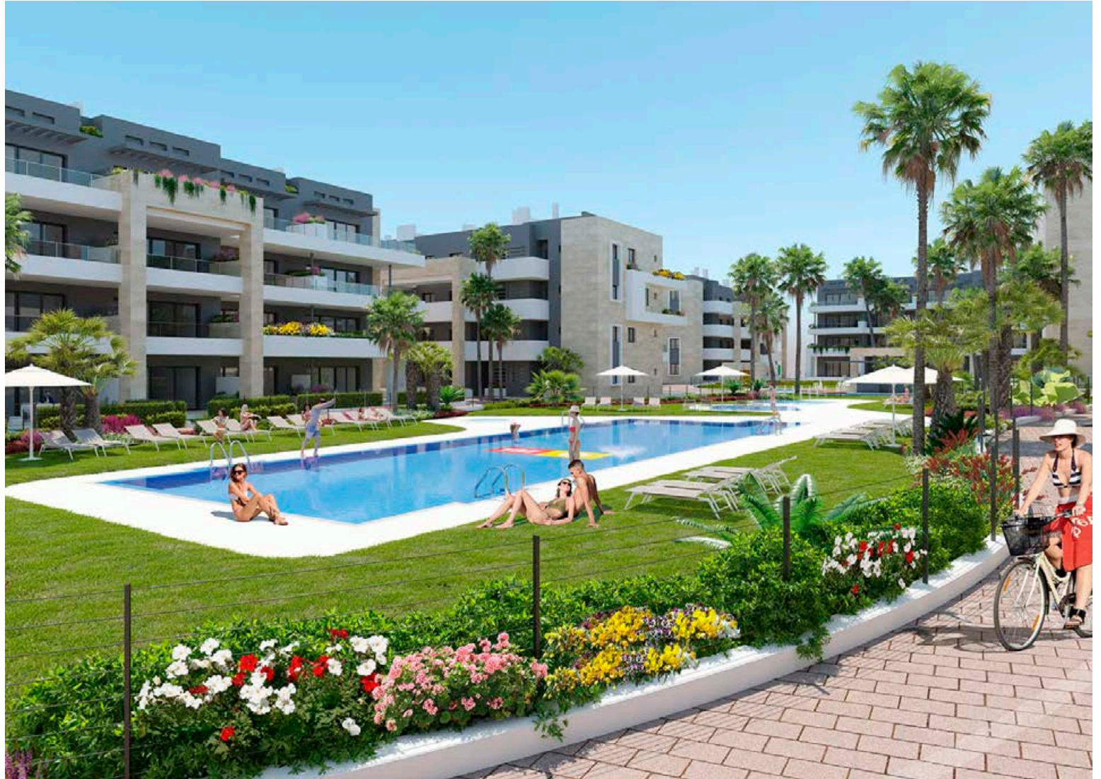
Fallegar íbúðir og glæsileg sameign í Flamenca Village njóta mikilla vinsælda. Sundlaugargarður með mörgum sundlaugum, heitum pottum, leiksvæði fyrir börnin, göngu- og skokkleiðum, veitingastöðum og verslunum inni á lokuðu svæði. Örstutt göngufæri á ströndina, La Zenia Boulevard og laugardagsmarkaðinn á Playa Flamenca. Hagstæðir húsgagnapakkar eru í boði fyrir viðskiptavinum Spánareigna. Verðið á allri neysluvöru er mjög hagstætt og veðrið frábært.

Spánareignir eru í samstarfi við alla helstu byggingaraðilana á svæðinu og tryggir það viðskiptavinum okkar góða yfirsýn