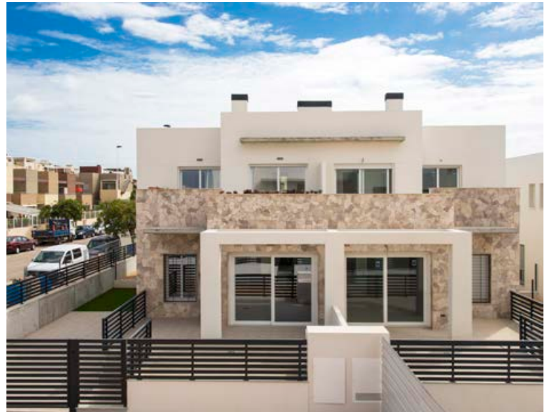
Íbúðir og sérbylí með tveimur eða þremur svefnherbergjum, tveimur eða þremur baðherbergjum og sameiginlegum sundlaugargarði njóta mikilla vinsælda um þessar mundir. Spánareignir bjóða upp á gott úrval eigna á ýmsum stöðum á mjög hagstæðu verði, alveg niður í 25-30 milljónir.

Nánar upplýsingar má skoða á www.spanareignir.is