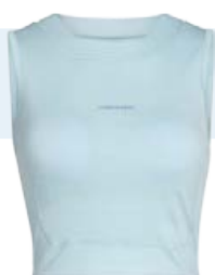
Zoneknit Bra Tank Toppur 12.990 kr.