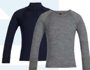
Barna bolur 🐾 Verð frá 8.590 kr.