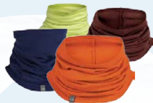
Flexi Chute Hlýir hálskragar 4.990 kr.