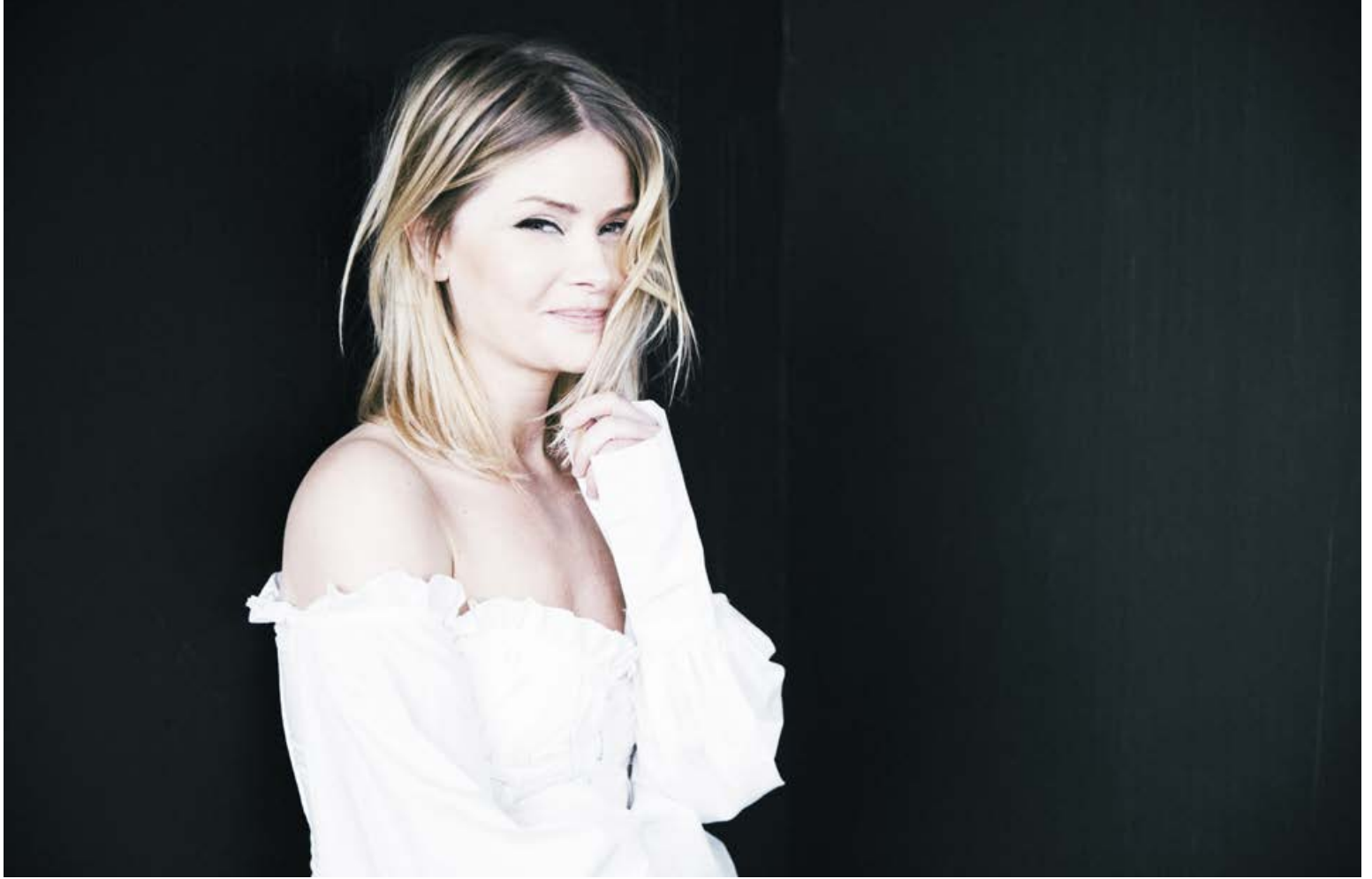
Aníta Briem hefur gert garðinn frægan hér heima og beggja vegna Atlantshafs.

Munur á Evrópu og Ameríku Hvaða áhrif hefur Covid haft á kvíkmyndaframleiðslu?