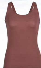
Siren Tank Hlýrabolur 8.390 kr.