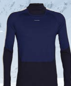
Sonebula Hár kragi 15.990 kr.