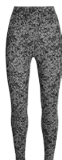
Fastray High Rise Leggings 16.590 kr.