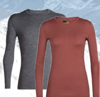
Oasis Síðerma 14.990 kr.

Icebreaker Merino ull. Fyrir alla þá sem vilja hlýjan ullarfatnað sem stingur ekki og dregur ekki í sig lykt.