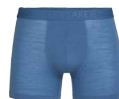
Anatomica Cool-Lite Boxers Nærbuxur 6.590 kr.