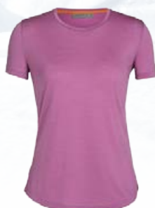
Sphere II Stuttermabolur 11.990 kr.