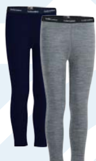
Barna leggings 🐾 Verð frá 8.590 kr.