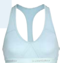
Sprite Racerback Toppur 8.490 kr.