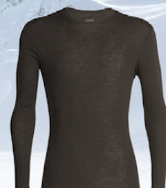
Everyday Síðerma 12.990 kr.