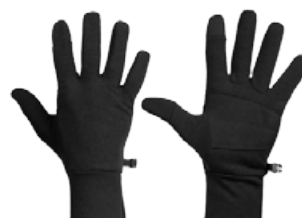
Sierra Hanskar 6.690 kr.