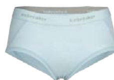
Sprite Hot Pants Nærbuxur 6.990 kr.