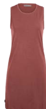
Yanni Kjöll 13.990 kr.