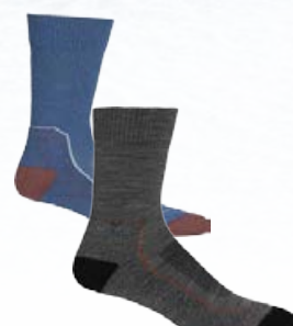
Hike+Light Sokkar 3.990 kr.