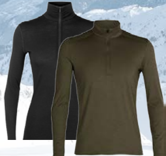
Oasis Hálfrennd 15.990 kr.