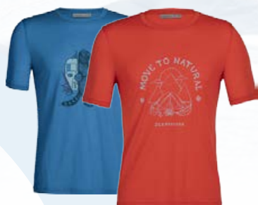
Tech Lite II Stuttermabolur 12.990 kr.