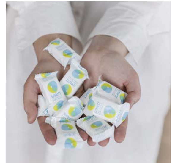
Allur ágóði sölu á Sonett vörum fer í Sonett styrktarsjóð, sem styrkir ýmis góðgerðar- og umhverfismál.

➤ Mér líður bara svo vel að nota þessar vörur, því þær innihalda ekkert eitur.