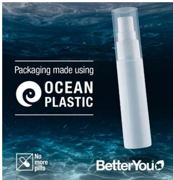
Allar vörur eru pakkaðar í endurunnið plast úr sjó sem er allt 100% endurvinnanlegt.

Better You línan býður upp á fjölbreytt úrval af vítamínum og steinefnum sem öll eru í formi munnúða.