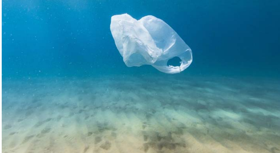
Á hverju ári berst gífurlegt magn af plasti í sjóinn, eða um átta milljón tonn sem hefur áhrif á alla jörðina.

Þegar velja skal bætiefni til inntöku er ekki úr vegi að skoða úr hverju umbúðir eru gerðar.