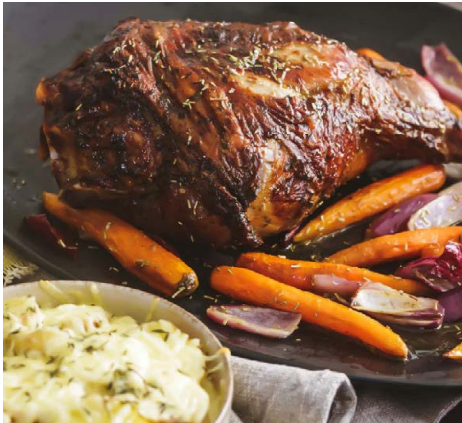
Heiðalambið frá Kjarnafæði hefur verið í upphaldi hjá mörgum enda einstaklega bragðgott.

Við þurfum hins vegar að horfa raunhæft á hlutina en ekki fara fram úr okkur í eitthvað sem að lokum bætir ekkert. Þetta snýst um að vera lausnamiðaður og