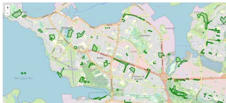
Skjáskot af síðunni. Grænu svæðin sýna hvar hefur verið plokkað.

„Samkvæmt okkar talningu þá plokkuðu Íslendingar rúmlega 5