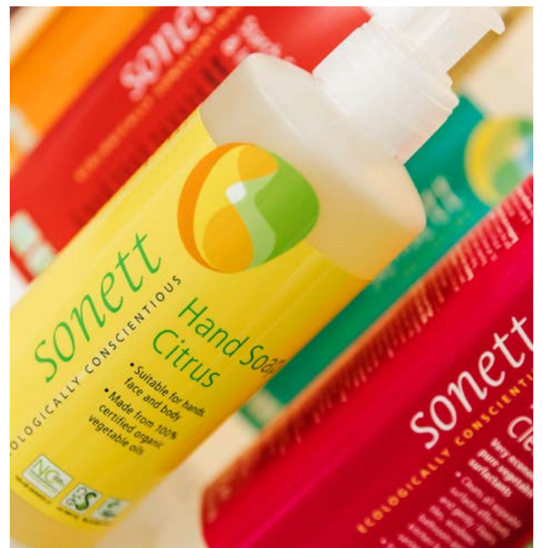
Vörurnar hafa gríðarlega góða virkni en eru einnig mildar fyrir húðina. Ekki skemmir fyrir að þær eru með dásamlegum ferskum náttúrulegum ilmi.