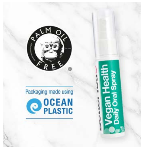
Better You stendur framarlega í flokki þegar kemur að umhverfisvænum umbúðum.

Fyrirtækið Better You nýtur sífellt aukinna vinsælda en það er ekki að ástæðulausu þar sem mikið er lagt upp úr gæðum. Better You hefur unnið að þessum málum hördum höndum og með framúrskarandi hóp vísindamanna sem eru í fararbroddi í plast- og umbúðatækni. Fyrirtækið tryggir að vöruúrval þeirra hafi sem minnst áhrif á jörðina og eru því allar vörur lausar við pálmaolíu og eru pakkaðar í endurunnið plast úr sjó sem er allt 100% endurvinnanlegt.