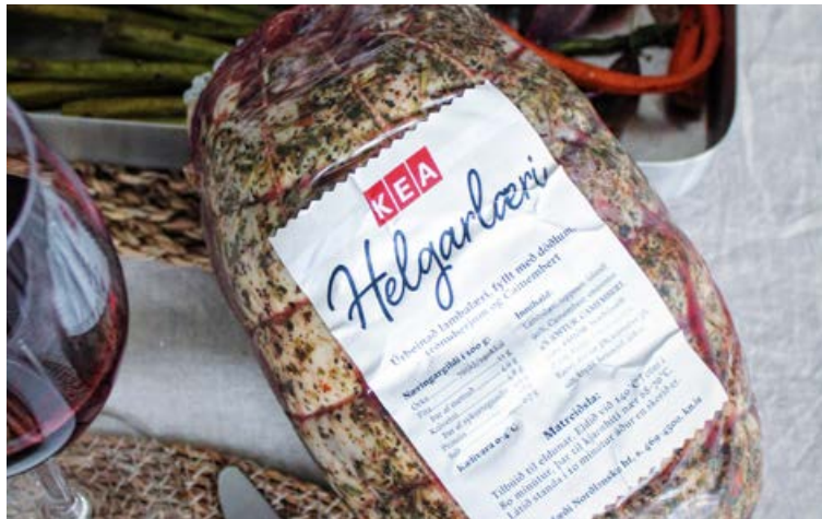
Úrbeinað helgarlæri frá KEA er vinsælt á borðum Íslendinga.