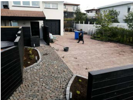
Ekkert verk er of flókið fyrir Garðabjónustu Kópavogs.