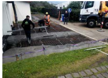
Garðverkin eru unnin frá A til Ö.