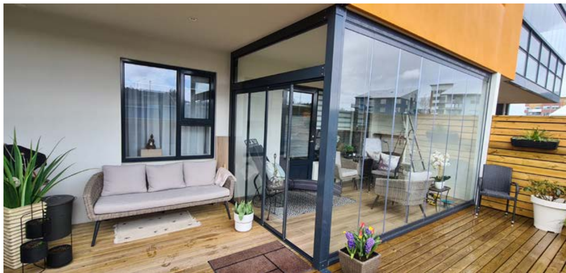
Hægt er að fá margar útfærslur af sólskálum og svalaskjólum.