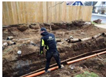
Hér er skipt um lagdir og dren.