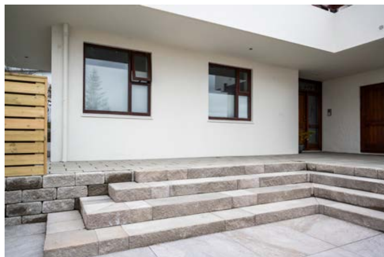
Hér eru flísahellur á dvalarsvæðinu fyrir framan, 30x40 hellur á gönguleiðum og svo stiklur í mól á svæðinu sem grípur kvöldsólina.