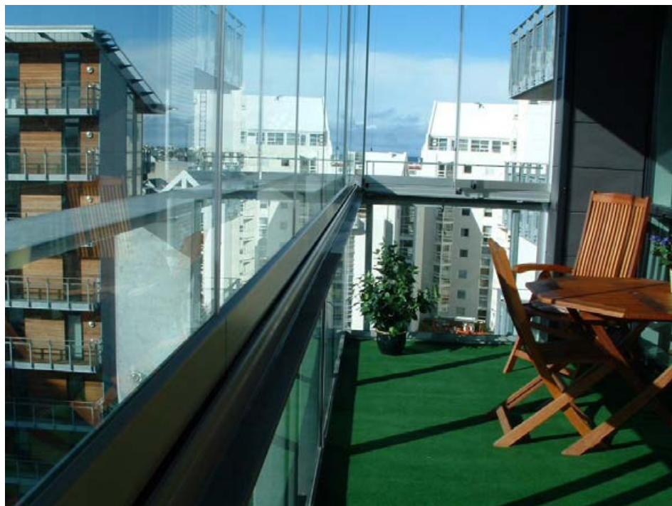
Með svalaskjóli frá Cover er hægt að auka notagildi svala mikið og njóta þeirra árið um kring.