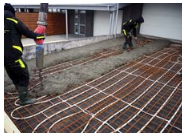
Hér er hitalögn sett undir bílaplan.