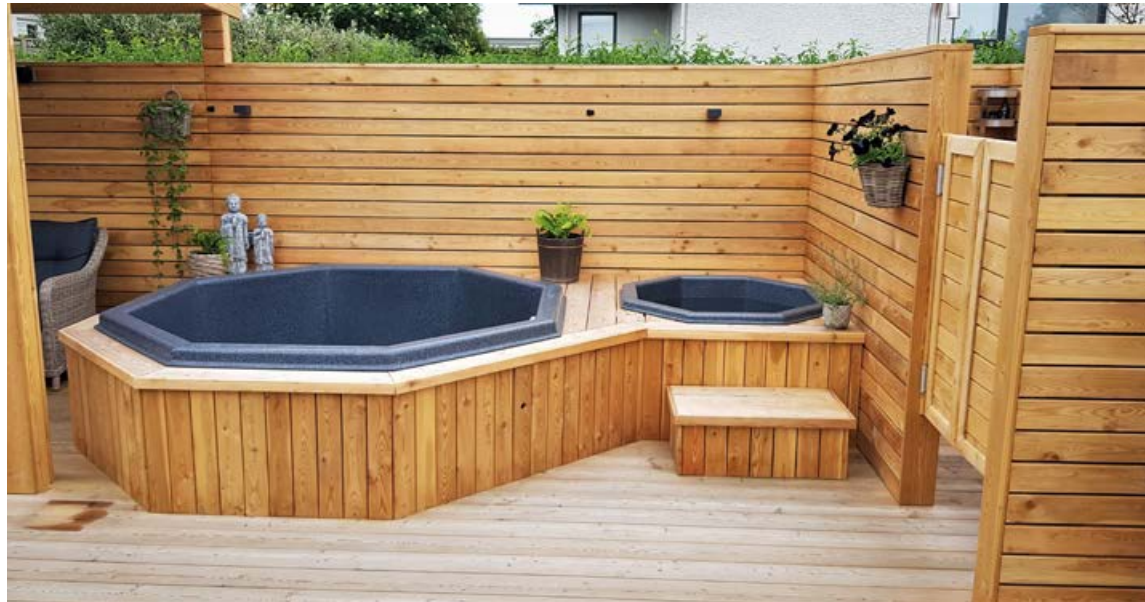
Heitur og kaldur pottur er frábær tvenna. Það er alltaf að aukast að fólk taki kalda pottinn með þeim heita.