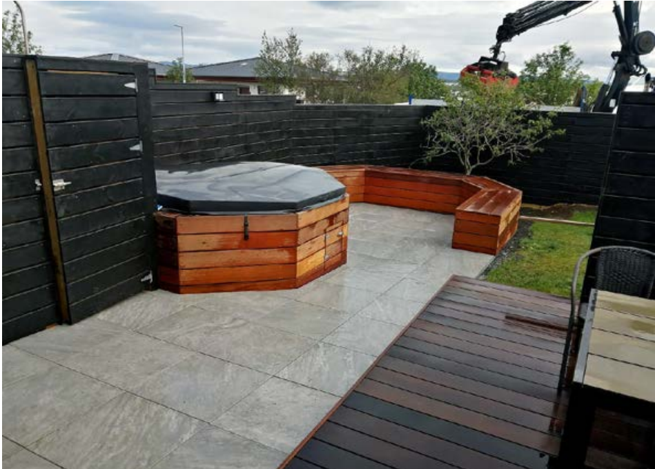
Hér má sjá dæmi um glæsilegan sólpall, heitan pott, skjólveggi og bekki frá Garðabjónustunni.