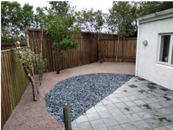
Hellulögn í bland við trjábeð og mól er glæsilegt saman.