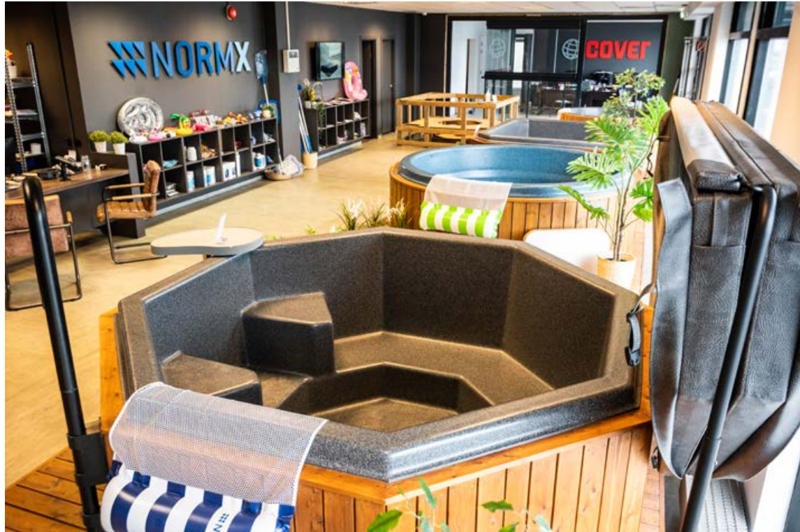
Í versluninni í Auðbrekku 6 í Kópavogi má skoða alla pottana ásamt úrvali fylgi- og aukahluta fyrir pottinn.