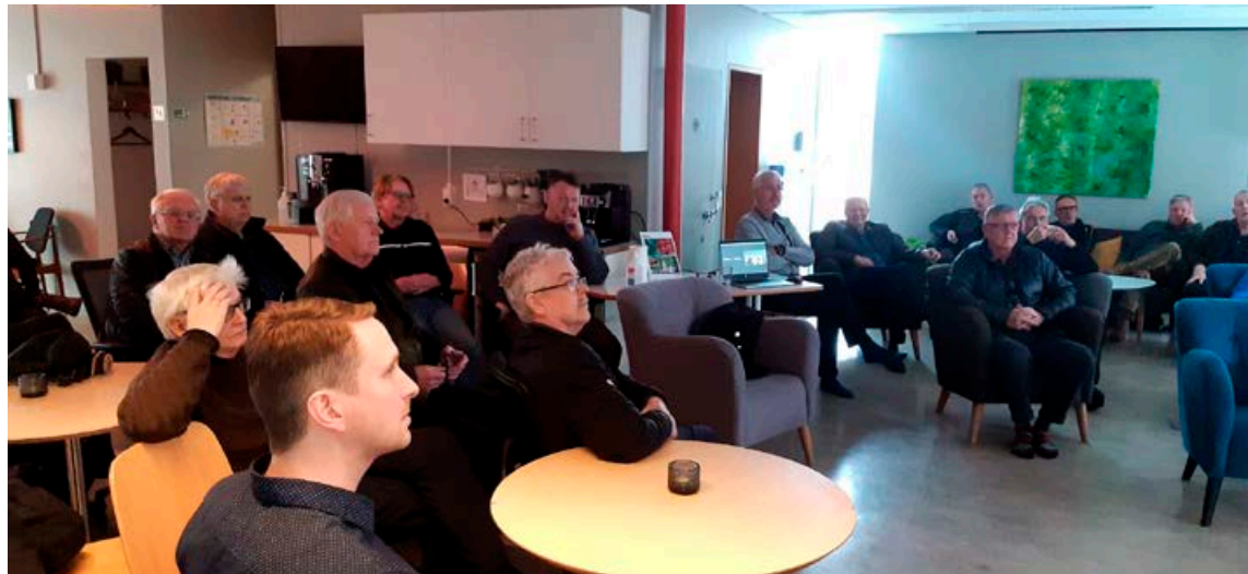
Markmiðið með samfélaginu Hellinum er einmitt að stuðla að aukinni félagslegri virkni, fræðslu og betri lífsgæðum hjá karlmönnum sem greinst hafa með blöðruhálskirtilskrabbamein.

Einu sinni í mánuði eru léttir kvöldverðir (fyrir bæði einstaklinga, karla, maka og hjón) þar sem fólk borðar saman og spjallar um daginn og veginn.